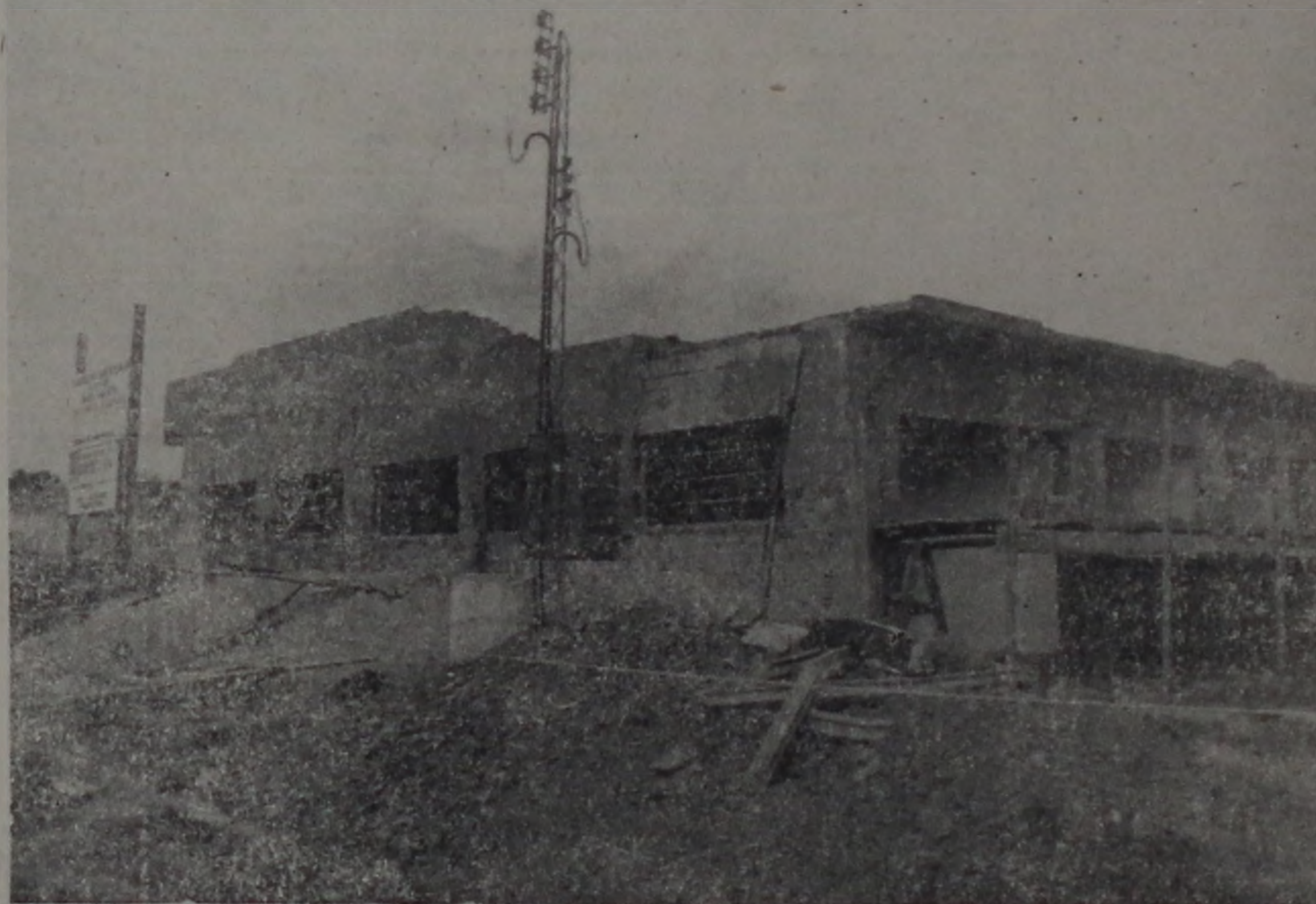
O vendaval de 2 meses atrás atrasou, a conclusão das obras em vários meses. (Janeiro 74)

Lençóis Paulista está de parabéns e a classe canavieira também, pela construção de mais um Hospital que atenderá vasta região, fato que se traduz no crescente desenvolvimento, em todos os setores, do nosso município.