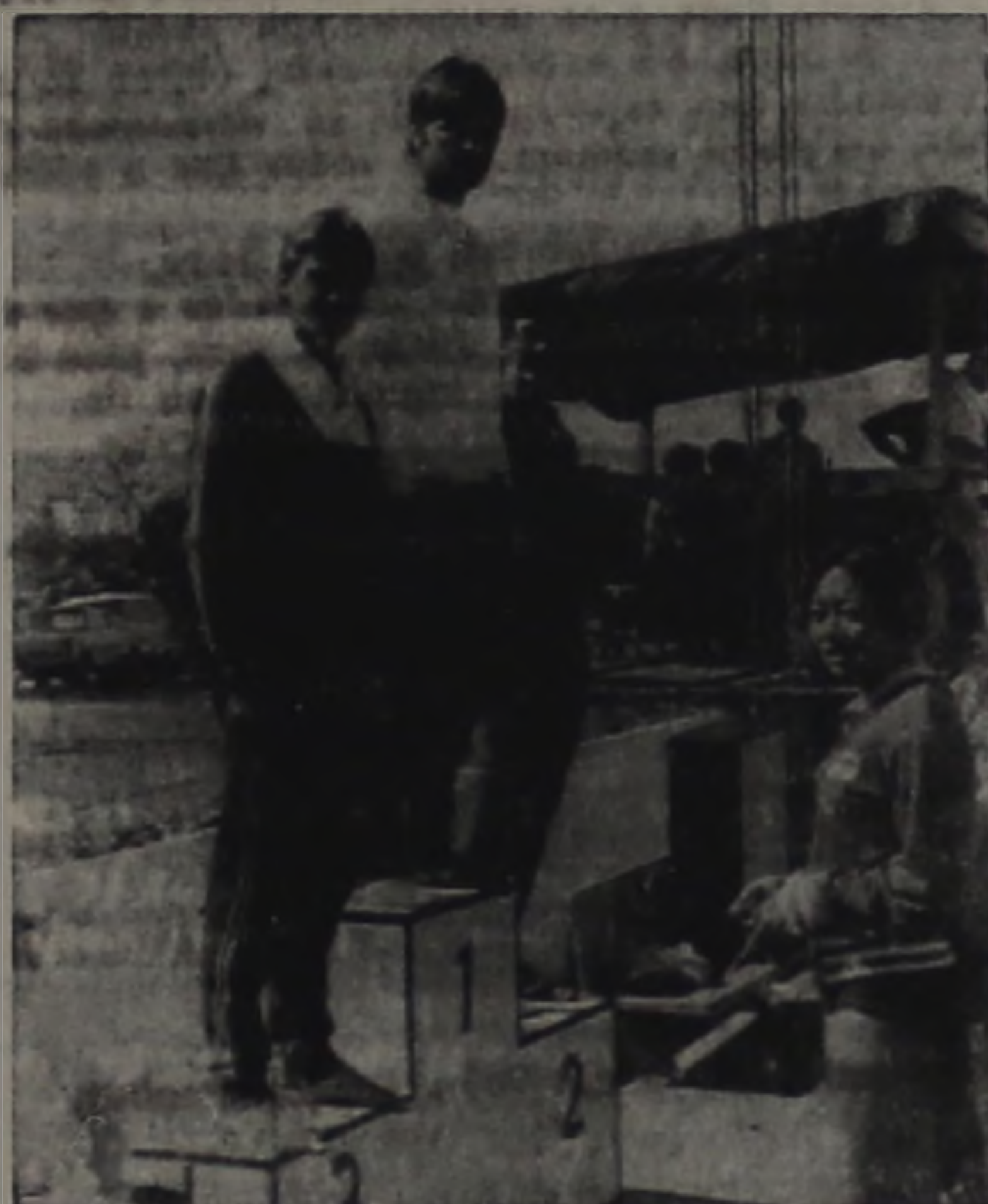
Lençóis: 1º lugar. Era rotina que hoje deixa saudades

Embora a data, este ano não tenha sido comemorada sob nenhum aspecto, o fato é que jamais O ECO poderia deixar passar em brancas nuvens o aniversario do ex- Colegio para cuja fundação tanto lutamos no fim da década de 1940.