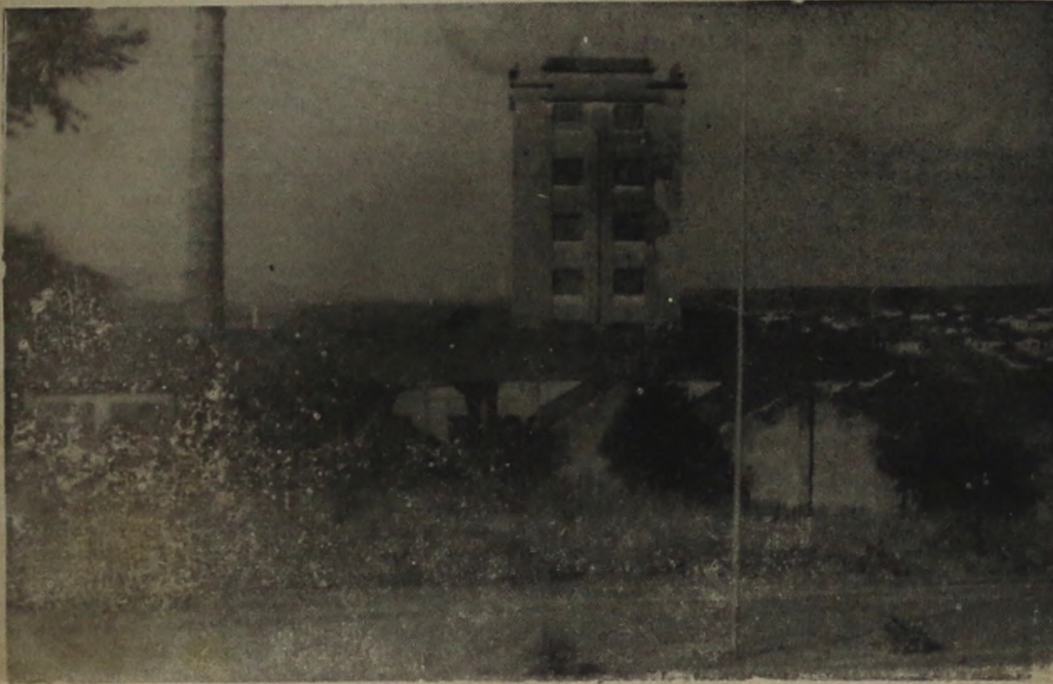
foto: estado em que se encontra a destilaria do IAA