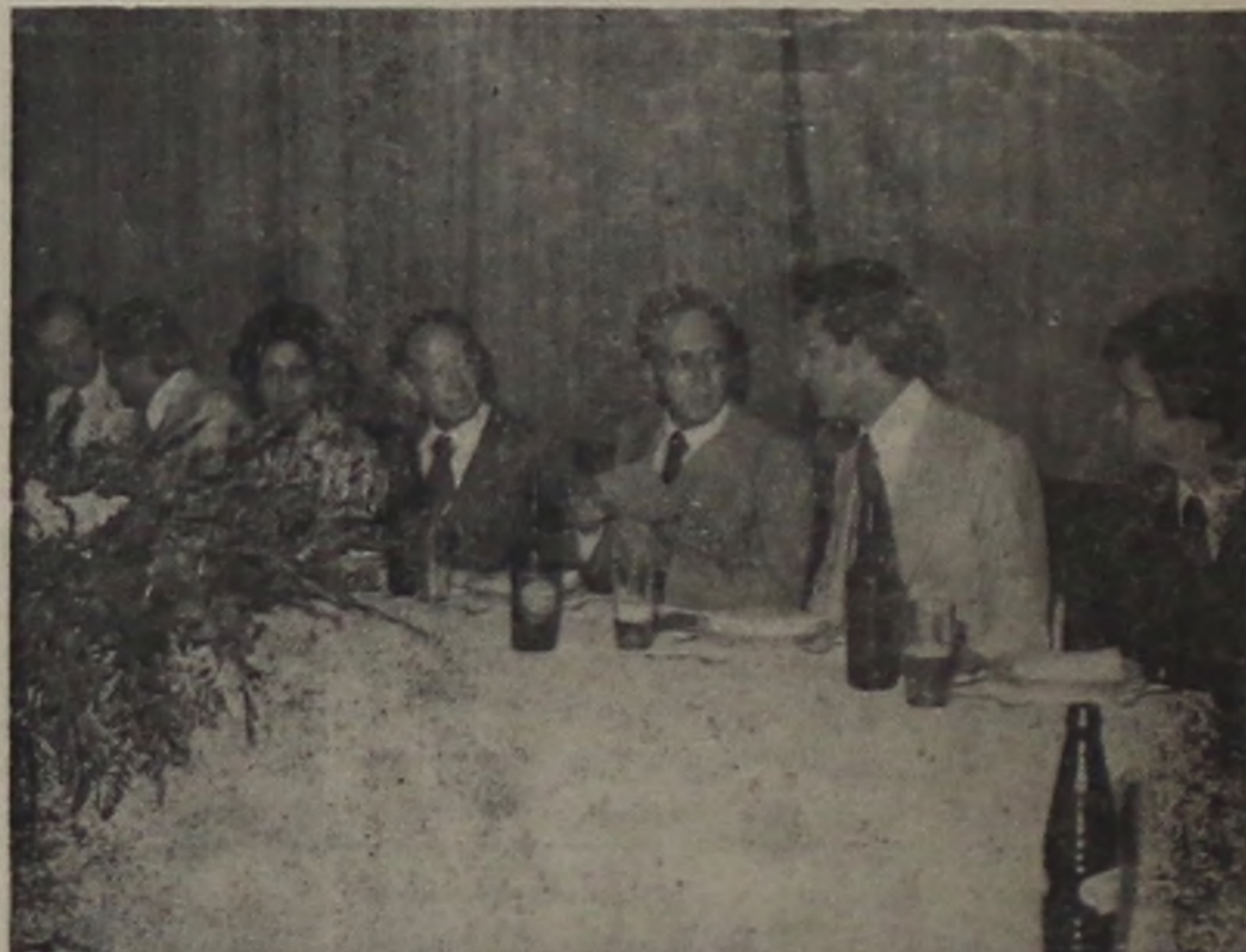
Na foto: mesa de honra do jantar

Aproveite a 1.ª Grande Liquidação do ano em Móveis Guido