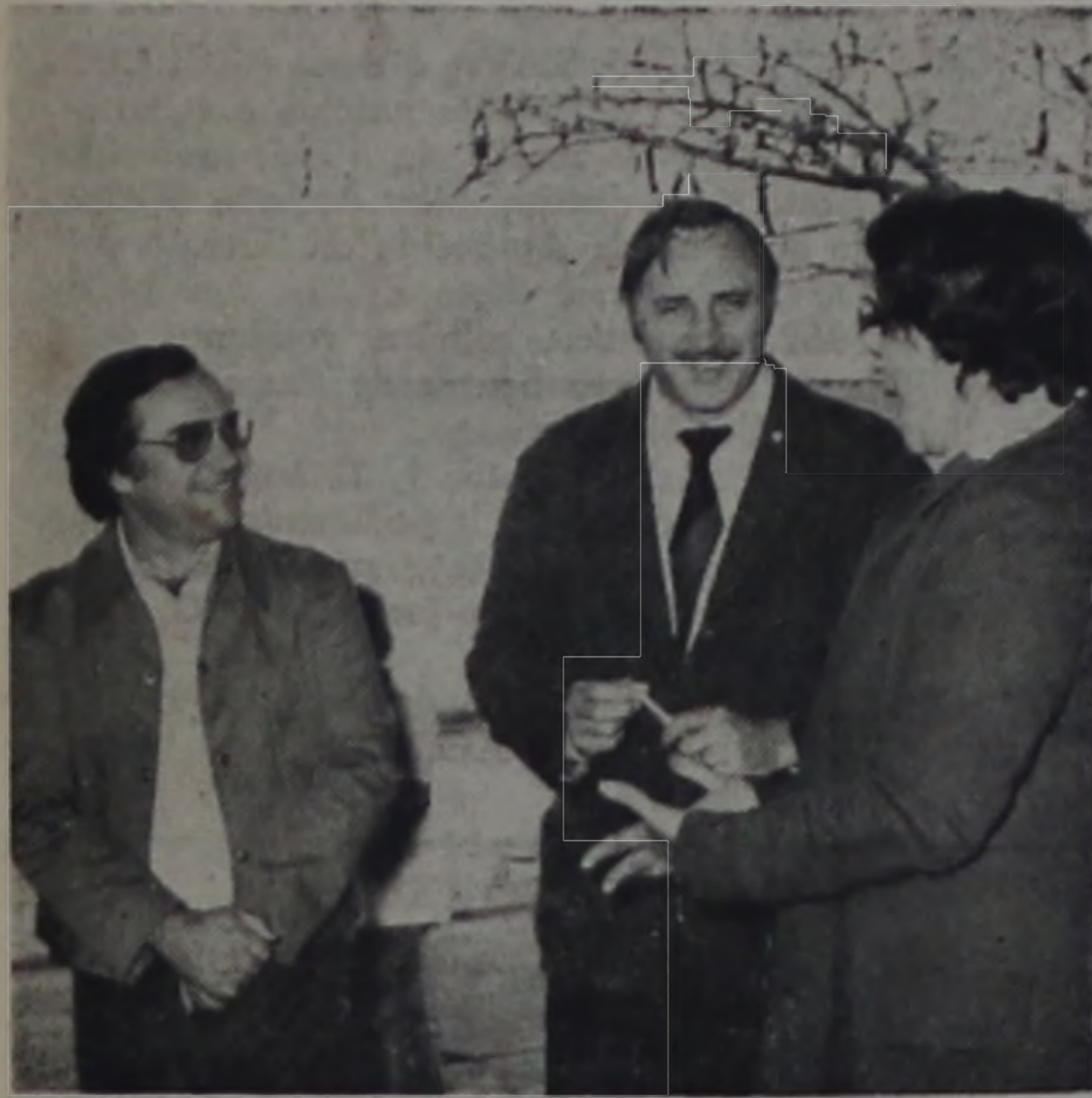
"Ninguém aprende nada de barriga vazia"