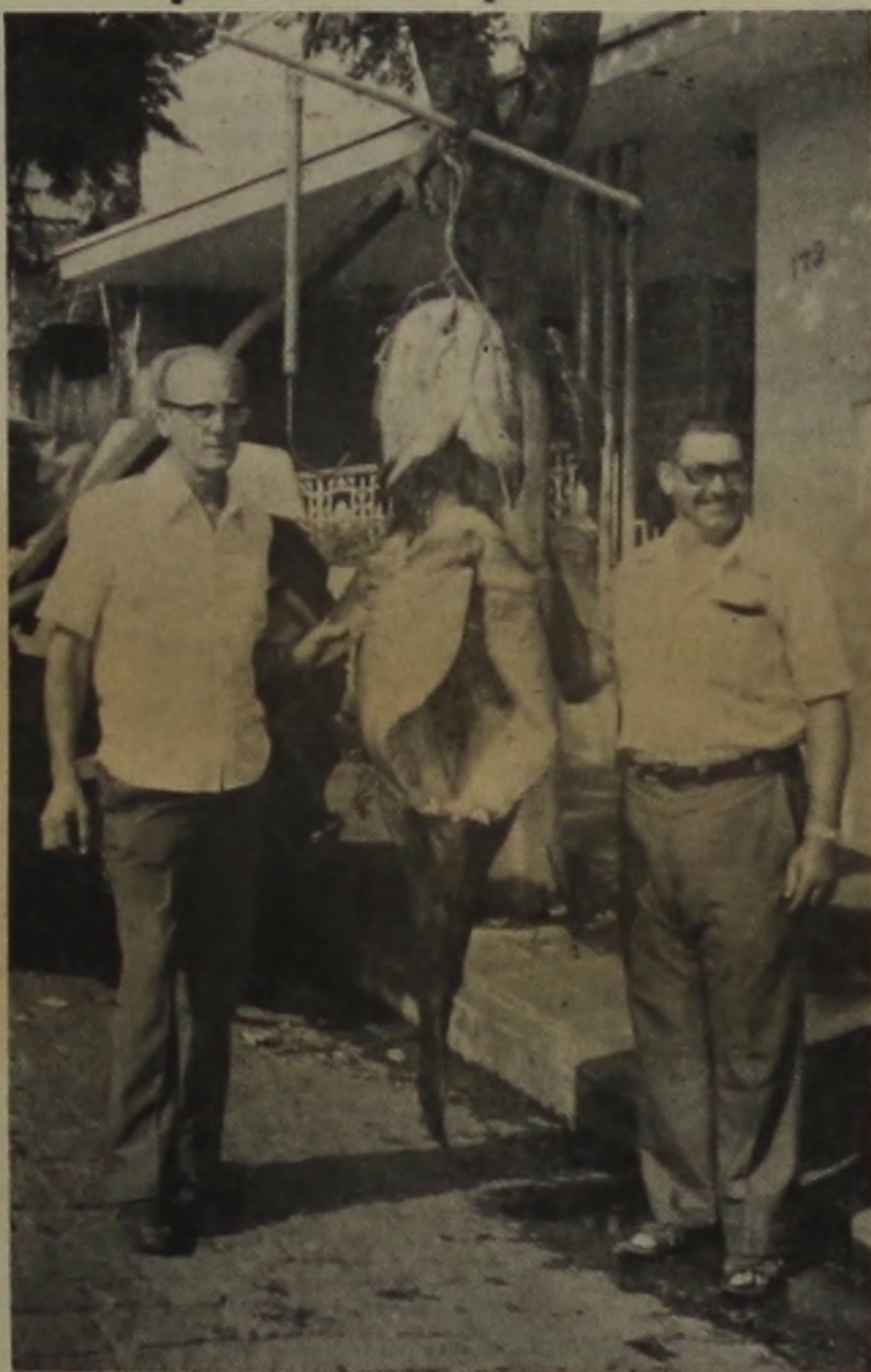
(LEIA NA PAGINA 7)

A reunião de cafeicultores e torrefadores em São Manoel foi na opinião geral um espetáculo previamente montado. Leia em