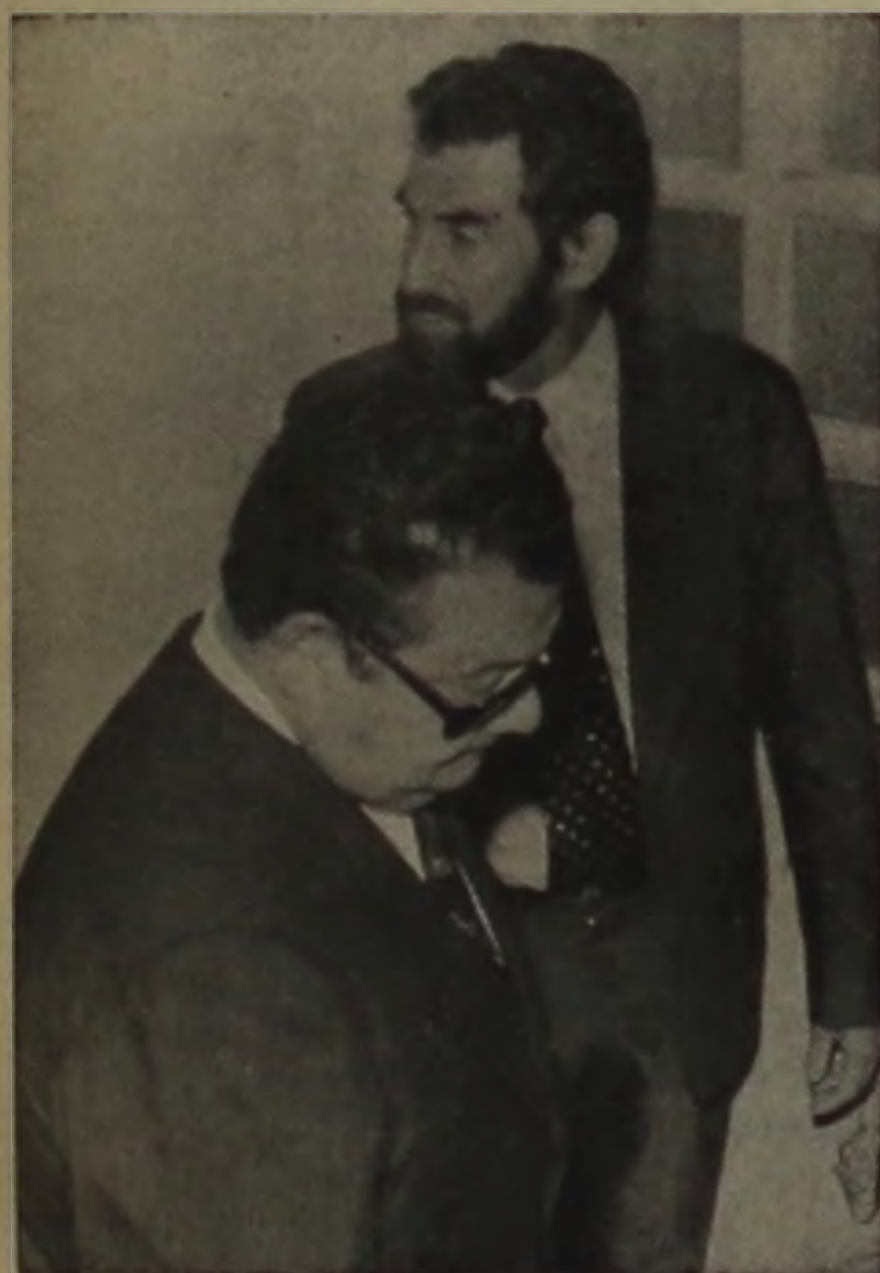
(LEIA NA PAGINA 3)