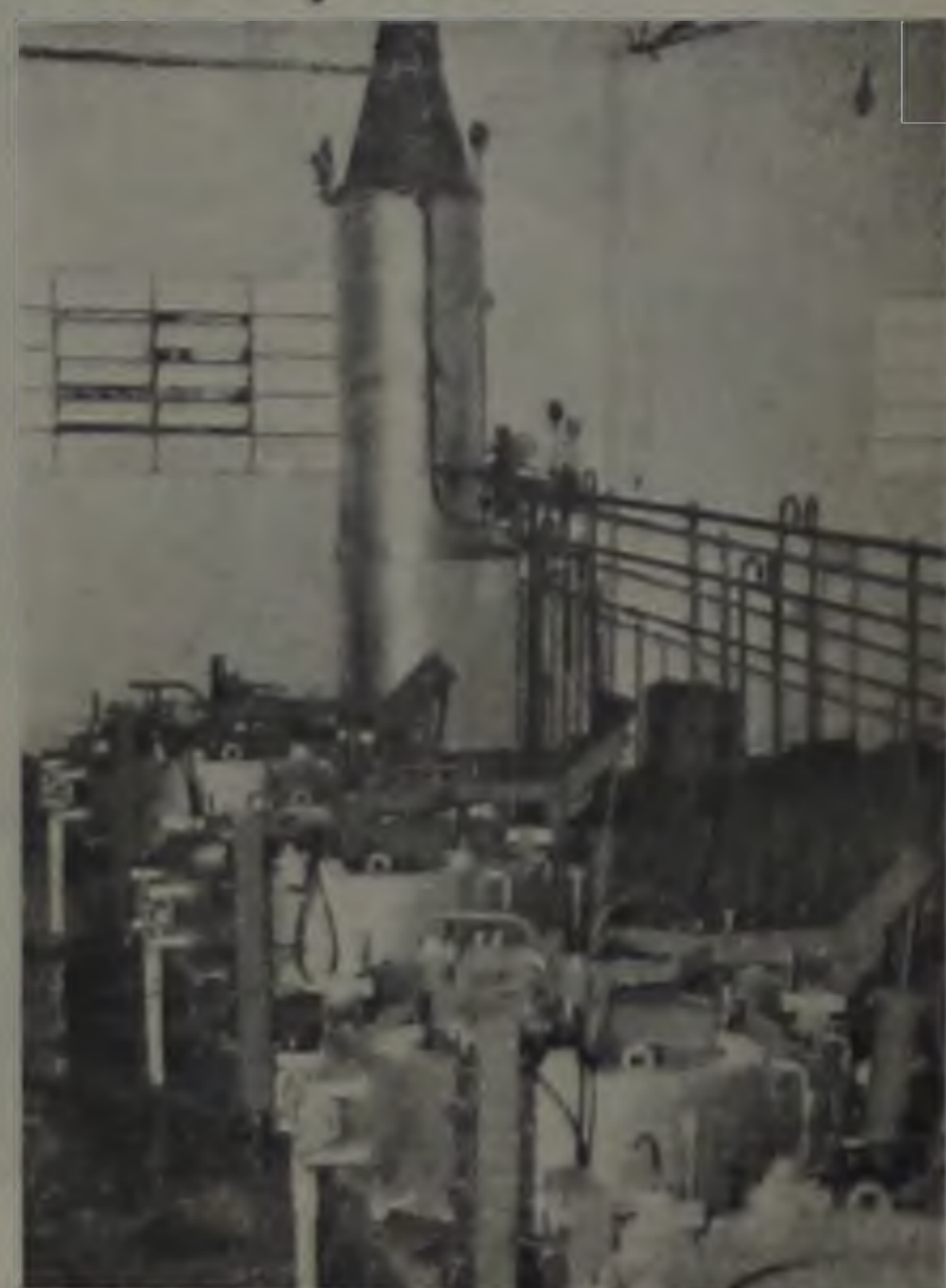
Nesta foto as caldeiras — linhas de vapor e ar que operam a uma temperatura de 80 graus centígrados, onde se funde a borraça ao pneu e determinam os desenhos. O tempo de permanência nesta fase é de aproximadamente 2 horas e 15 minutos, e está terminado o processo, com o pneu novo, de novo.

Num futuro muito próximo estará operando com venda de pneus novos, balanceamento de pneus e alinhamento de direção.