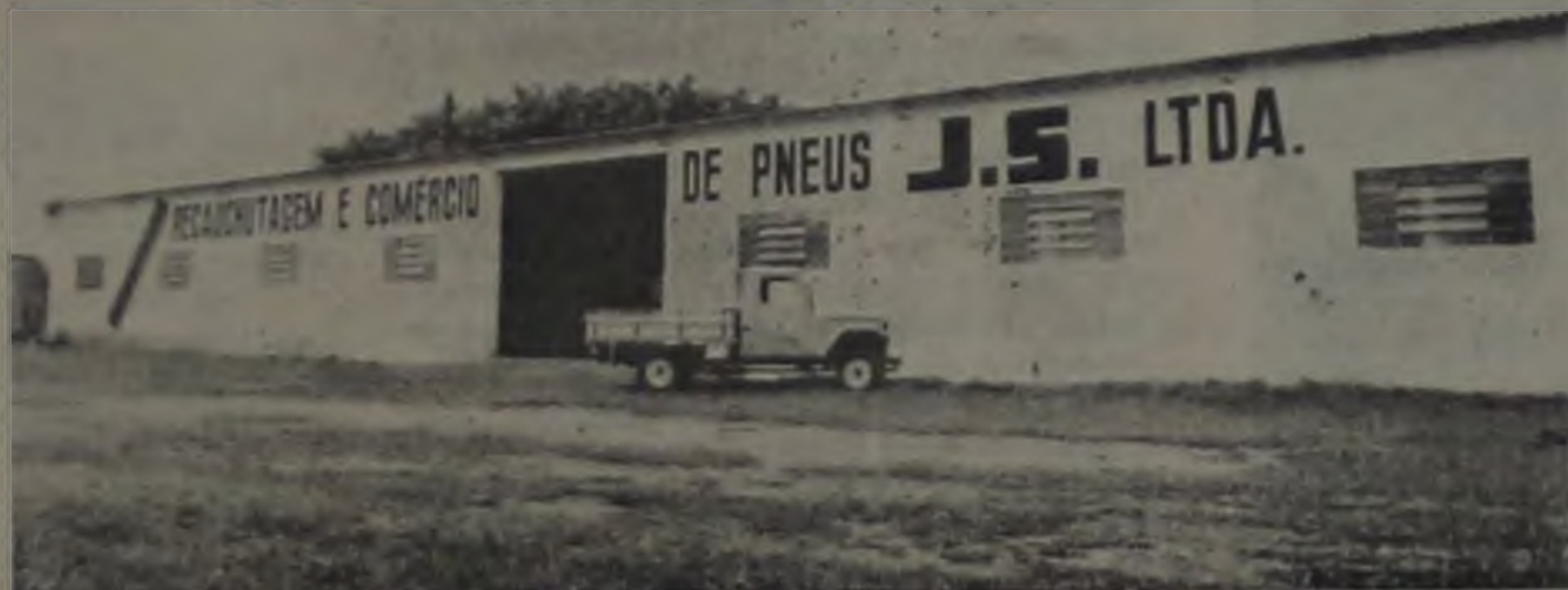
Na foto acima, a fachada da mais jovem empresa lençoense e seu amplo pátio de estacionamento.

Os pneus passam por rigoroso exame através da máquina aranha que vai determinar todas as suas condições para recauchutagem