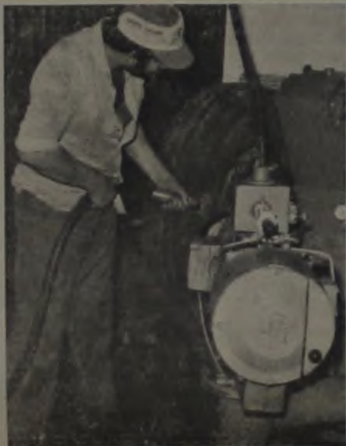
Na foto, a máquina de raspa, para retirada automática de todo resíduo de borracha antiga, preparando a carcaça para receber a nova camada de revestimento.

Os pneus passam por rigoroso exame através da máquina aranha que vai determinar todas as suas condições para recauchutagem