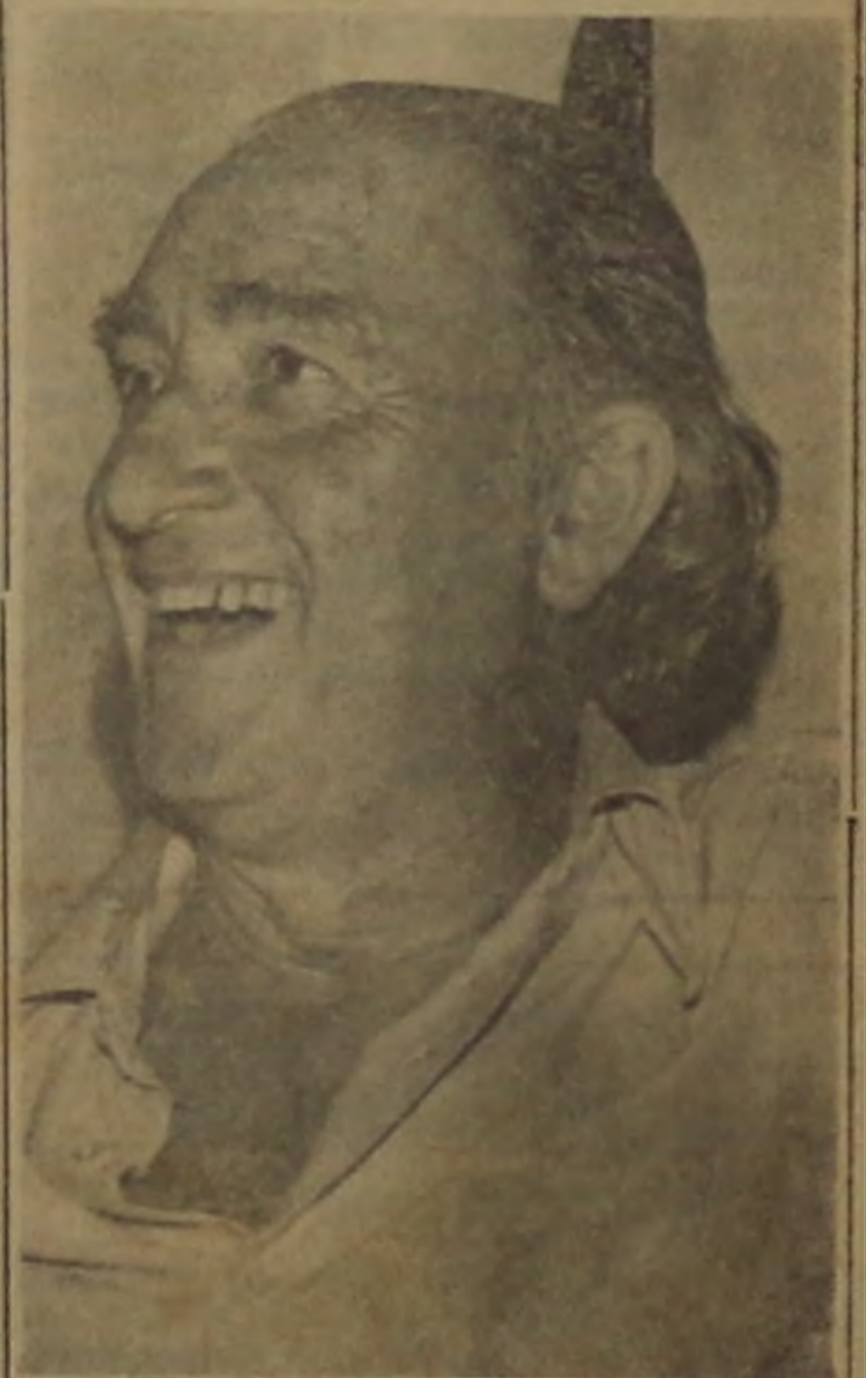
LEIA ENTREVISTA NA PAGINA 3