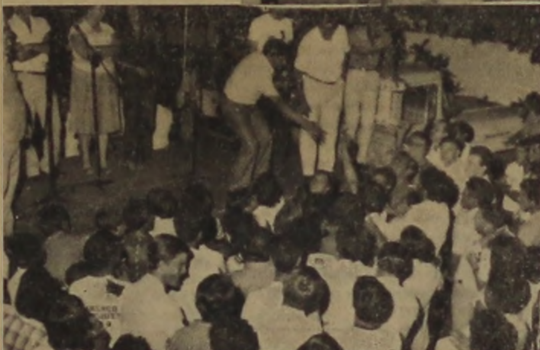
Na foto ao lado o eleitor, entusiasmado, entregou ao prefeito eleito um chaveiro feito por ele próprio com o "V" da Vitória.