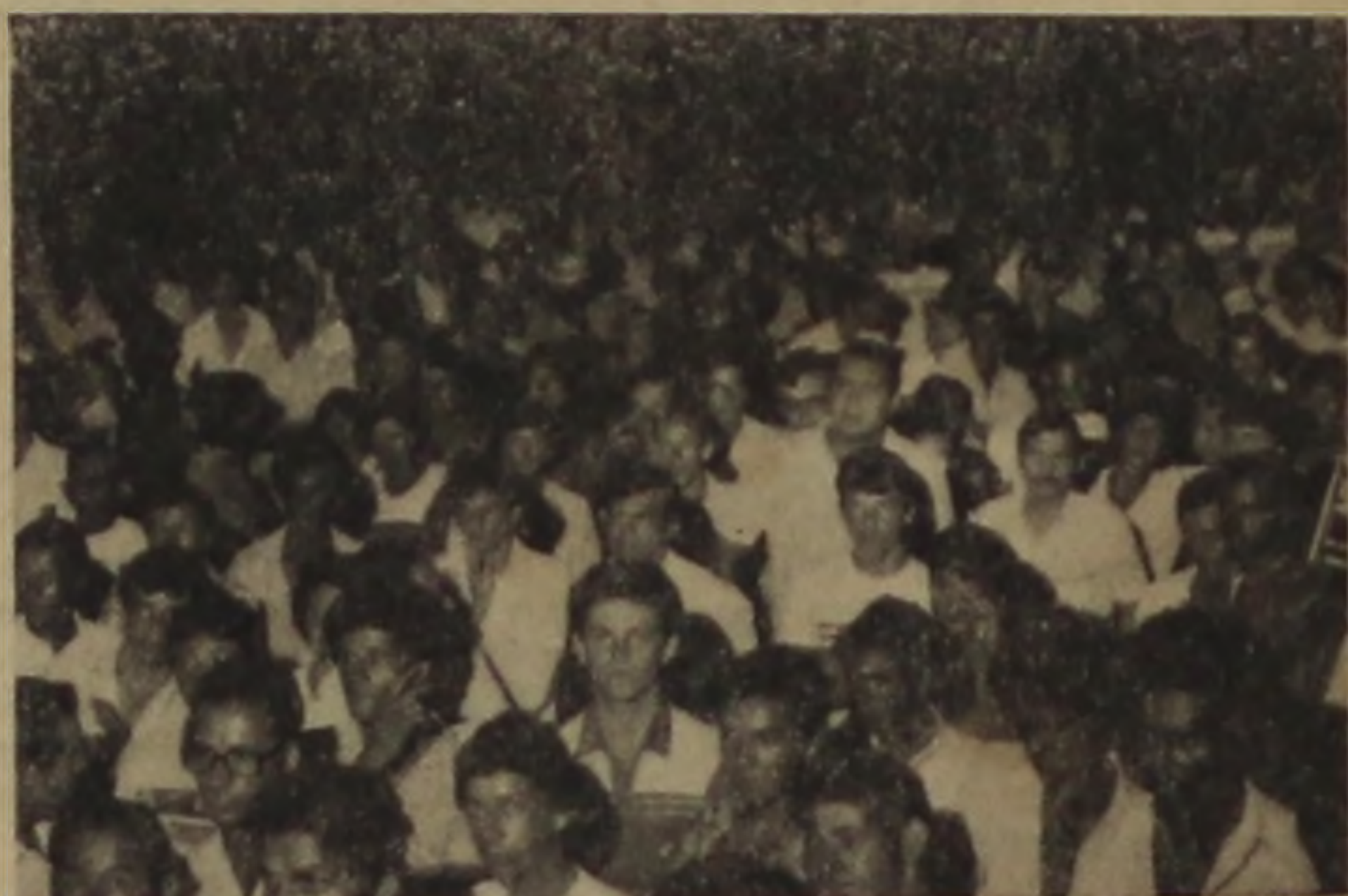
A distância entre o Corvo Branco e o centro da cidade não foi obstáculo para o comparecimento da grande massa humana