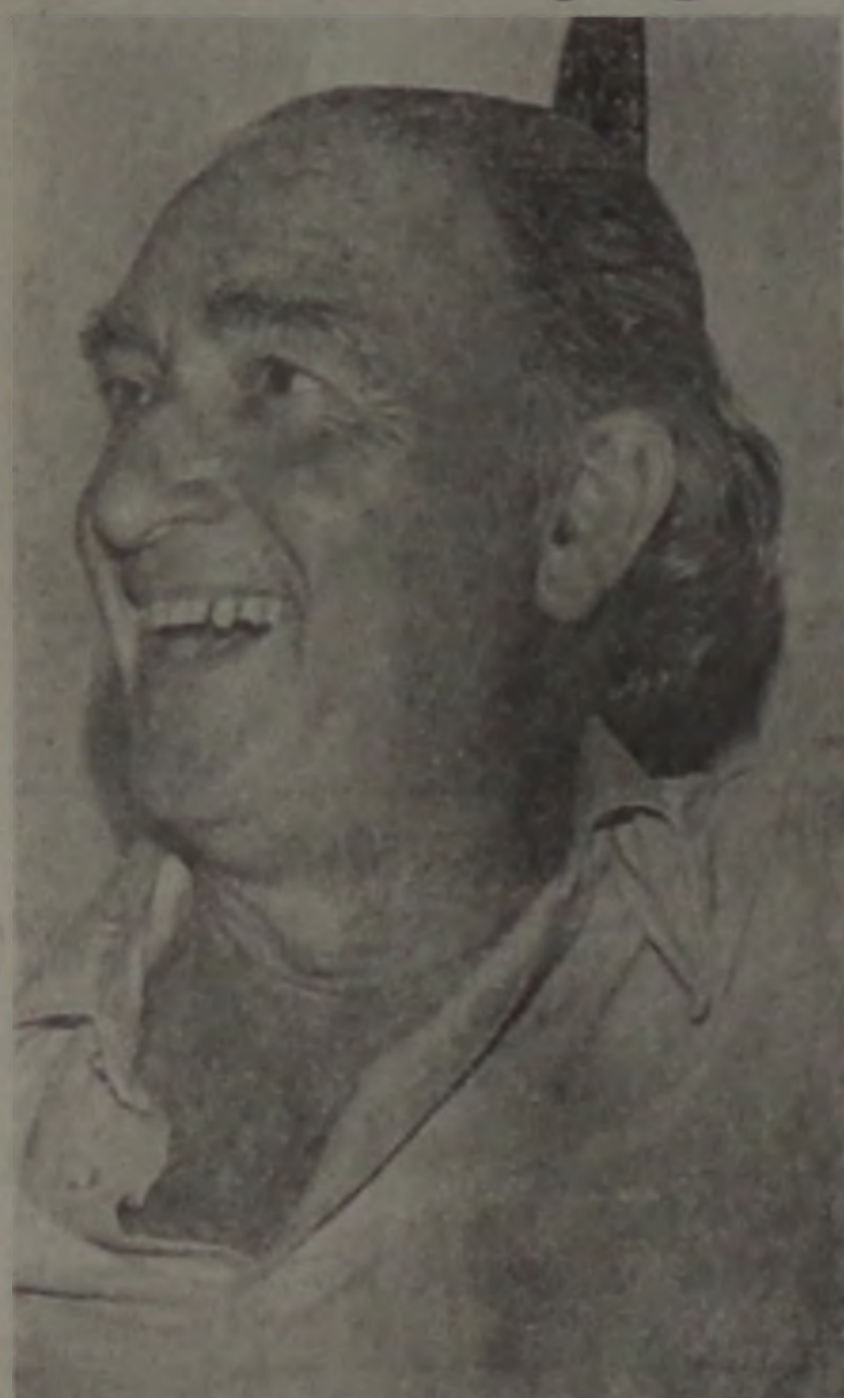
Franco Montoro

Frisando que é grave a situação econômica do Estado, o Governador Franco Montoro enviou anteontem sua mensagem anual à assembleia Legislativa, contendo um balanço das realizações do governo anterior. Segundo ele, são limitadas as possibilidades de se alterar o atual orçamento e que os projetos aprovados pelo Legislativo neste início de ano, provocaram um aumento não previsto de despesas. Montoro reafirmou ainda as metas principais de sua administração, como fortalecimento da agricultura, direcionamento das instituições financeiras oficiais para o setor de produção e a interiorização do desenvolvimento.