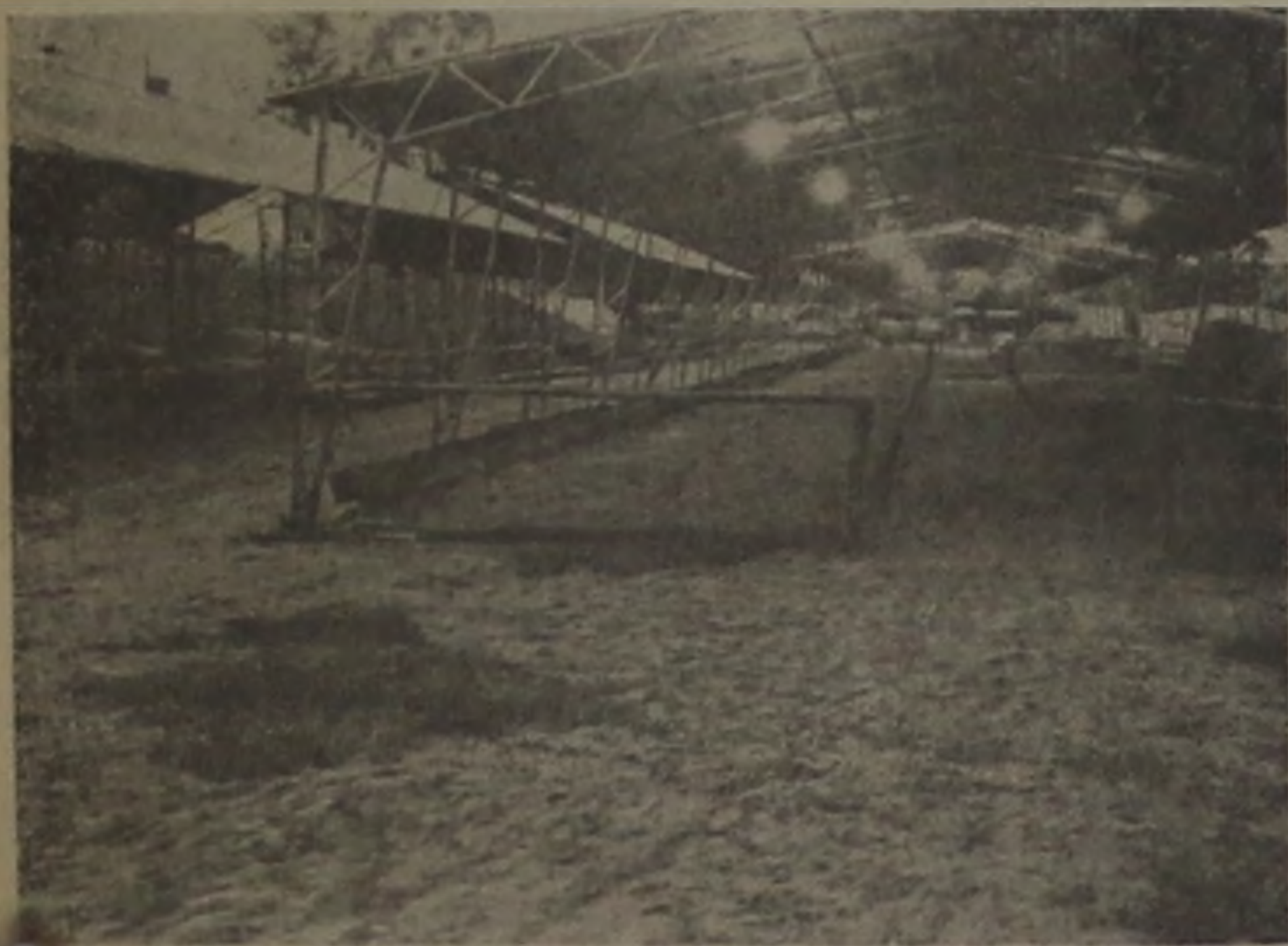
Com amplos pavilhões, a Facilpa estará expondo à partir de hoje animais e outros importantes produtos da região.

— Trata-se do maior evento do gênero que a região já conheceu — A economia e o lazer caminharão juntos toda a semana —