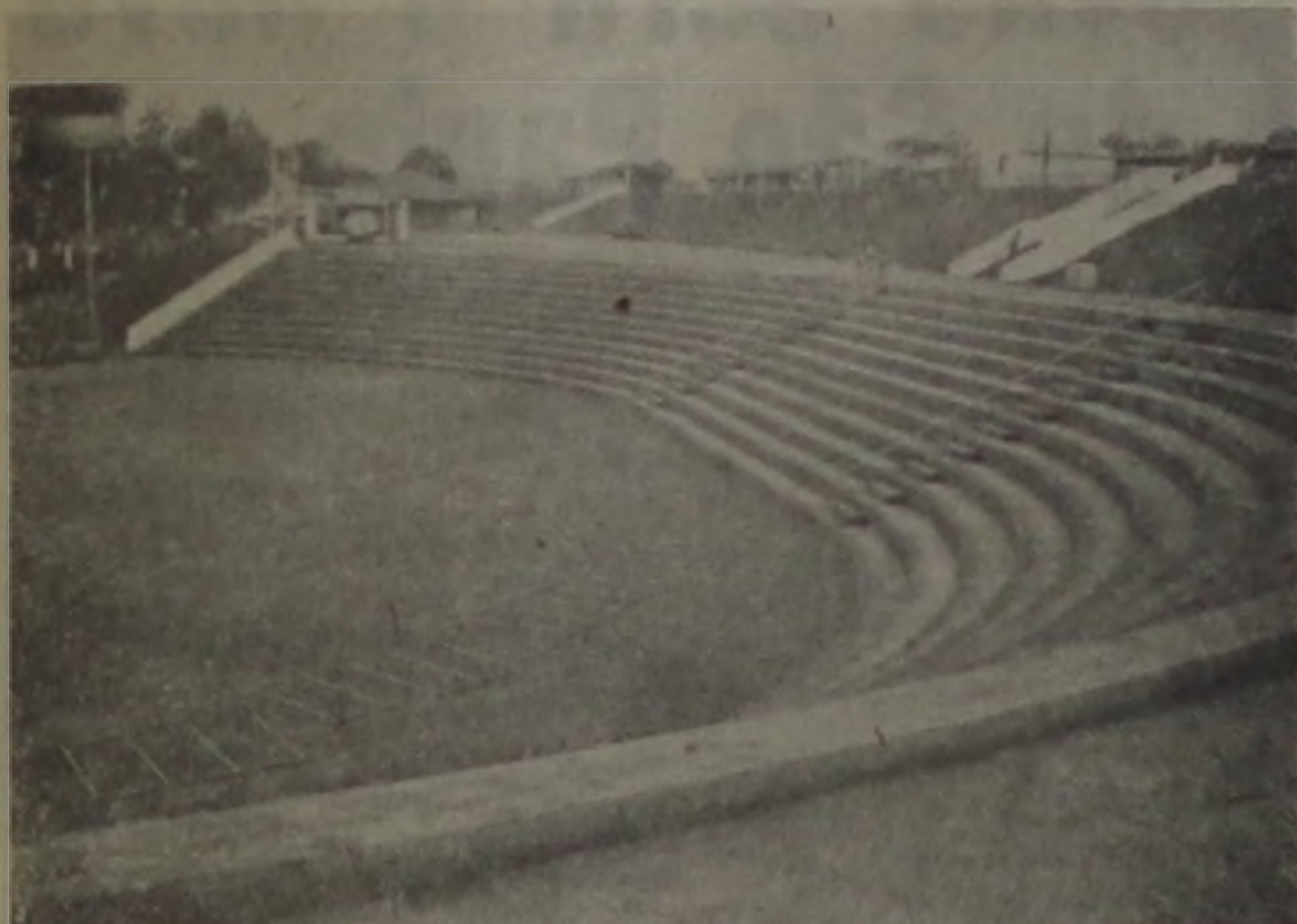
A Arquibancada com capacidade para 2500 pessoas.

Lençóis está vivendo hoje um dia incomum. Estamos inaugurando a VI Feira Agro Comercial e Industrial — FACILPA, no recinto do Lago da Prata que oferecerá durante toda a semana uma ampla visão do que é a economia do município e, além disso proporcionará à população local e da região dias e noites de lazer através de shows artísticos e do parque de diversões instalado ao lado da feira propriamente dita.