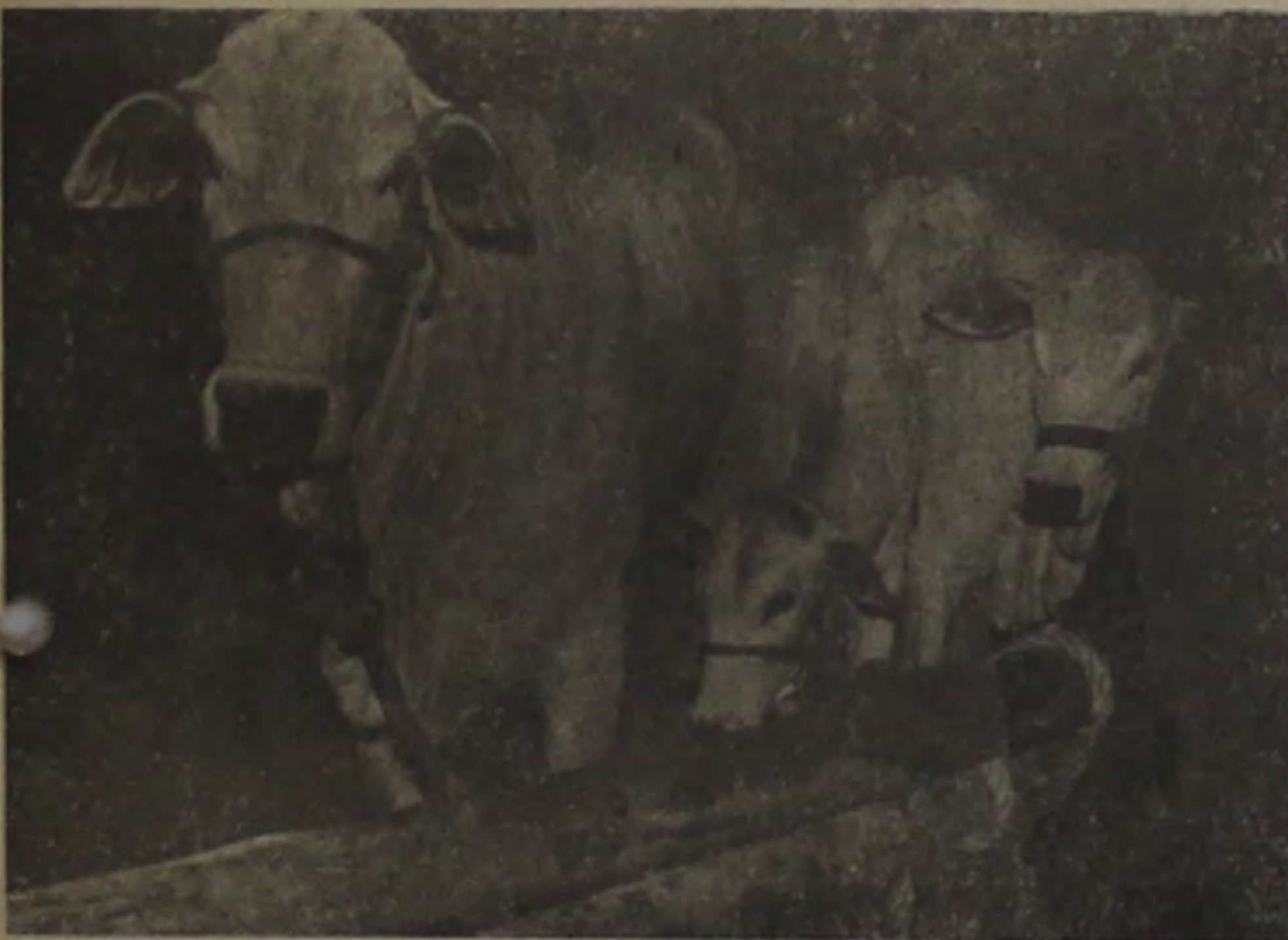
Anteontem à noite já começaram a chegar os animais que estarão em exposição e negociação no decorrer da semana