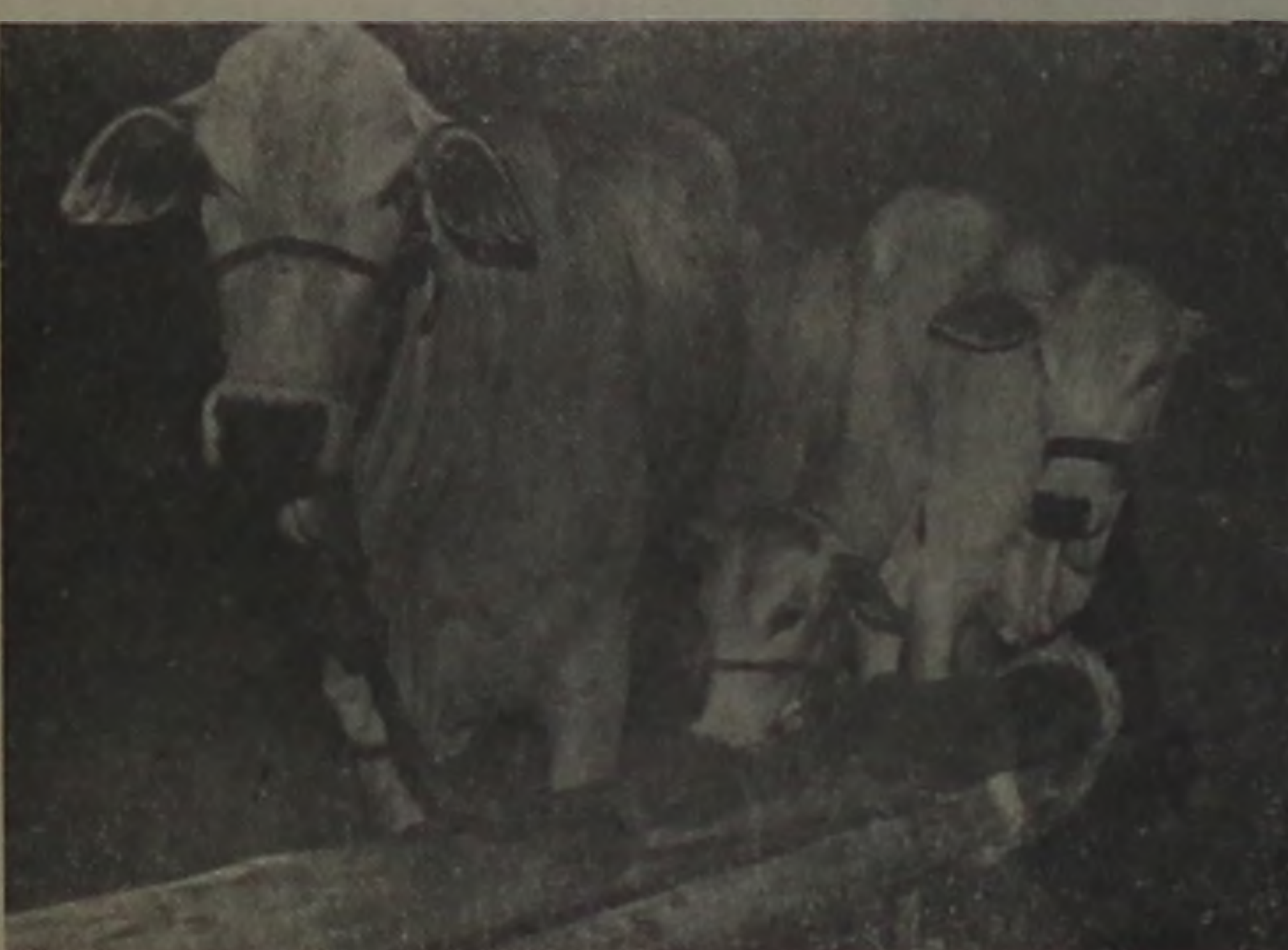
Os animais que estarão em exposição.