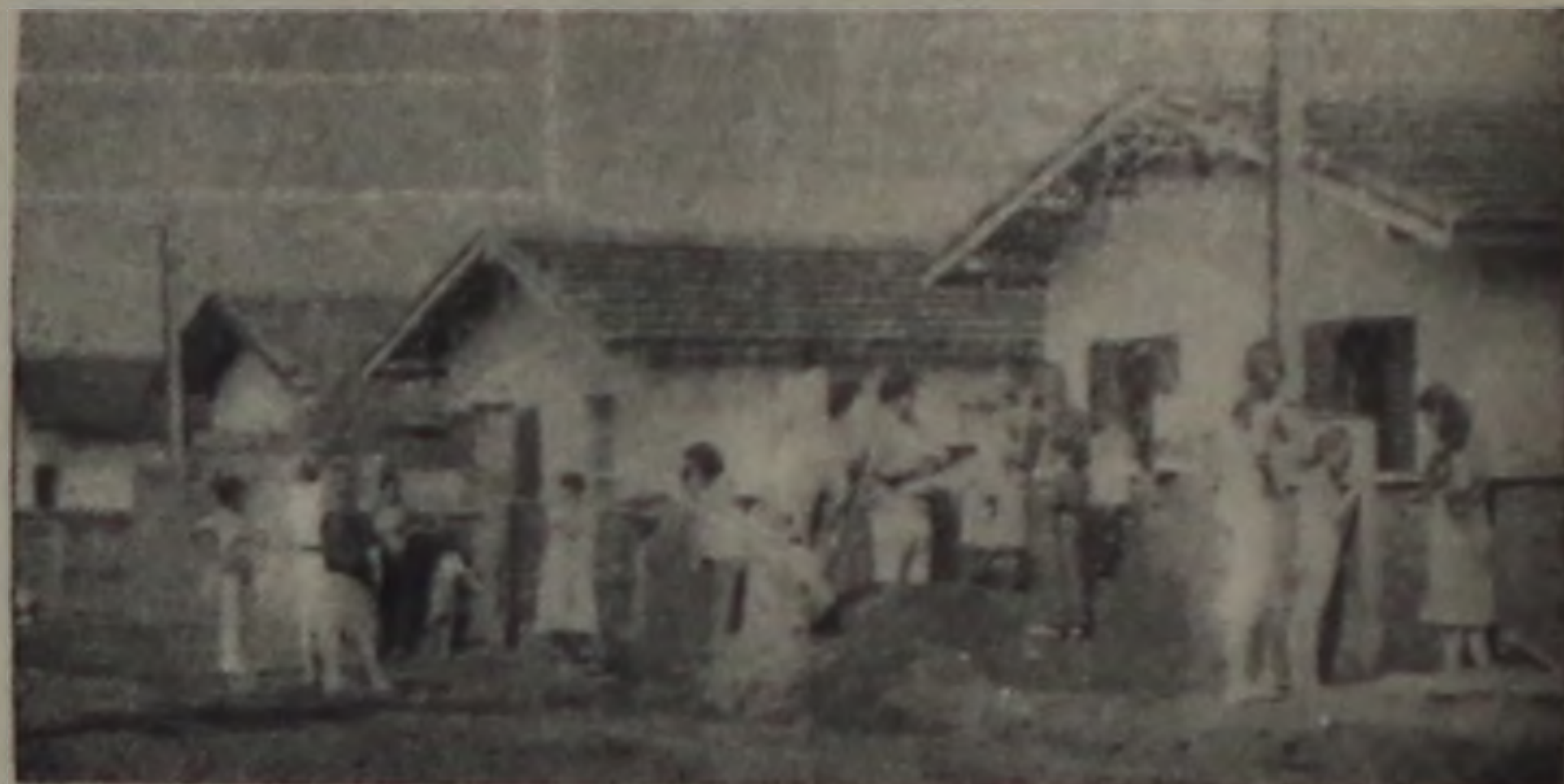
— Para amenizar a alta das prestações, o mutuário poderá optar pelo sistema de reajustes semestrais

O reajuste das prestações da casa própria, a partir de julho, deverá ser de 130%, que é o cálculo estimado do BNH para a correção monetária acumulada entre julho do ano passado e junho próximo. Após confirmarem essa projeção, o ministro do Interior Mário Andreazza e o presidente do BNH, José Lopes de Oliveira, anunciaram que os mutuários poderão pagar uma parcela do reajuste, em julho, no valor de 98 por cento, ao mesmo tempo que escolherão uma data entre os meses de agosto de 1983 e janeiro de 84 para pagar a diferença entre aquele índice e os valores estimados pelo BNH para a correção monetária, obedecendo a uma tabela elaborada pelo banco.