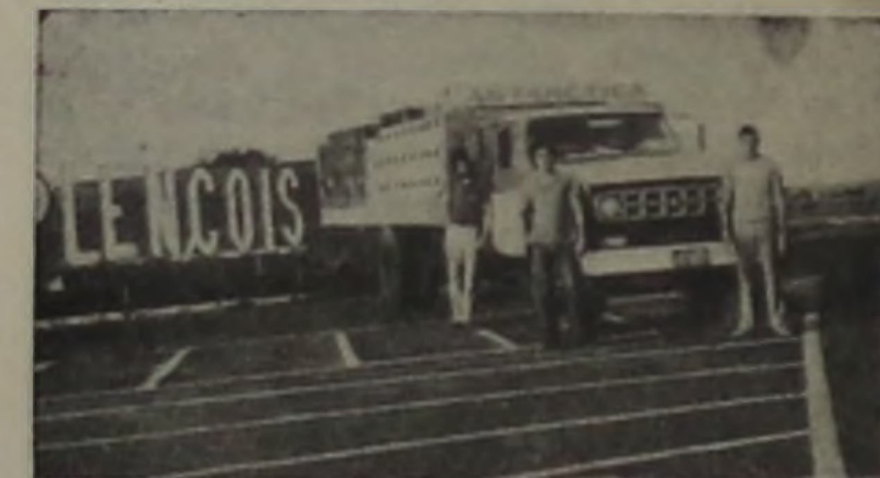
O SEU DISTRIBUIDOR ANTARTICA PARA LENÇÓIS E REGIÃO