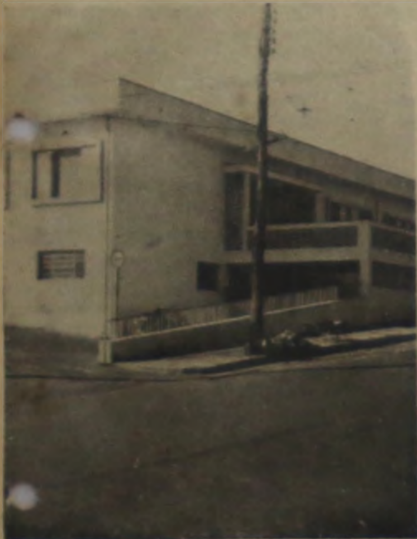
Fachada do Hospital Nossa Senhora da Piedade