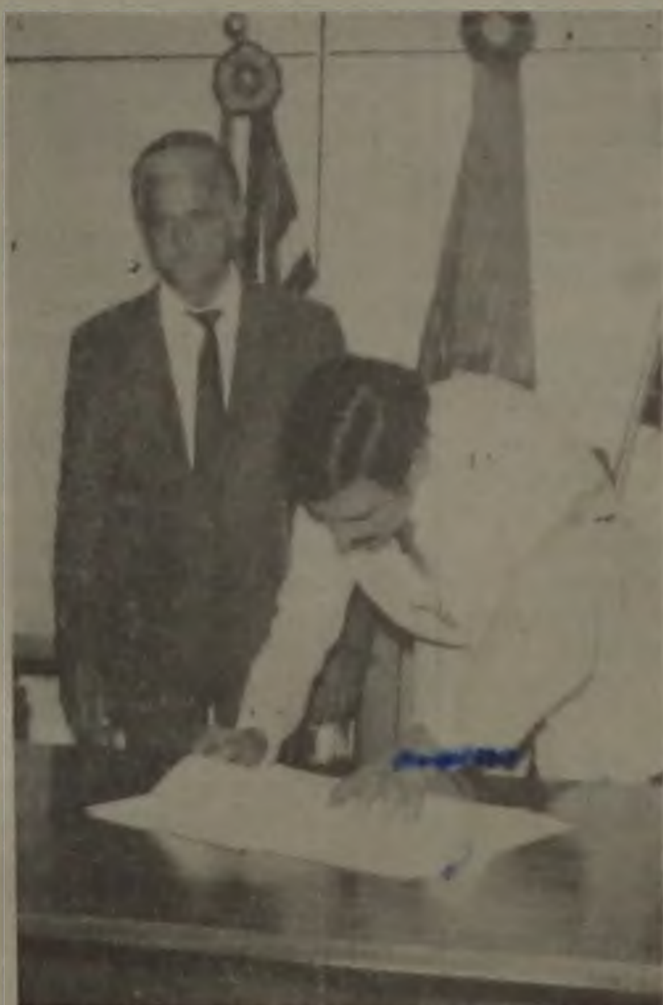
A POSSE DE IDEVAL

Uma festa realizada no Hospital Maternidade de Vila Velha em Vitória, no Espírito Santo, está dando a mais completa confusão. Consta que enquanto os nove médicos presentes brindavam o final do ano, pacientes tinham a necessidade de atendimento. O governador Gerson Camata, do PMDB, de mitiu todos, e agora o CRM os está processando.