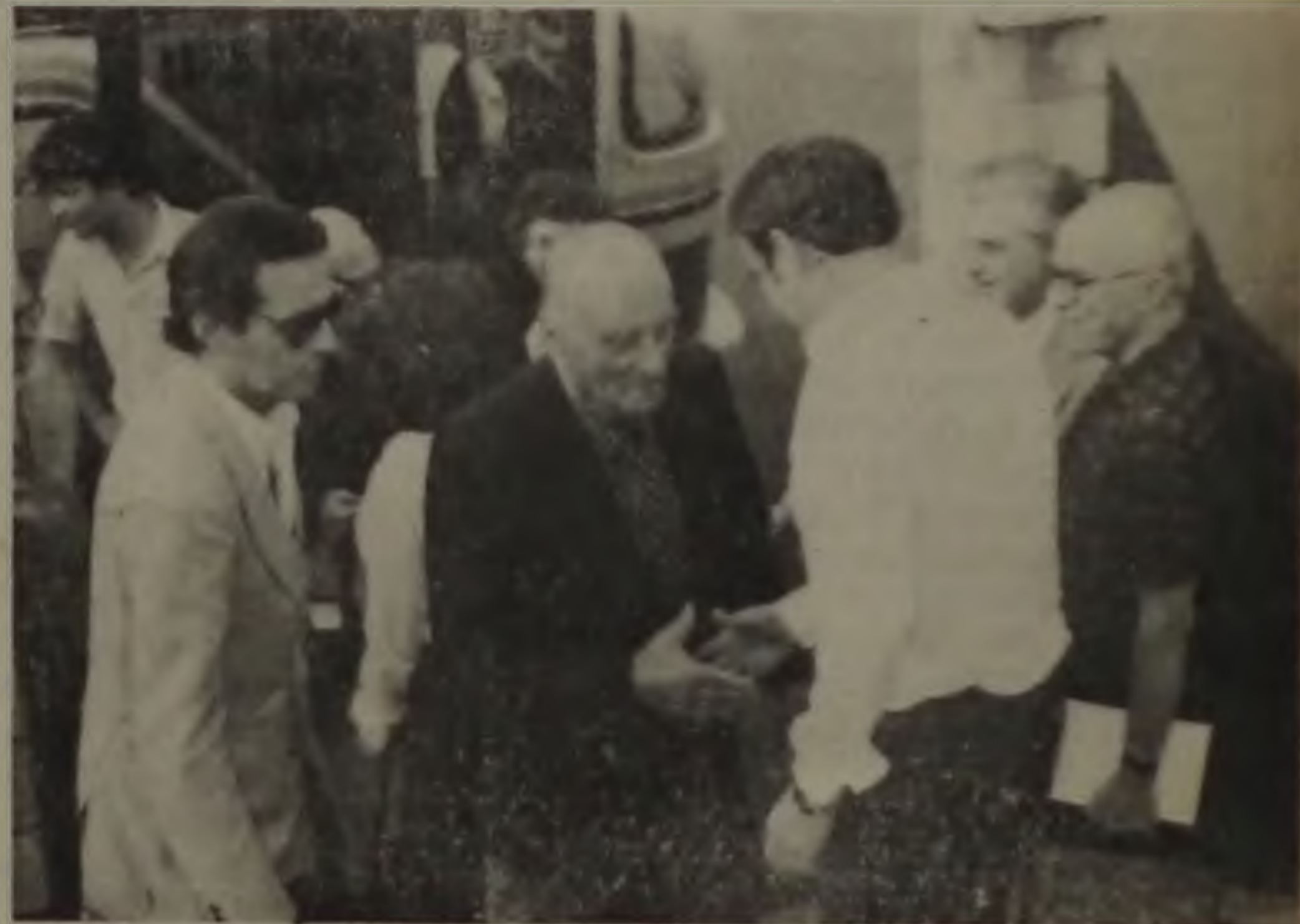
A CHEGADA DOS ESCRITORES

Figueiredo voltou a insistir na legitimidade do colégio eleitoral, classificando como "perturbador" o caráter da campanha pelas eleições diretas. Mas, mesmo assim, as lideranças oposicionistas estão em plena campanha e lembram que a última, as eleições diretas para governador e outros avanços alcançados não foram concessões do governo, mas sim o resultado da luta permanente da sociedade.