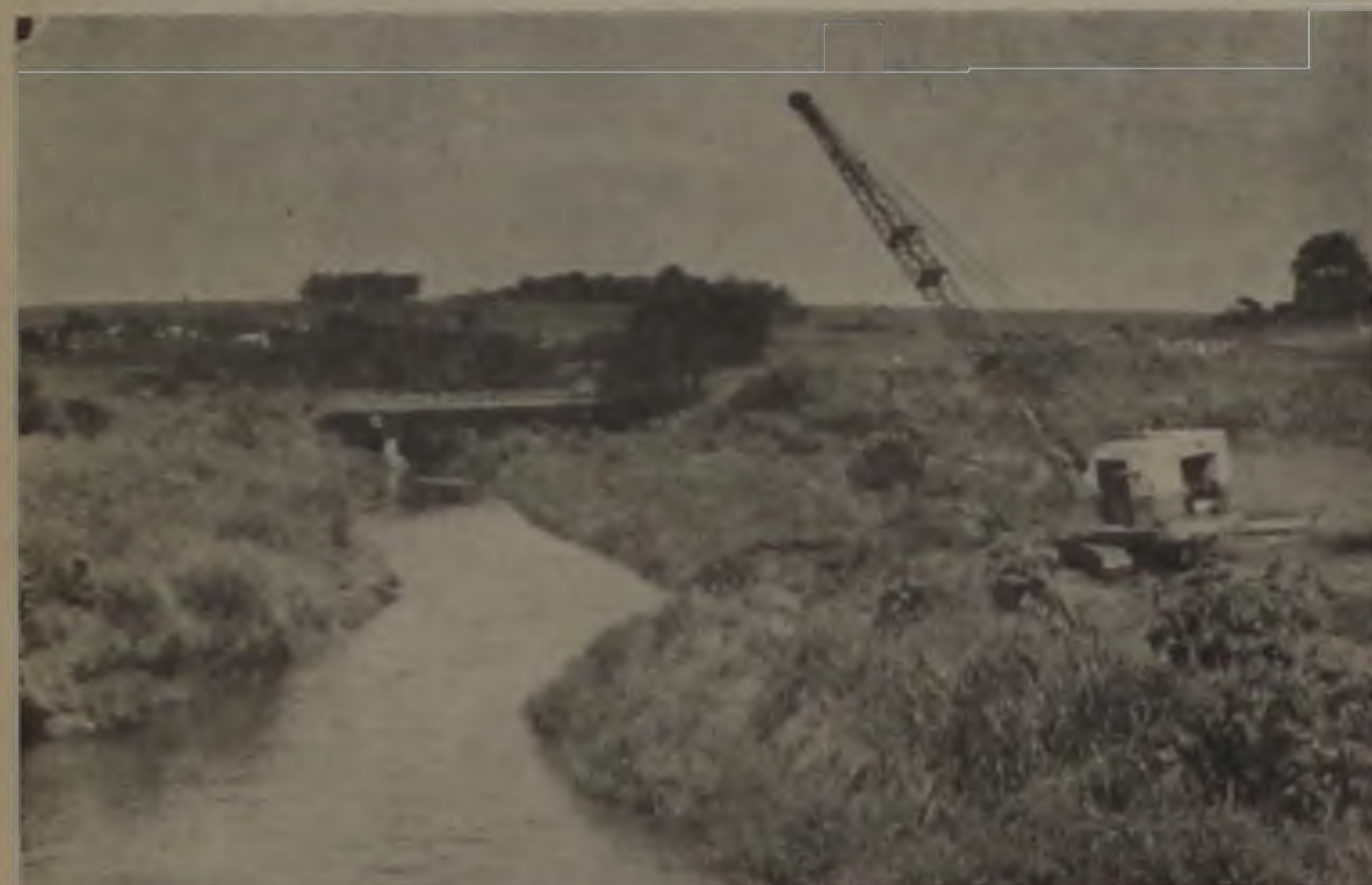
Assim que o serviço estiver pronto acabarão as enchentes que tantos prejuízos vem causando

Chegou na última terça-feira e já se encontra em operação junto ao leito do Rio Lençóis a draga do DAEE que durante 80 dias deverá realizar o trabalho de retirada da areia que obstrui o fundo do rio e pro-