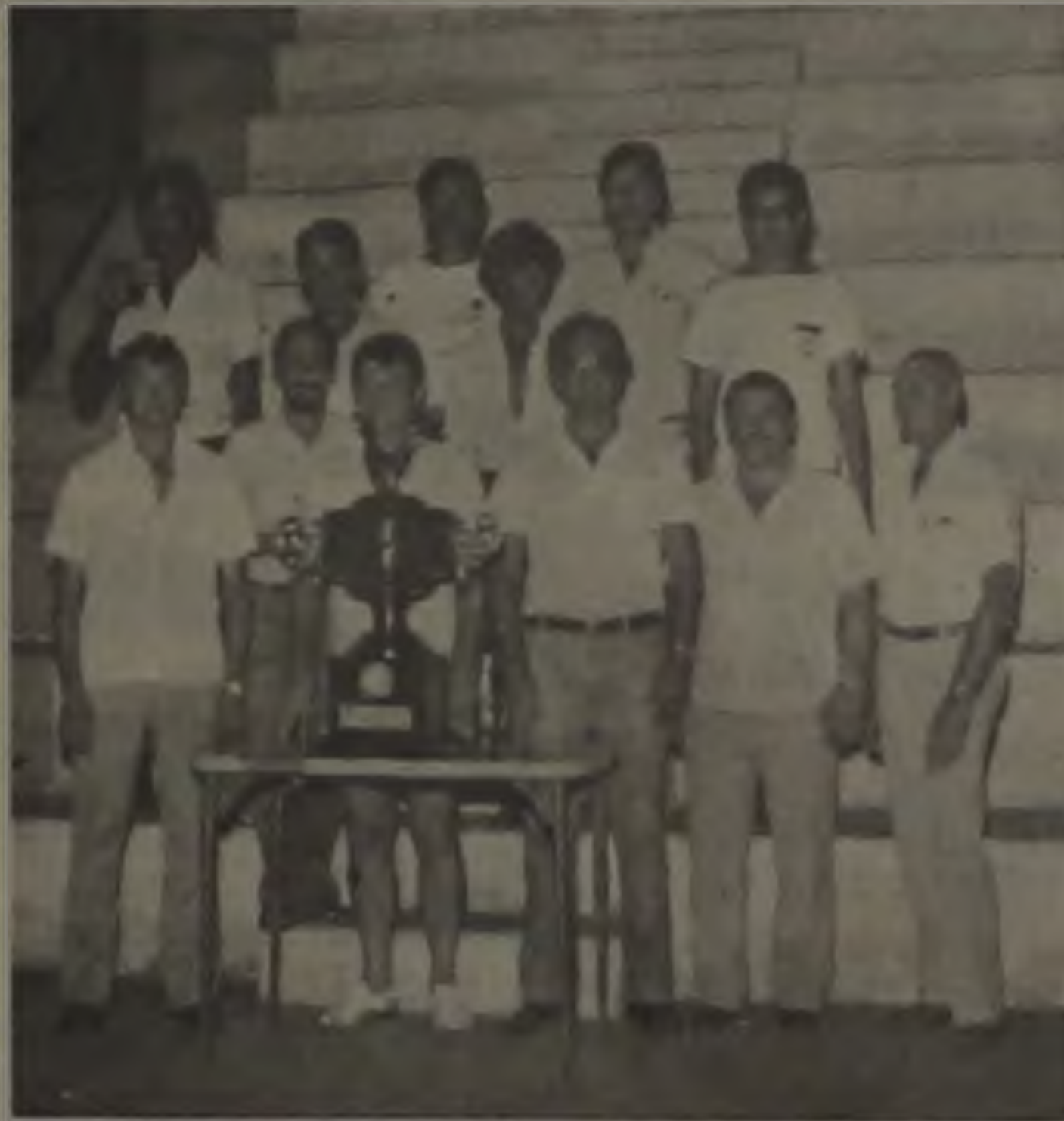
Diretores do CAL, que no flagrante aparecem ladeando o troféu conquistado na 3.ª Divisão no ano passado, agora estão preocupados com o acerto do time que estreia dia 11 de março na "segundona".

As novas contratações e o início das reformas no estádio "Archangelo Brega" foram os principais assuntos da reunião da diretoria na última segunda-feira.