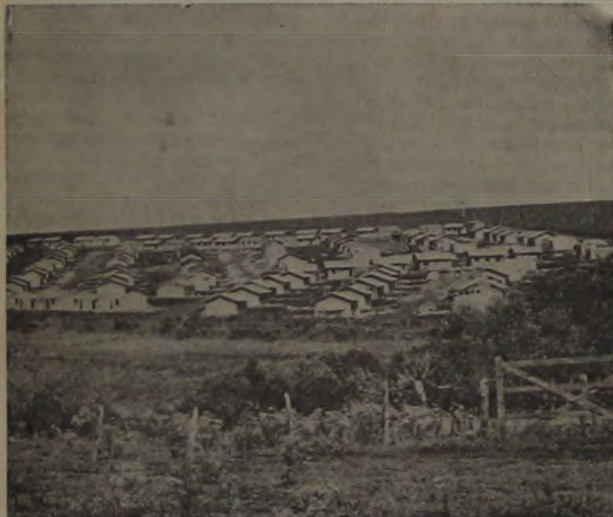
As novas casas ficarão ao lado do Núcleo da CECAP