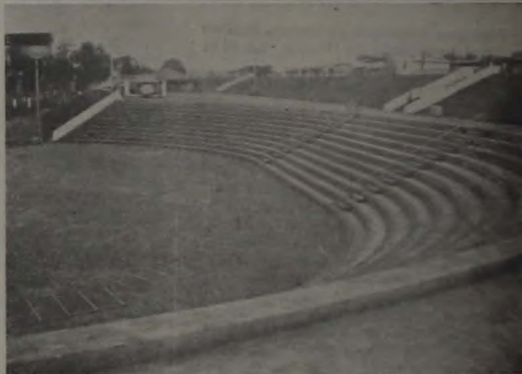
As novas arquibancadas

Enfim, esperamos para a VII FACILPA um sucesso muito maior que o do ano passado, pois estamos notando um carinho todo especial de todo mundo, uma ansiedade grande, uma vontade de falar em Feira e dela participar, uma vontade de espalhar, de ouvir uma boa moda de viola, de ver o cavalo pular e do peão aguentar, de ver a cidade do alto da roda gigante ou o samba cadenciado do Luiz Airão, quem sabe... Enfim, é a Festa, é o povo, é a Facilpa. Ainda é tempo, vamos participar!”