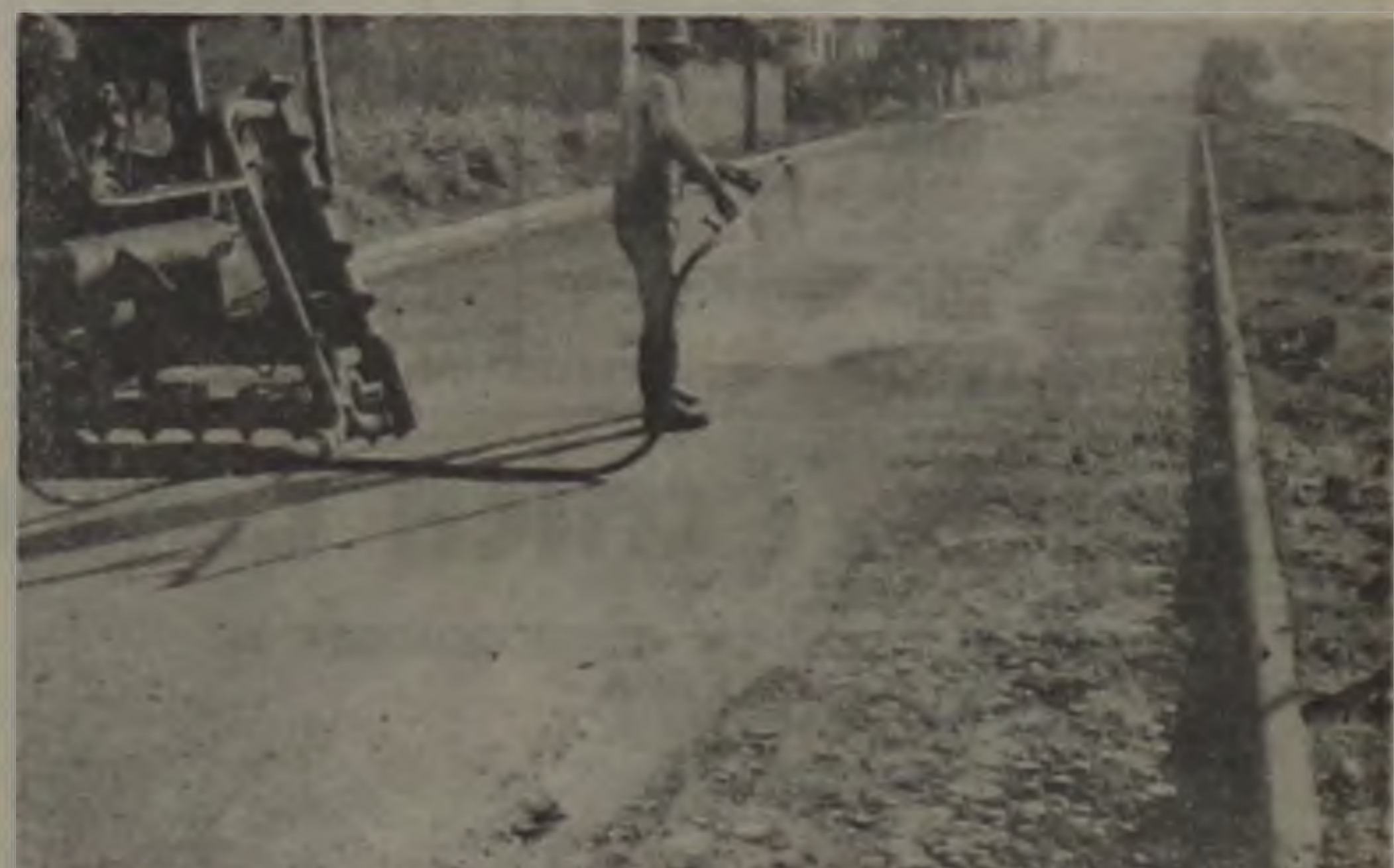
O equipamento adquirido pela Prefeitura no início da atual administração está colocando as ruas da cidade em boas condições.

Lençóis Paulista, que ficará ligada à regional de Bauru na divisão do PIC, ganhará futuramente a posição de secretaria regional, segundo entendimentos mantidos entre os cineclubistas locais e as lideranças da Federação Paulista de Cineclubes. Além do "Glauber Rocha" Lençóis também conta com o cineclubista "João Batista de Andrade", que funciona exclusivamente na EEPG "Virgílio Caponi".