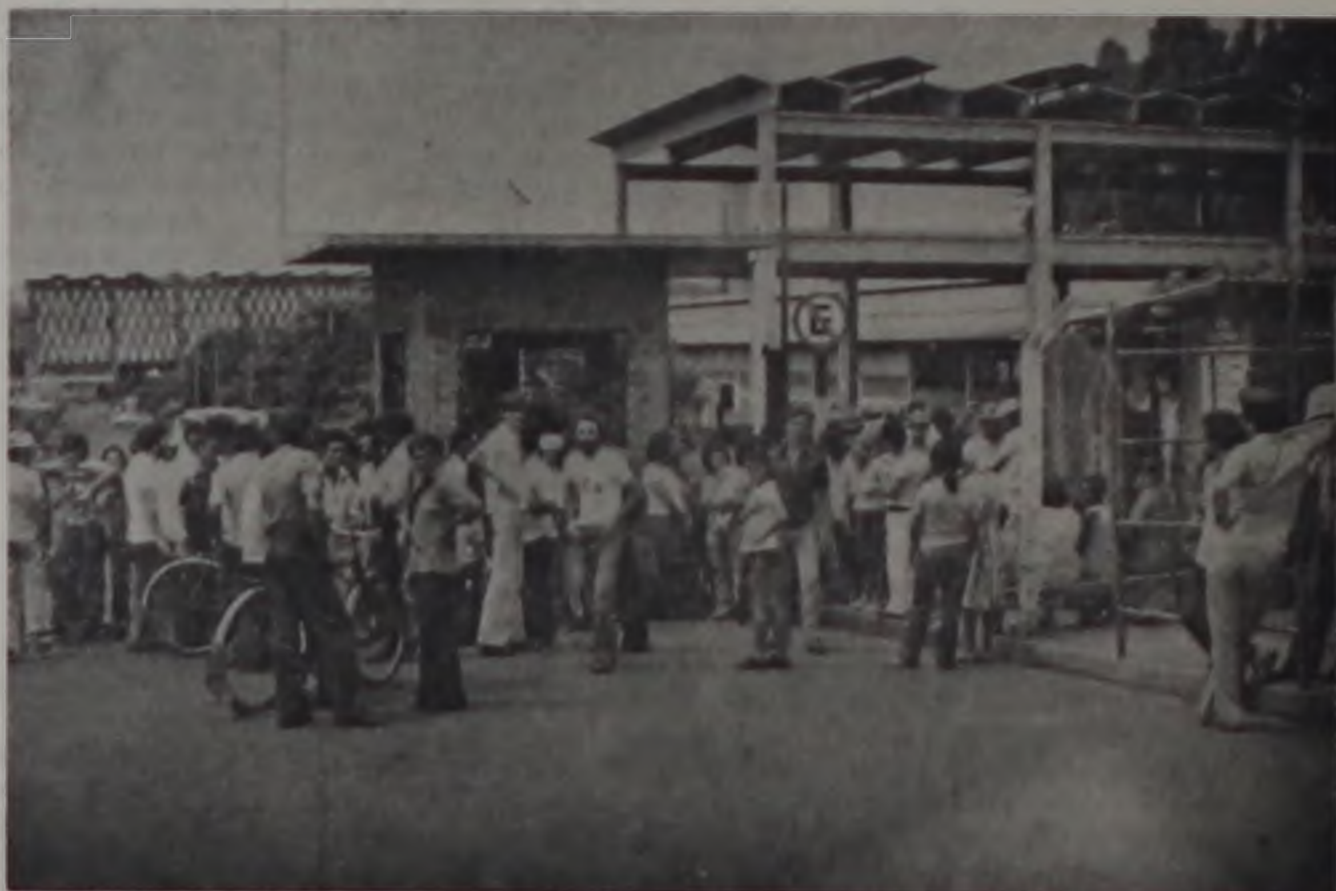
Desde seu início a Sidelpa vem enfrentando dificuldades que agora a desapropriação busca resolver

A falta de sucatas é o motivo principal da paralização hoje vivida pela Sidelpa. De julho até nossos dias essa matéria-prima dobrou de preços e causou problema de capital de giro à empresa, que como é largamente sabido, vem trabalhando com poucos recursos. Mas sua direção informa que já está em fase de liberação uma linha de crédito para investimento na compra de matéria-prima e material de trabalho e para pagamento de pelo menos a complementação dos salários de agosto, possibilitando a volta à atividade.