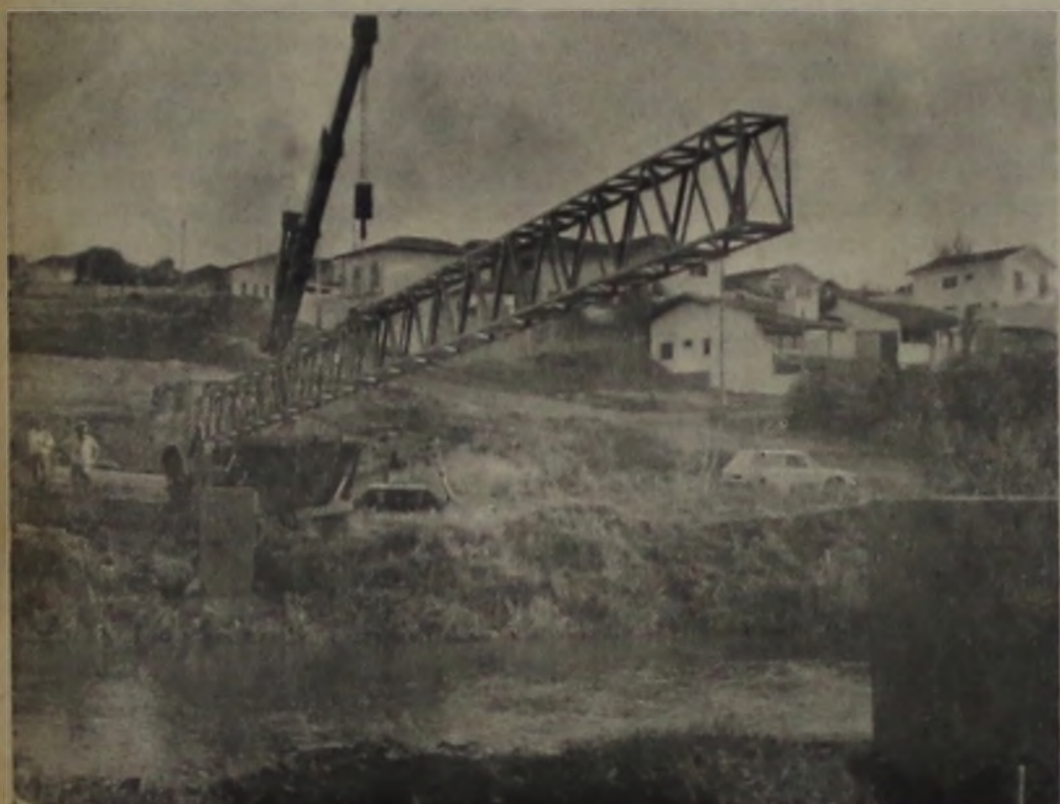
Esta estrutura instalada sobre o rio Lençóis permitiu a ligação do poço à Praça do Peixinho

Desde o último dia 30 já está funcionando o poço do Parque Morumbí. O SAAE ali instalou uma bomba e uma rede de canos, que leva sua água para as torneiras da praça do Peixinho e, o excedente, para o reservatório de abastecimento da cidade. A área