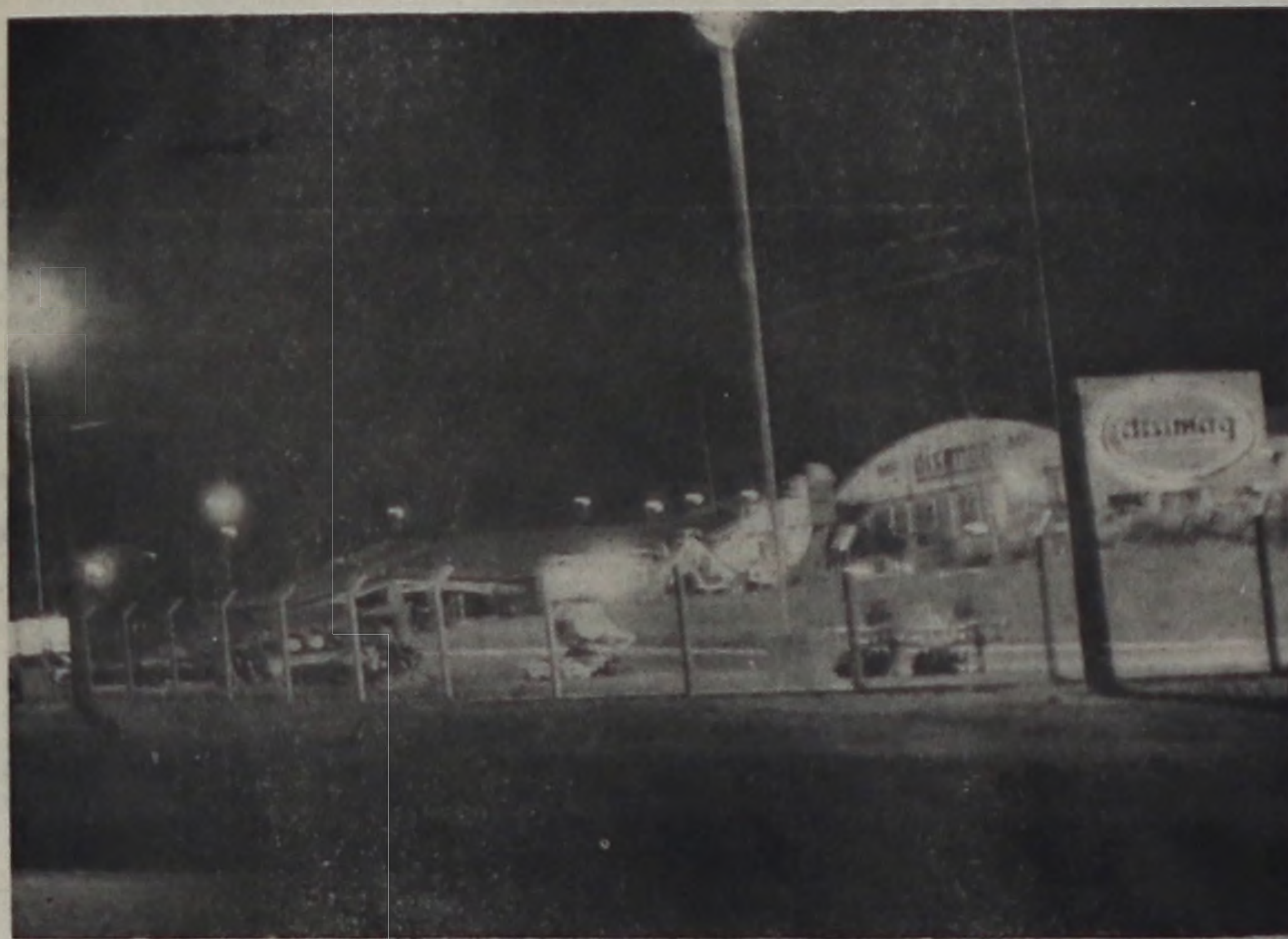
Vista noturna da Disimag S.A. Máquinas Agrícolas de Lençóis Paulista. "Cartão de visitas" na entrada da cidade, pelo trevo da Rondon.

A Disimag S.A. Máquinas Agrícolas comemorou no último dia 14 de setembro mais um aniversário, completando 20 anos de existência. É uma empresa atuante no mercado de máquinas agrícolas e confia nas perspectivas da agricultura brasileira.