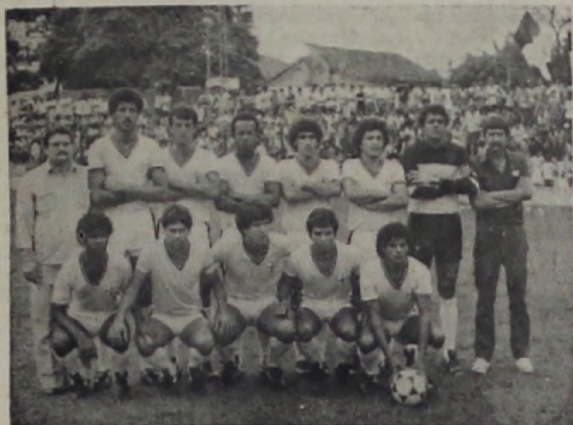
Nem com o título da 3.ª Divisão, em 1983, o CAL superou as dificuldades financeiras.