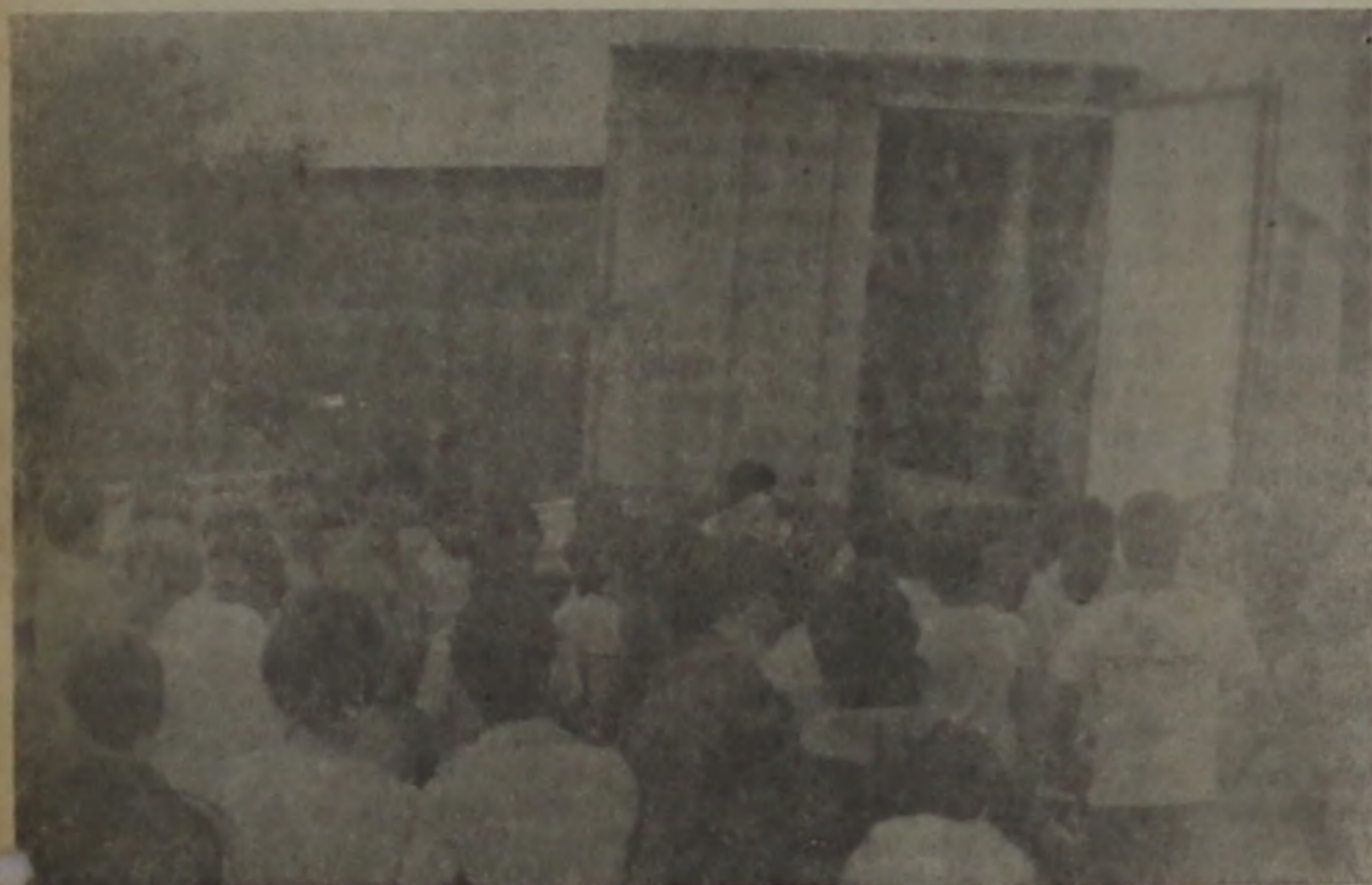
No frigorífico, muitos populares acompanharam o desembarque da carne.

Desde a tarde de ontem estão à disposição da população nos açougues e supermercados da cidade, a carne paraguaia, que chegou ao amanhecer nas duas carretas vindas de Assunção. A mercadoria foi carregada na capital paraguaia na terça-feira e viajou sob refrigeração até às 7h15 de ontem, quando os veículos entraram no trevo.