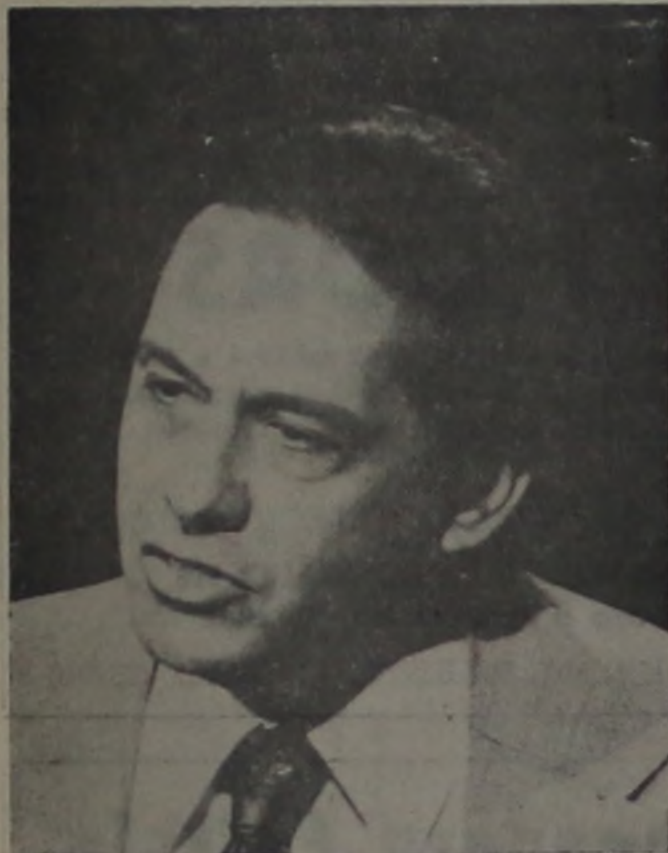
Fernando Henrique: "trabalhar com cédula única".