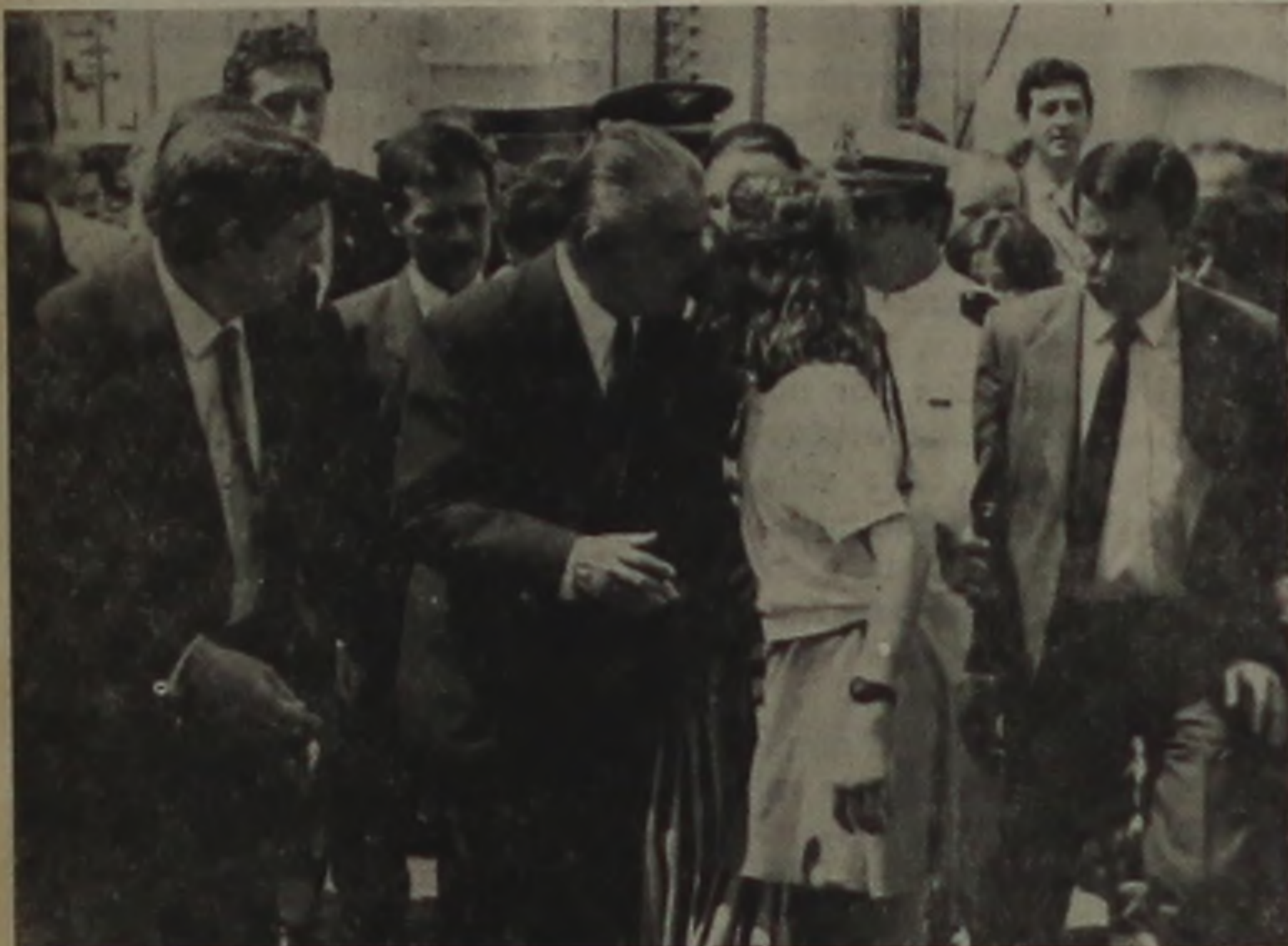
Sarney foi o primeiro presidente a visitar oficialmente nossa cidade. Sua passagem está perpetuada em livro.