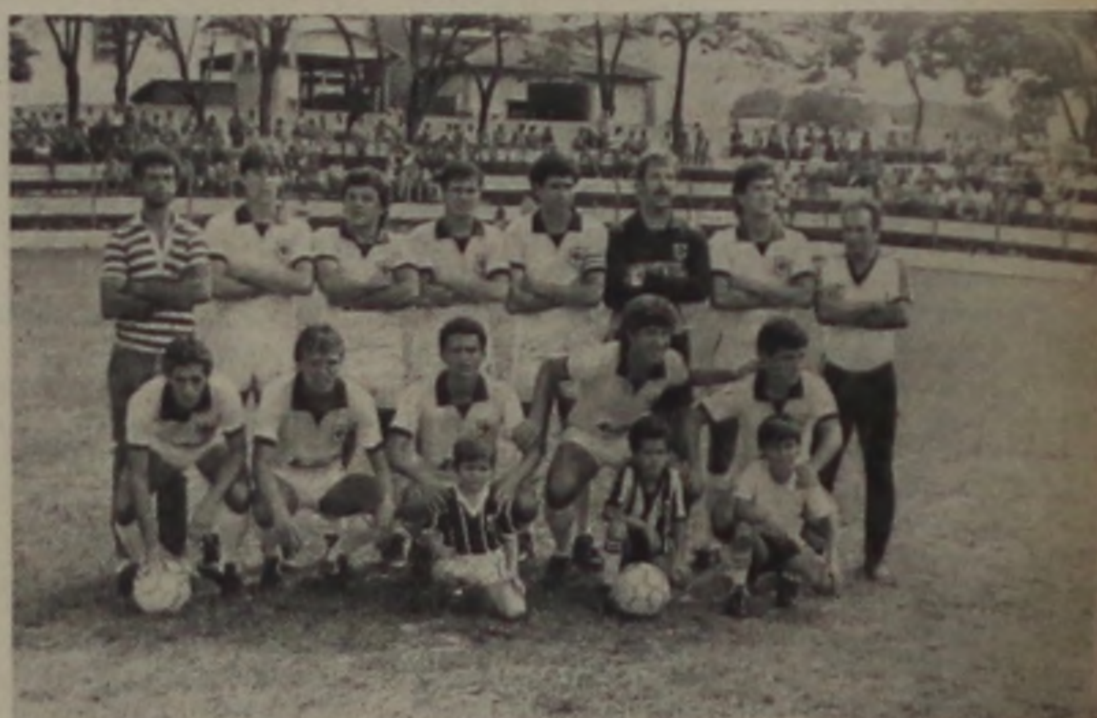
Em campo, o desencanto de um bom time.

Na última apresentação do C.A. Lençoense perante sua torcida, quarta-feira última, a equipe frustrou mais uma vez a expectativa do público quanto a marcação do primeiro gol nessa terceira fase do certame da 2.ª divisão. Já sem condições de classificação, pela derrota sofrida no domingo frente à Catanduvense, o CAL jogou apenas para o cumprimento da tabela, o mesmo acontecendo com a Francana e talvez por isso faltou motivação aos jogadores.