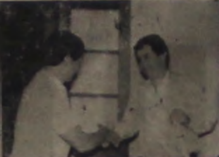
BRDESCO Rua XV de Novembro, 670 Fone: 63.1500