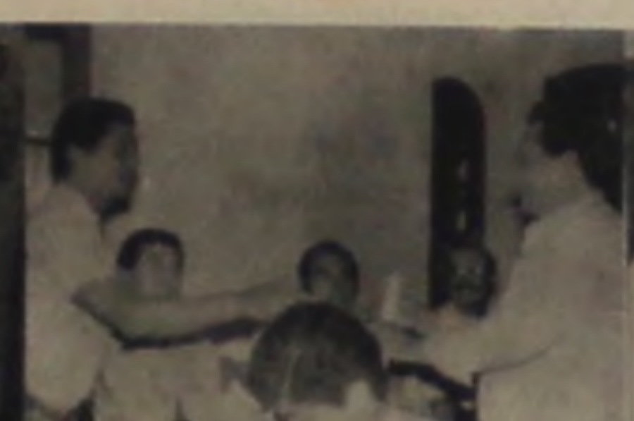
ALFAIATARIA ROCHA Rua Ignacio Anselmo, 139