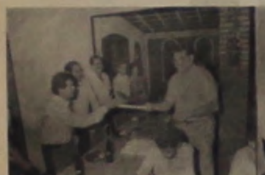
RESTAURANTE GALPAO R. José do Patrocínio, 1.060 Fone: 63.1249