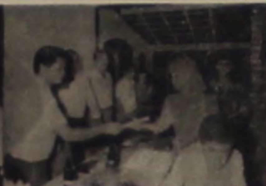
NILCE MODAS R. XV de Novembro, 414 Fone: 63.2020