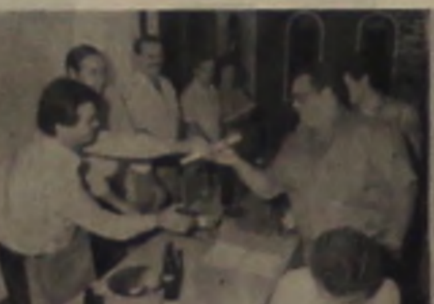
QUITANDAO LENÇOENSE R. 7 de Setembro, 1.033 Fone: 63.0551