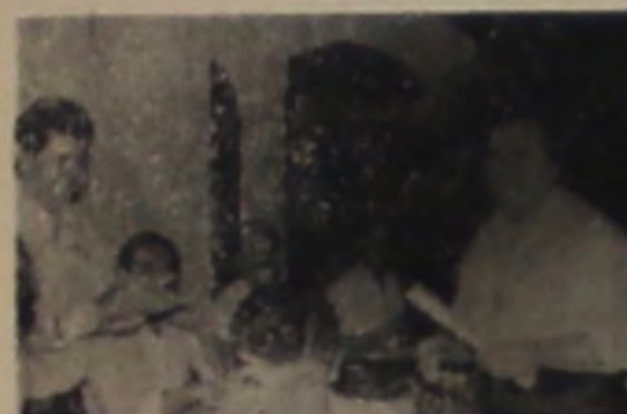
BAZAR SANTA ROSA R. XV de Novembro, 182 Fone: 63.0995

presas que mais se destacaram e assim se fizeram merecedoras do Diploma de Consagração Pública. Abaixo, estão pamos os nomes e as fotos do momento em que recebiam seus merecidos diplomas.