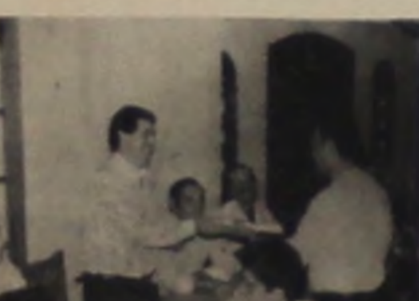
SORVETERIA ILKA R. Anita Garibaldi, 929