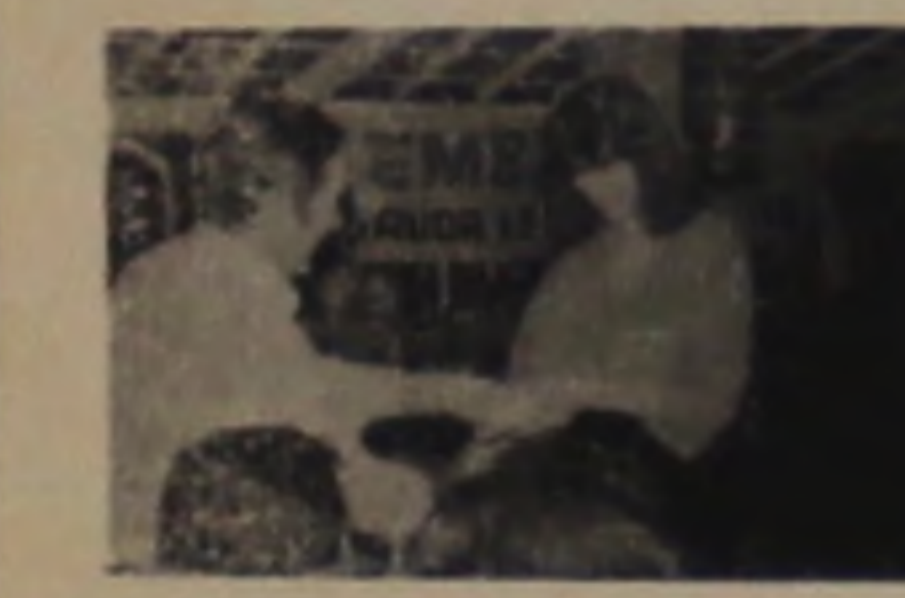
POTES E FLORES R. Floriano Peixoto, 881