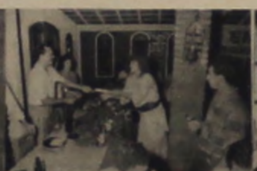
BOUTIQUE AFRODITE MODAS R. Ignacio Anselmo, 223. Fone: 63.0358