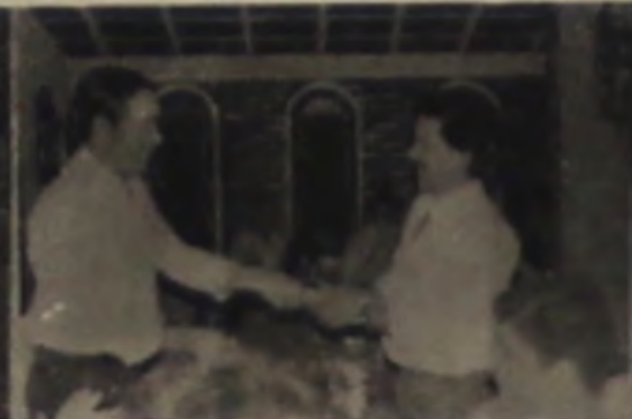
PEPEUS DRINKS BAR R. Octaviano Brisola, 50 Fone: 63.0607