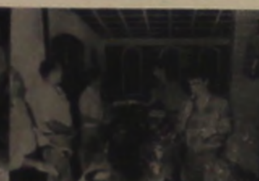
MARCENARIA PESCARA Av. Castelo Branco, 497 Fone: 63.2484