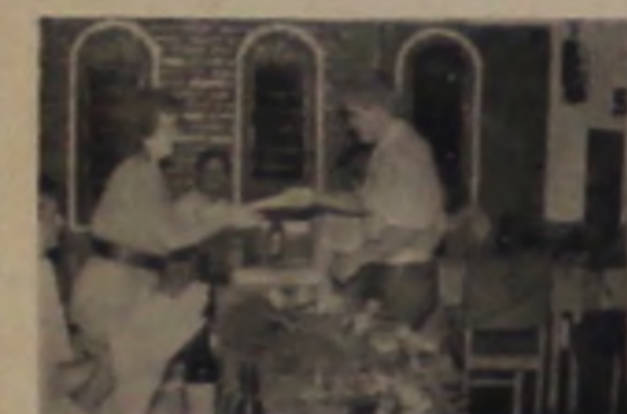
ESTACIONAMENTO CRE DI-CAR Via Acesso - Entrada Lençóis — Fone: 63.1433