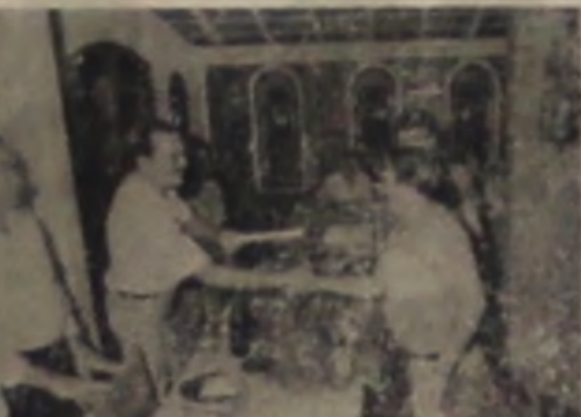
REAL PAINEIS R. Floriano Peixoto 848 - Fone 63.1212