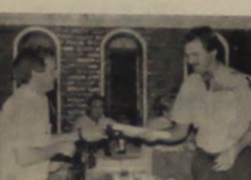
RELOJOARIA E ÓTICA AMETISTA R. XV de Novembro, 636