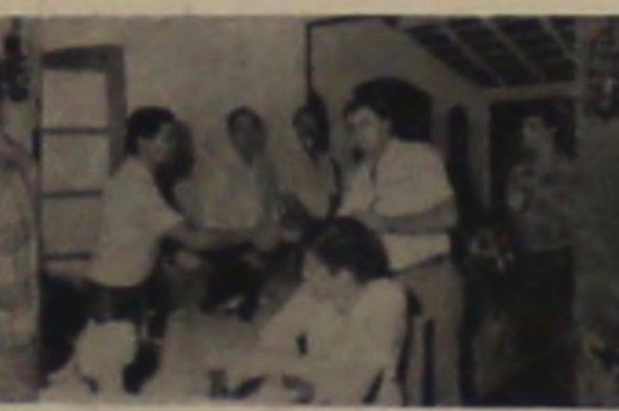
PRINCAL - RETIFICA DE MOTORES R. XV de Novembro, 782 Fone: 63.1581