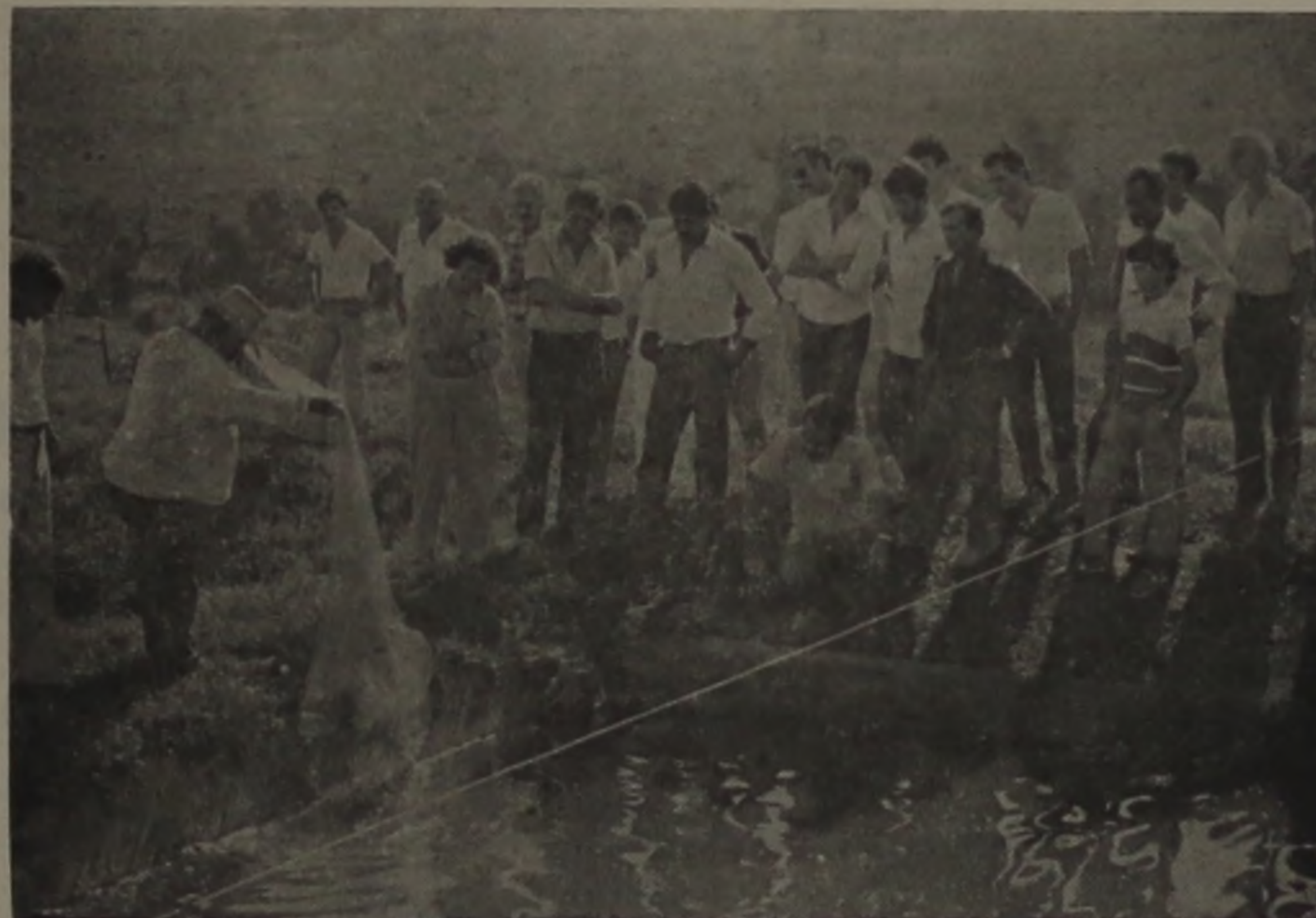
A estação de piscicultura local tem atraído muitos técnicos de outras localidades.

Técnicos de Moçambique, em visita ao Brasil para verificação de trabalhos no setor de alimentação e abastecimento estarão em nossa cidade na próxima quarta-feira, quando