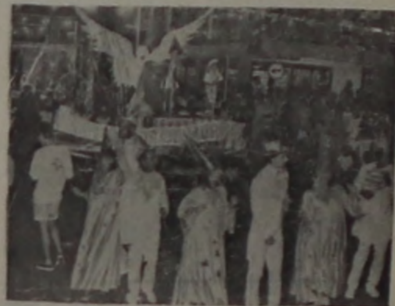
A "Unidos do morro" fez um desfile quase perfeito...