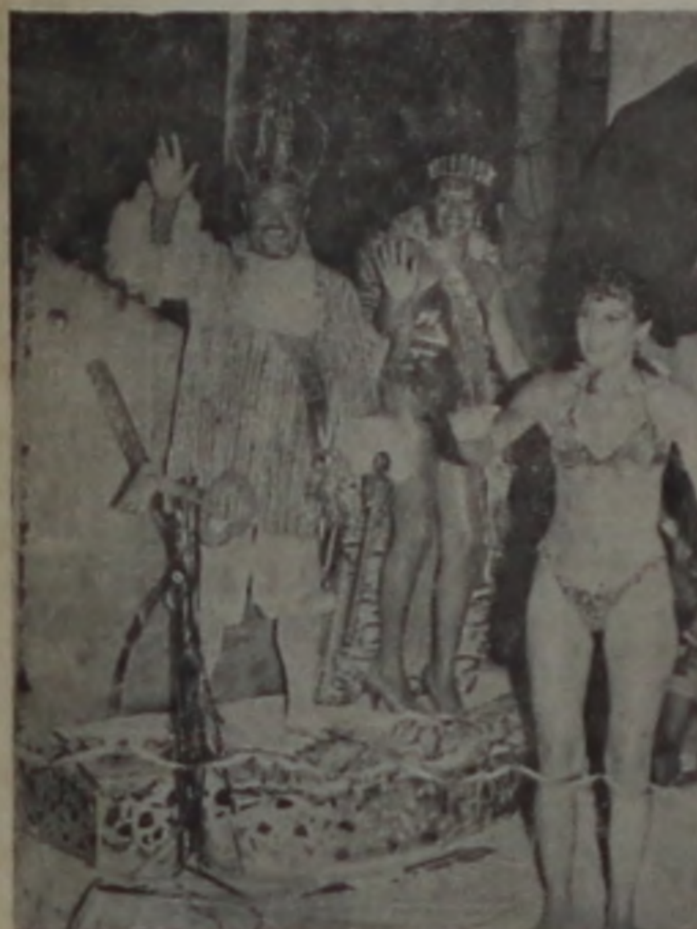
Rei e Rainha desfilaram antecedendo as escolas.