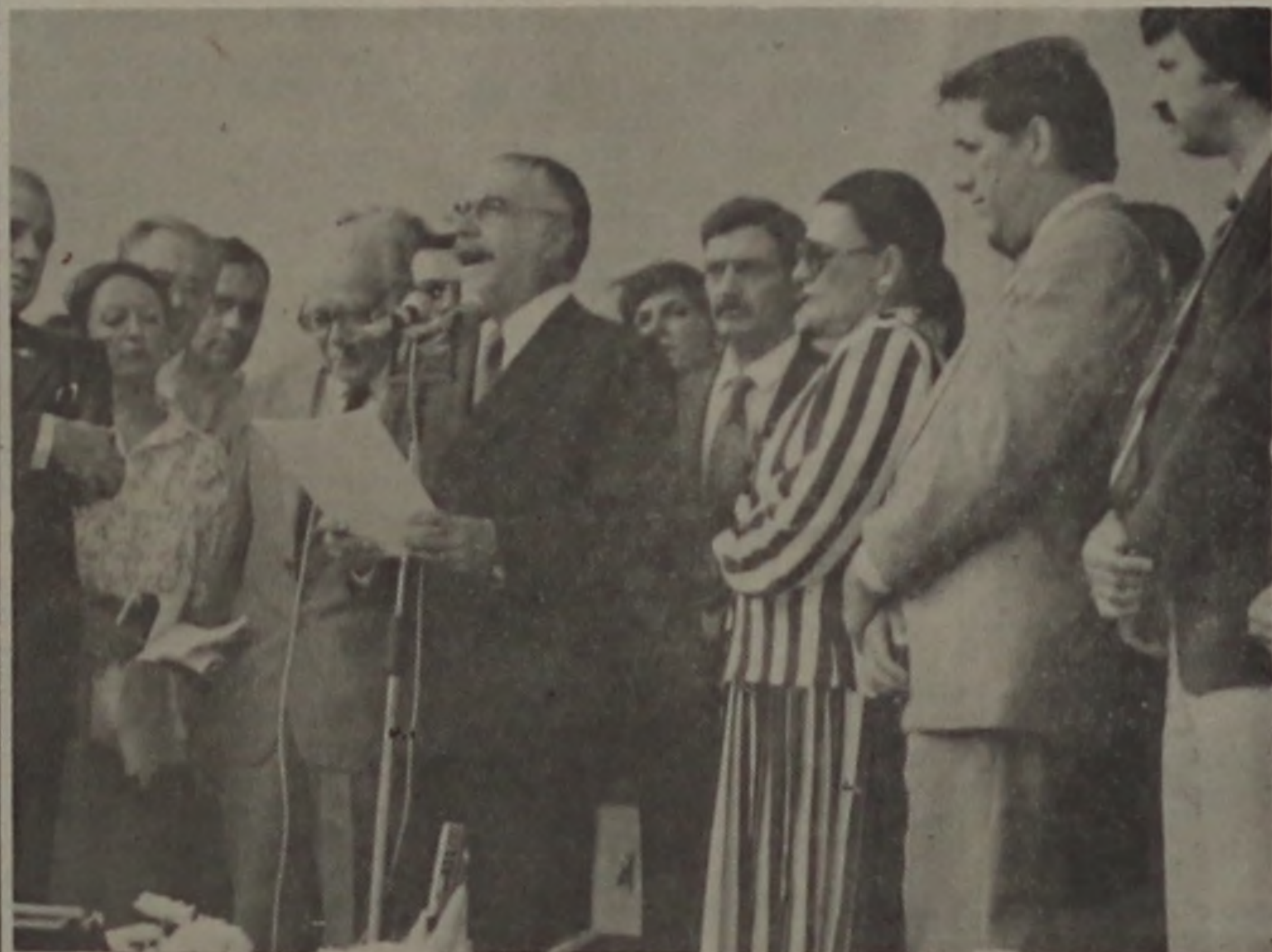
Há um ano, uma multidão se comprimiu na concha acústica para ouvir Sarney e Orígenes Lessa.

... "Tenho completa consciência do papel histórico meu e de nosso tempo. Ou teremos reformas, ou viveremos com justiça social, ou seremos uma força de paz no mundo — ou é melhor não viver". Essa importante frase foi dita há exatamente um ano, em nossa concha acústica, pelo presidente José Sarney — o primeiro chefe