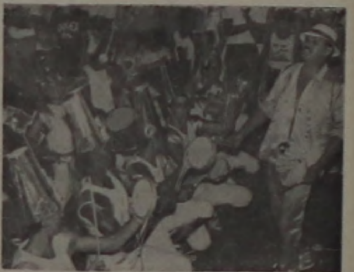
...Pela segurança de sua bateria