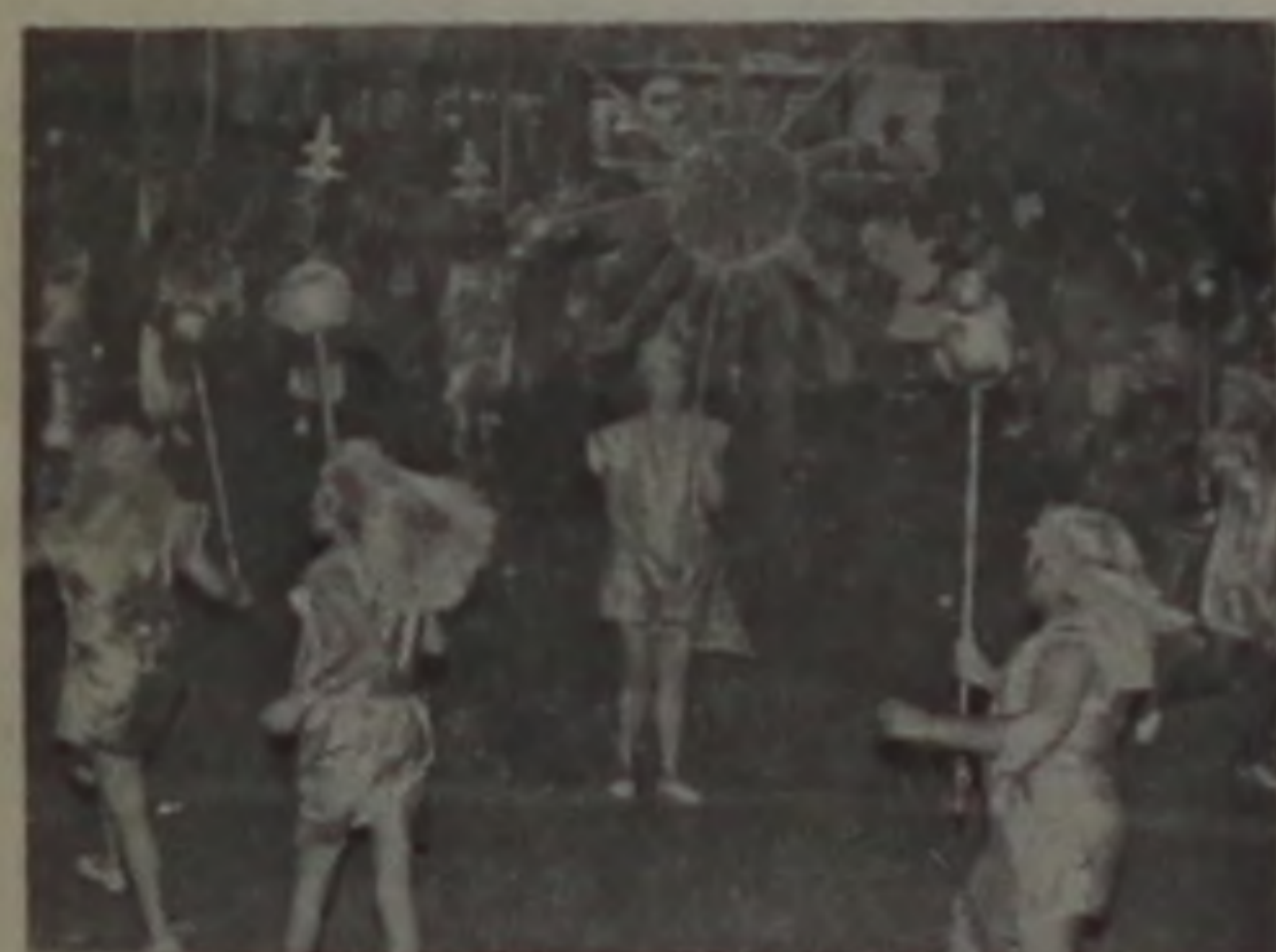
... E trazendo muita criatividade em suas alegorias

Uma multidão de mais de 20 mil pessoas foi atraída para a rua XV de Novembro, nos dois dias de desfiles do nosso carnaval, para assistir as apresentações das escolas de samba "Acadêmicos da Praça", "Unidos do Morro" e "Mocidade Independente do Jardim Ubirama", além dos cinco blocos que também proporcionaram muita descontração ao público.