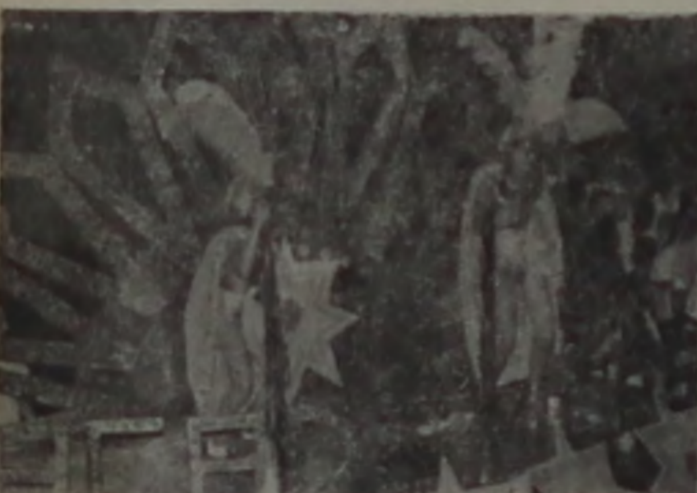
"Acadêmicos da Praça", a primeira a desfilar...