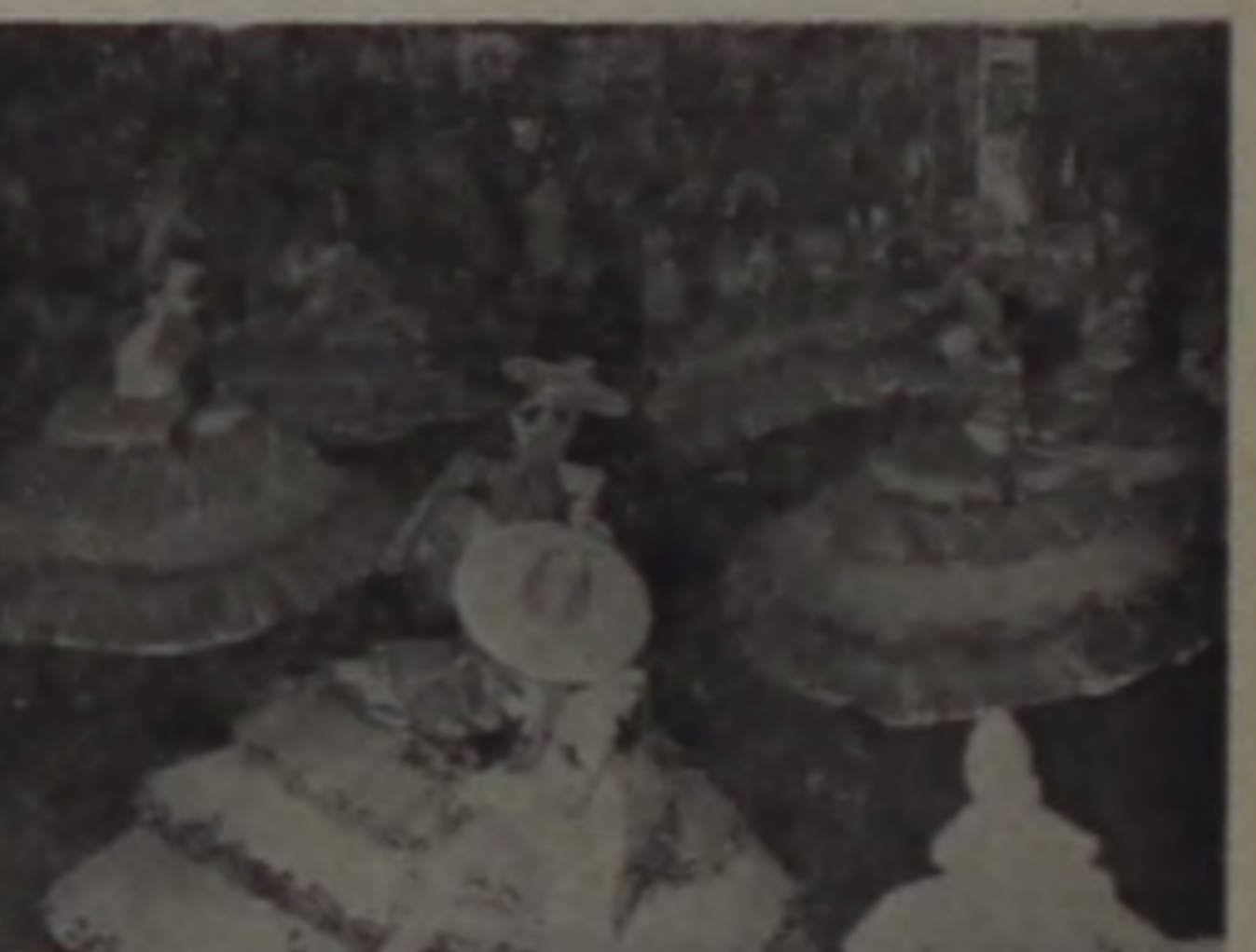
... e o bom visual da ala das baianas.