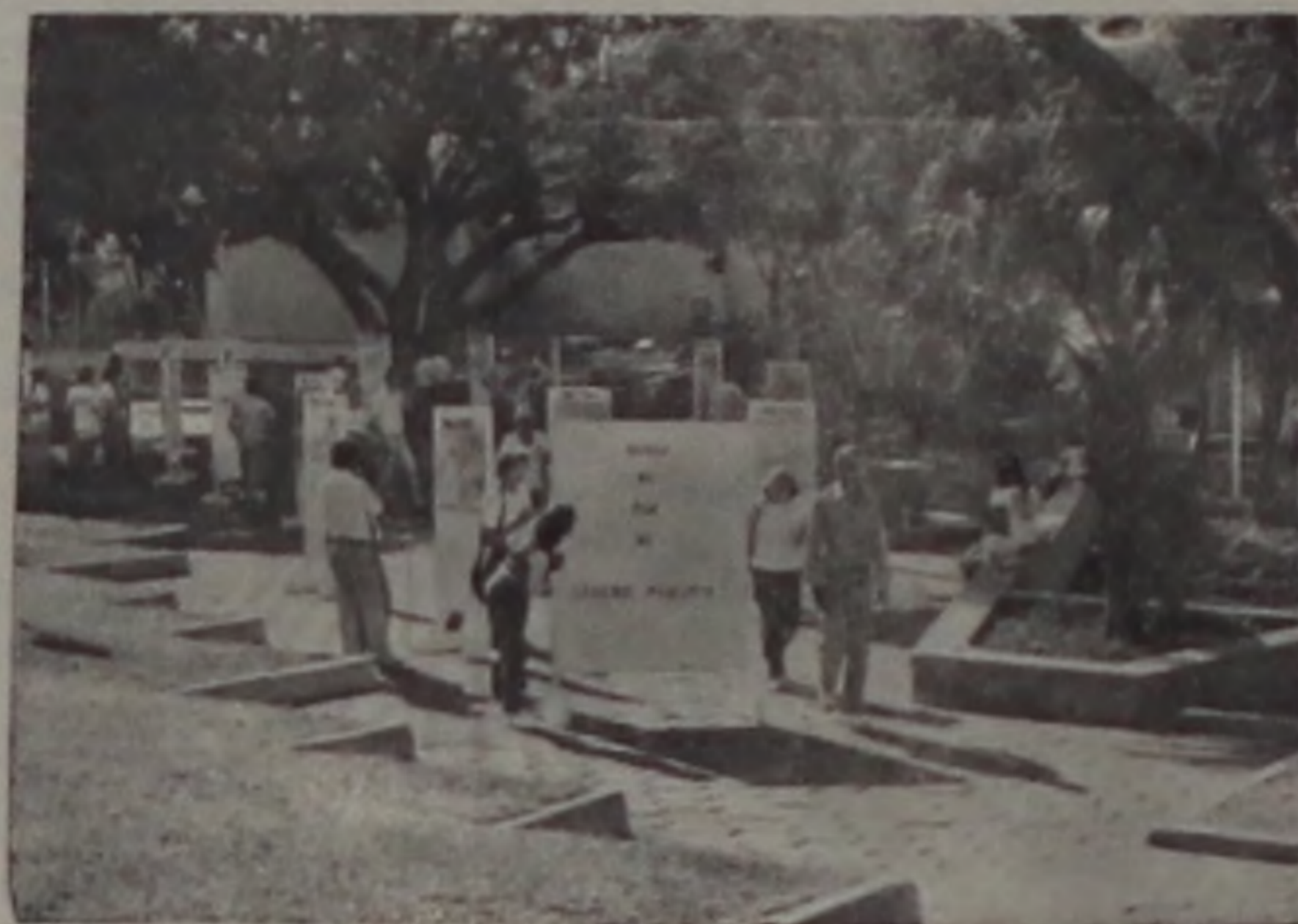
O projeto culminará com uma mostra, nos moldes do "Museu de Rua".

Começa segunda-feira, na Casa de Cultura, o curso educativo e informativo sobre fotografia, dentro do projeto "Fotografe sua cidade", com a participação de 40 crianças na faixa de 8 a 12 anos de idade, todas estudantes de escolas estaduais escolhidas aleatoriamente.