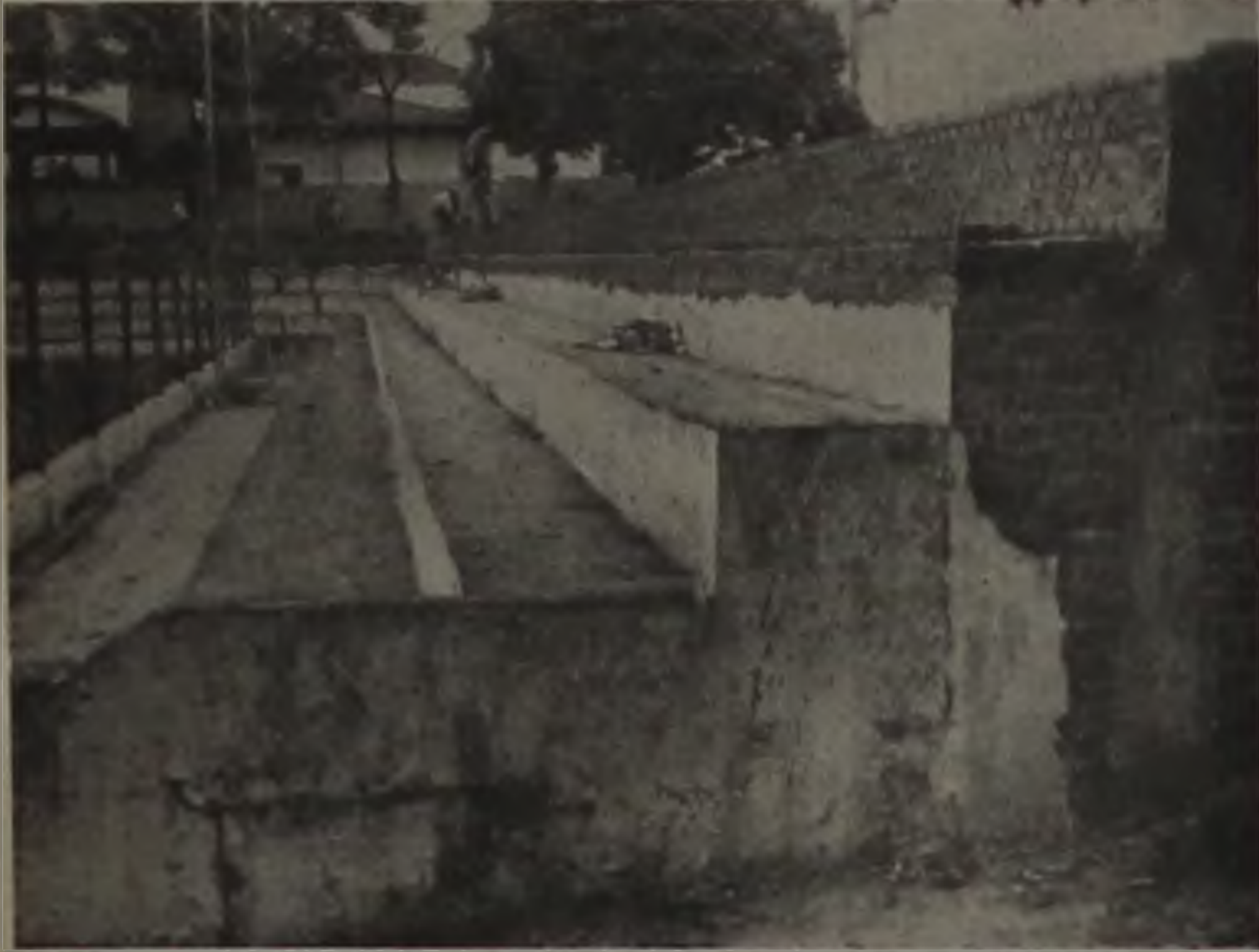
O Velho "Bregão" será finalmente vendido.

Na sua última sessão, a Câmara Municipal aprovou os projetos de autoria do prefeito, que permitem a venda do Estádio Municipal "Archangelo Brega" e do Hotel Municipal, com a finalidade de dar início à construção do novo estádio.