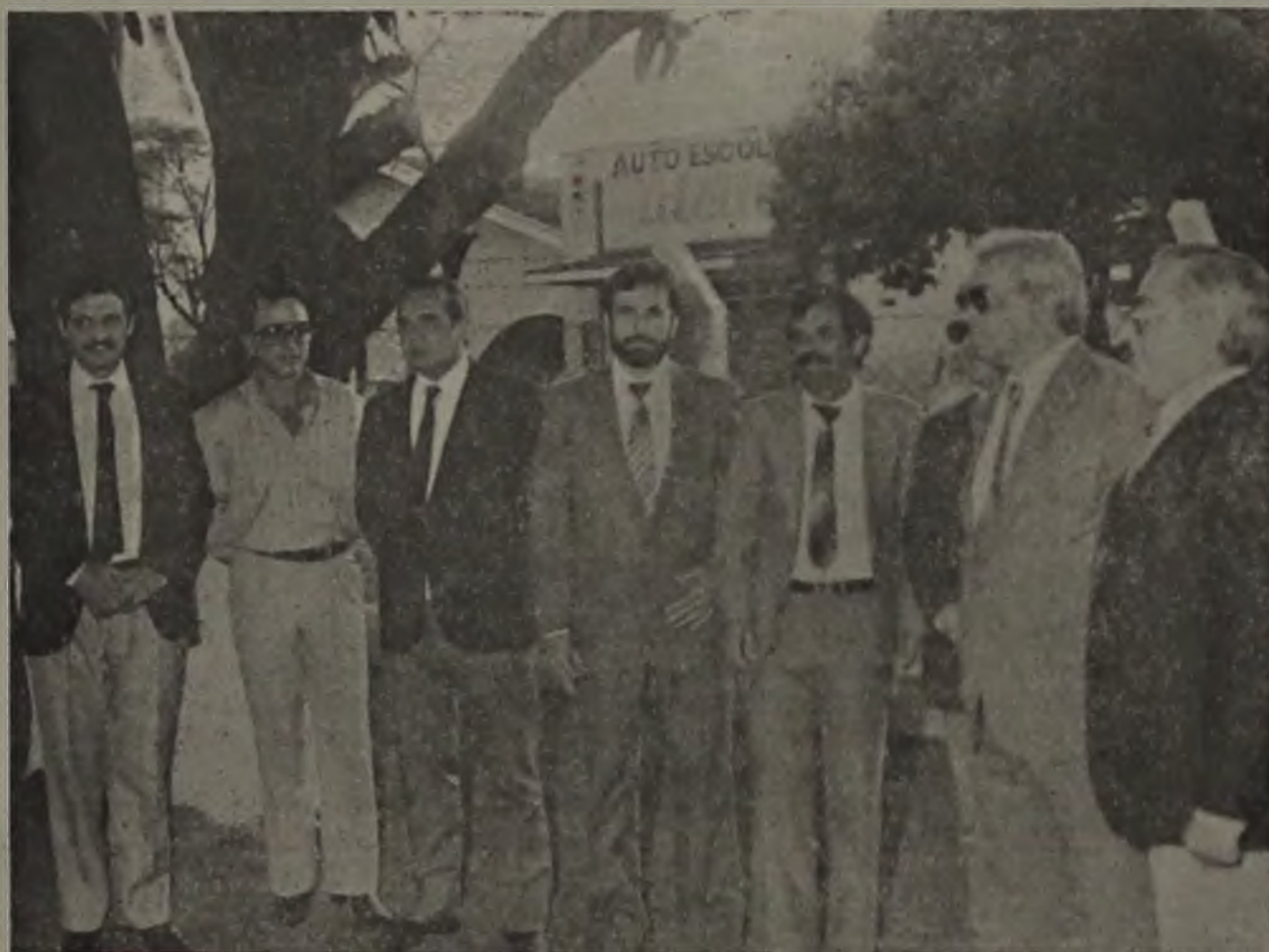
A solenidade foi bastante prestigiada, por autoridades locais e regionais.