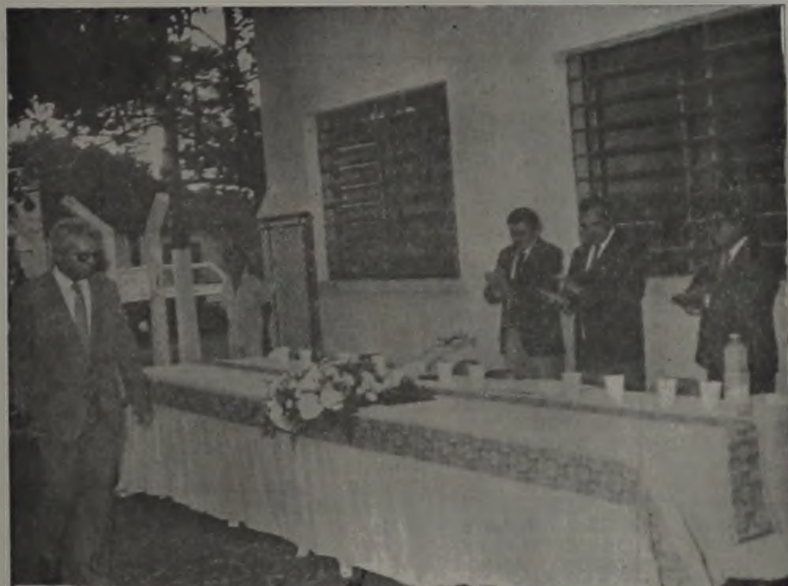
O novo delegado titular foi calorosamente saudado ao dirigir-se à mesa