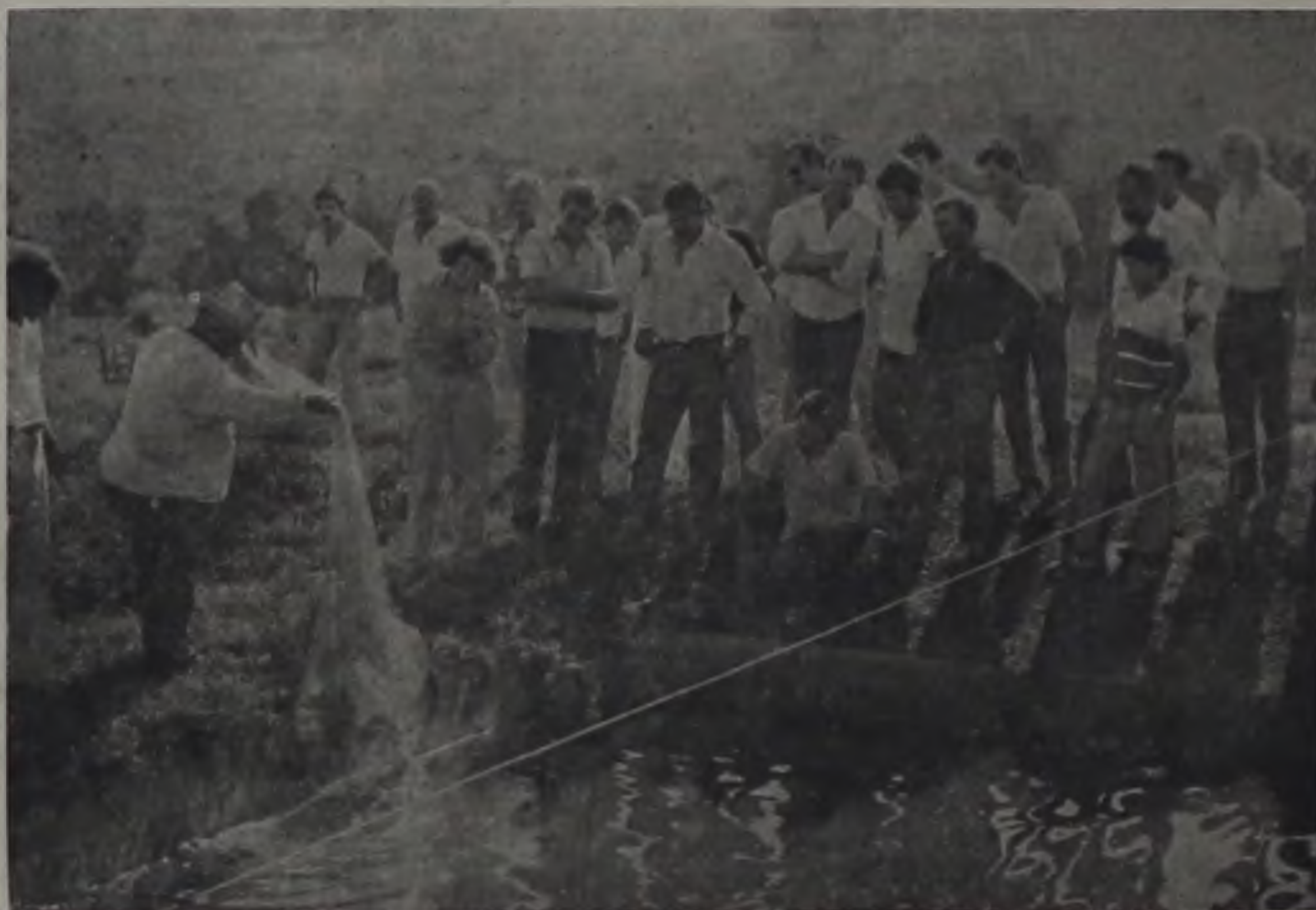
Técnicos de mais de duas dezenas de municípios, como nós conveniados com a Secretaria da Agricultura, vieram a Lençóis conhecer pormenores do trabalho pioneiro.

Se alguém duvidava da possibilidade de Lençóis Paulista vir, ainda, a ser um município produtor de peixes, não tem mais motivo para dúvida. Num trabalho de vanguarda, em 1984 instalamos a 1.ª estação pública de piscicultura do Estado de São Paulo e para cá trouxemos técnicas e exemplares de peixes economicamente viáveis como a carpa, a tilápia e o black bass. Os filhотinhos cresceram e foram distribuídos para represas, lagos naturais e artificiais e tanques de engorda em nossas propriedades rurais. Como incentivo, além dos peixes, também ajudamos ao proprietário rural na instalação dos seus tanques.