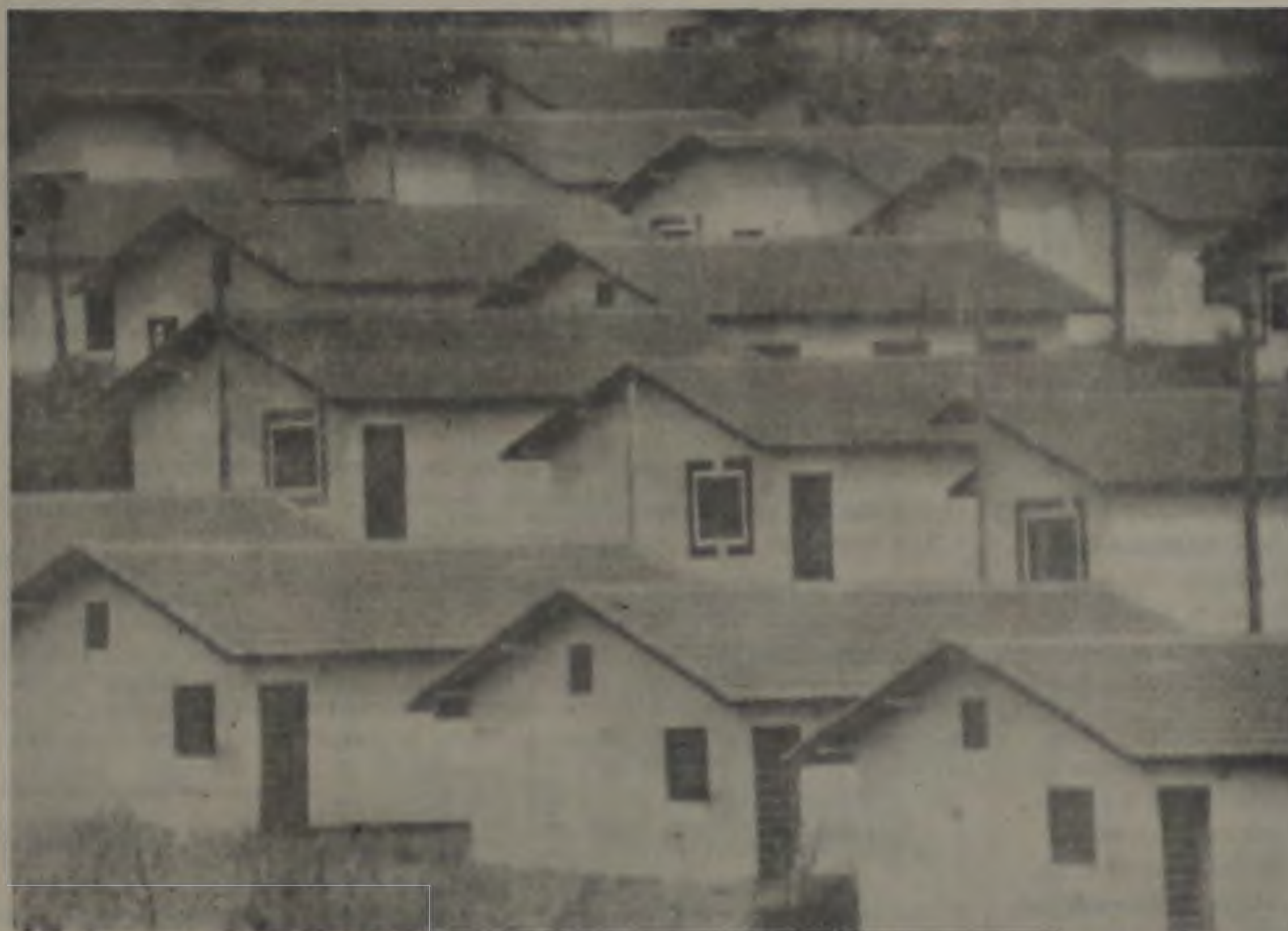
Quatro meses depois de inaugurado o novo núcleo receberá iluminação.

Terá início na próxima semana a implantação da iluminação pública no conjunto de 254 casas recentemente entregues pela COHAB em nossa cidade. A informação foi prestada ontem por fontes da Companhia Paulista de Força e Luz ao prefeito Ideval Paçola, que solicitou o empreendimento em junho passado, quando a obra