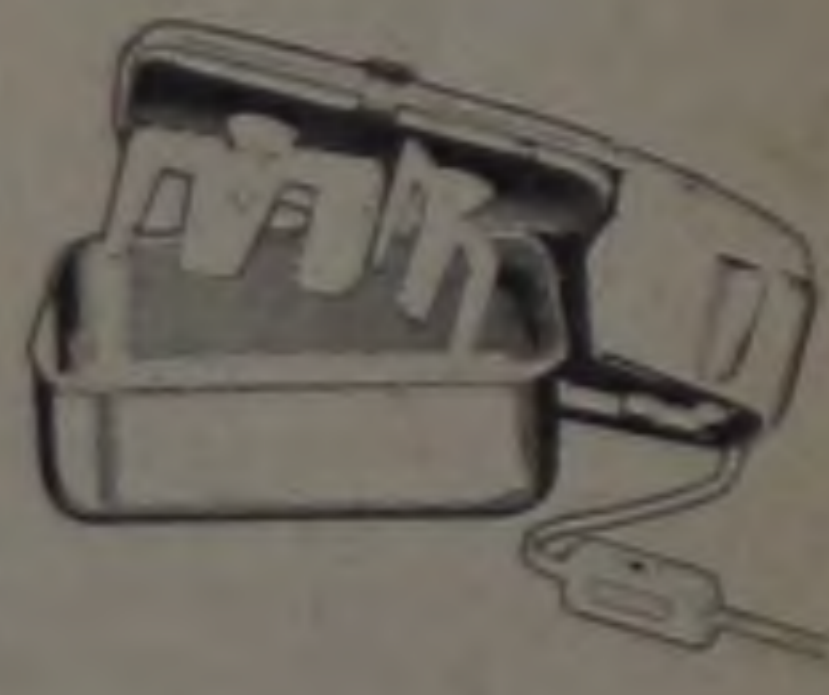
Sorveteira Elétrica Arno Única sorveteira que permite fazer em casa sorvetes puros e naturais, com maior economia. Recipiente com capacidade para 1 litro e dispositivo luminoso de operação. Em qualquer geladeira, produz sorvetes cremosos e homogêneos.