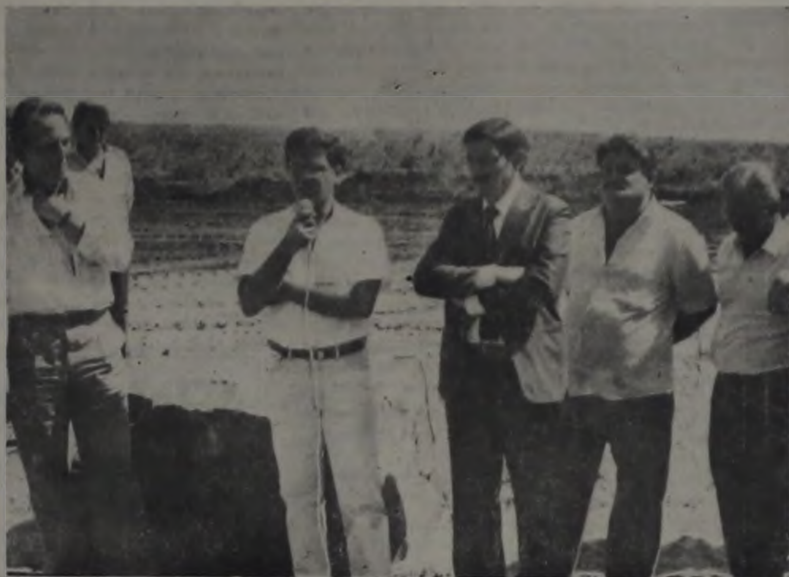
DURANTE OS FESTEJOS DE ANIVERSÁRIO DA CIDADE, FOI FEITO O LANÇAMENTO DA PEDRA FUNDAMENTAL DO EMPREENDIMENTO.

Centro de trabalho dos mais importantes do Estado, Lençóis Paulista, dentro do seu grande surto de desenvolvimento industrial e de prestação de serviços, vem de há muito ressentindo a falta de mão-de-obra especializada. E o pior de tudo é que, ao mesmo tempo em que nossas empresas são obrigadas a buscar profissionais em outras praças, os nossos jovens têm deixado nossa cidade em busca do desenvolvimento de suas habilidades.