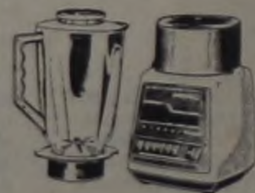
Multi Processador Arno O dois-em-um para a cozinha rápida e fácil. Reune o maior e mais potente liquidificador com 2,3 litros de capacidade, e um processador de alimentos para picar, ralar, triturar, moer ou fazer patê. Com travas de segurança.