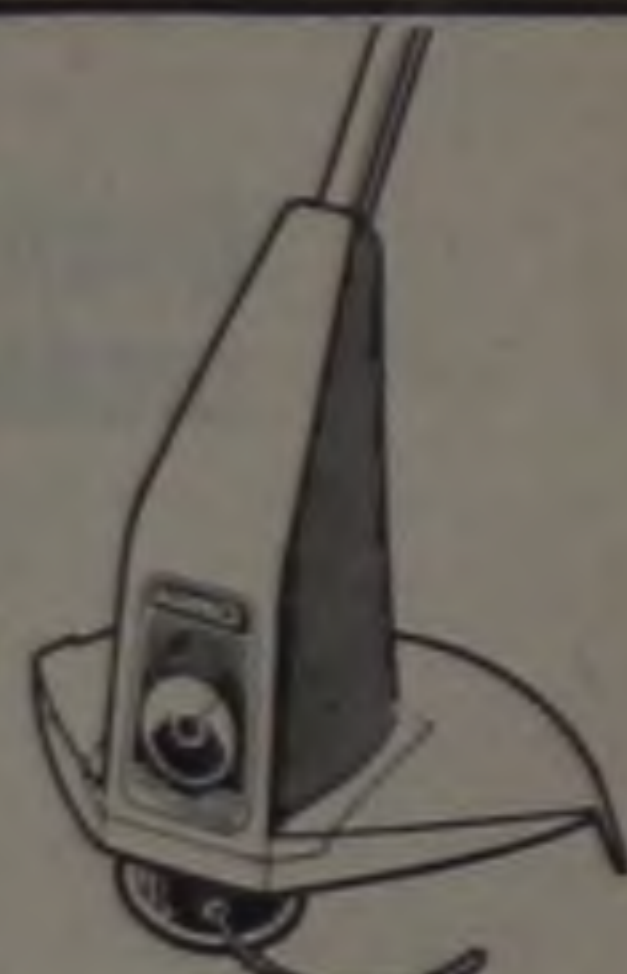
Cortador de Grama Arno Moderno sistema de corte a fio de nylon, ideal para gramados pequenos ou médios. Corte todos os tipos de grama, em qualquer lugar. Com avanço automático do fio de corte.