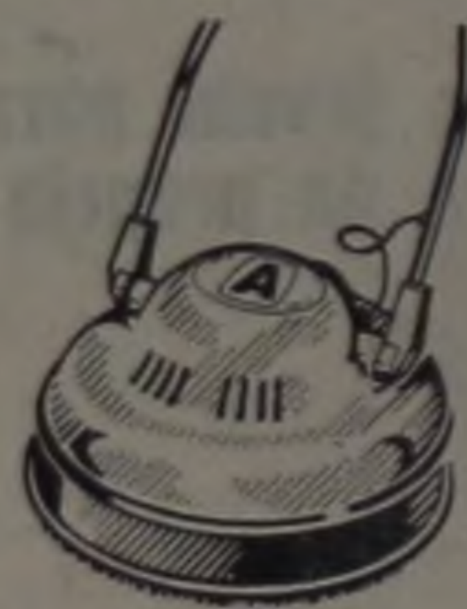
Enceradeira Nova Arno Com haste dupla cruzada para maior estabilidade. Carcaça de metal esmaltada, com apenas 13 cm de altura. Cinta protetora evita marcas em móveis e rodapés.