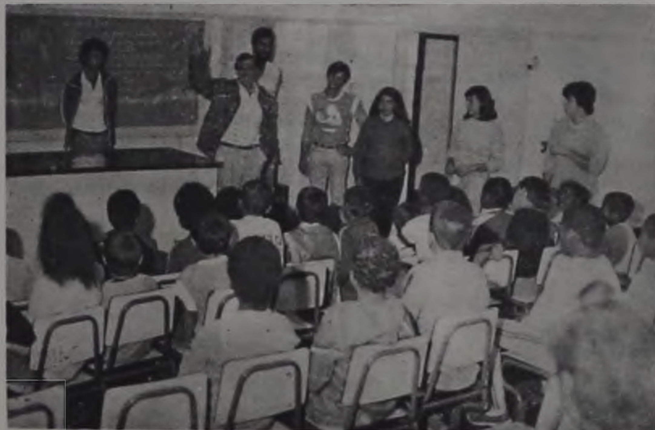
Desde que o programa foi instituído, Lençóis recebe crianças da área metropolitana.

Desde a instituição dos programas "Interior na Praia" e "Redescobrimo o Interior", pelo governo do Estado, Lençóis Paulista vem fazendo parte dessas promoções. Em janeiro encaminhamos nossos meninos e meninas para o litoral — que muitos ainda desconhecem — e nas férias de julho recebemos crianças vindas da Capital para durante uma semana conosco conviver e conhecer as coisas típicas do Interior. Muitas vezes chegamos a nos emocionar diante do espanto dos pequenos visitantes em relação a coisas tão simples para o nosso dia-a-dia, como um animal ou uma planta.