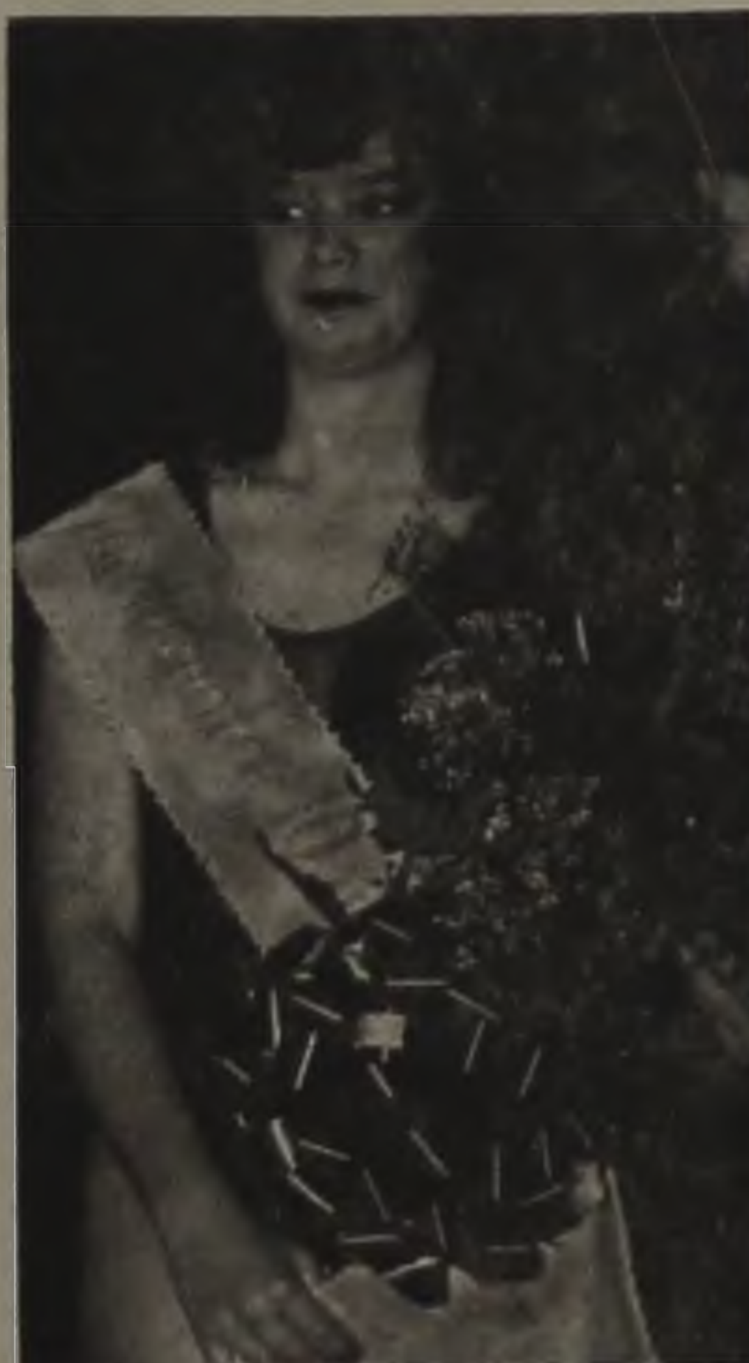
Aconteceu no último domingo, na passarela do Ubirama Tennis Clube, a etapa finalíssima do concurso "Garota Nota 10", com a participação das 10