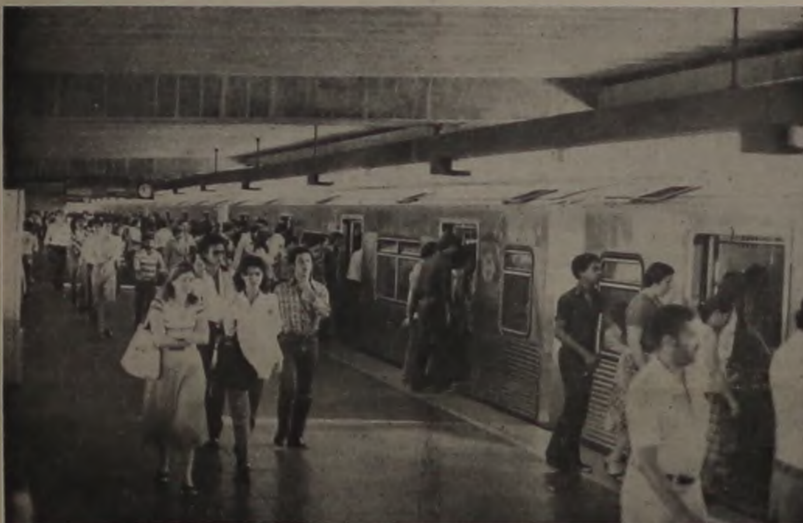
Depois do metrô, o trem expresso é a principal inovação

A Superintendência da Unidade Regional-3 da Fepasa, em Bauru, confirmou no início da semana que os trens de padrão elevado servirão a mais duas linhas, chegando às cidades de São José do Rio Preto e Bauru. Até agora, o trem expresso faz somente a linha entre São Paulo e Araraquara, passando por Jundiaí, Campinas, Americana, Limeira e Rio Claro.