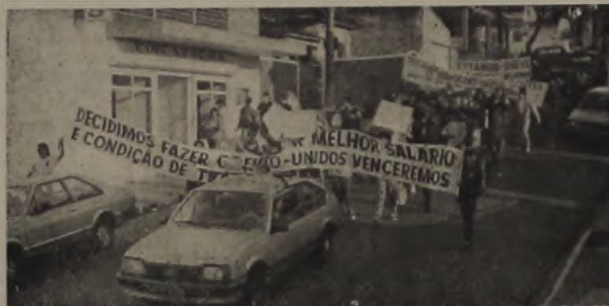
— Os trabalhadores em greve fizeram passeatas pelas ruas da cidade.

Os plantadores de cana de todo o Estado de São Paulo recusaram-se a iniciar a safra em seus canaviais com o preço defasado de NCz$ 9,80 a tonelada e indicam que a recomposição do preço requer um reajuste superior a 80%. A classe, embora trabalhando, continuará mobilizada, em busca de solução para os seus problemas.