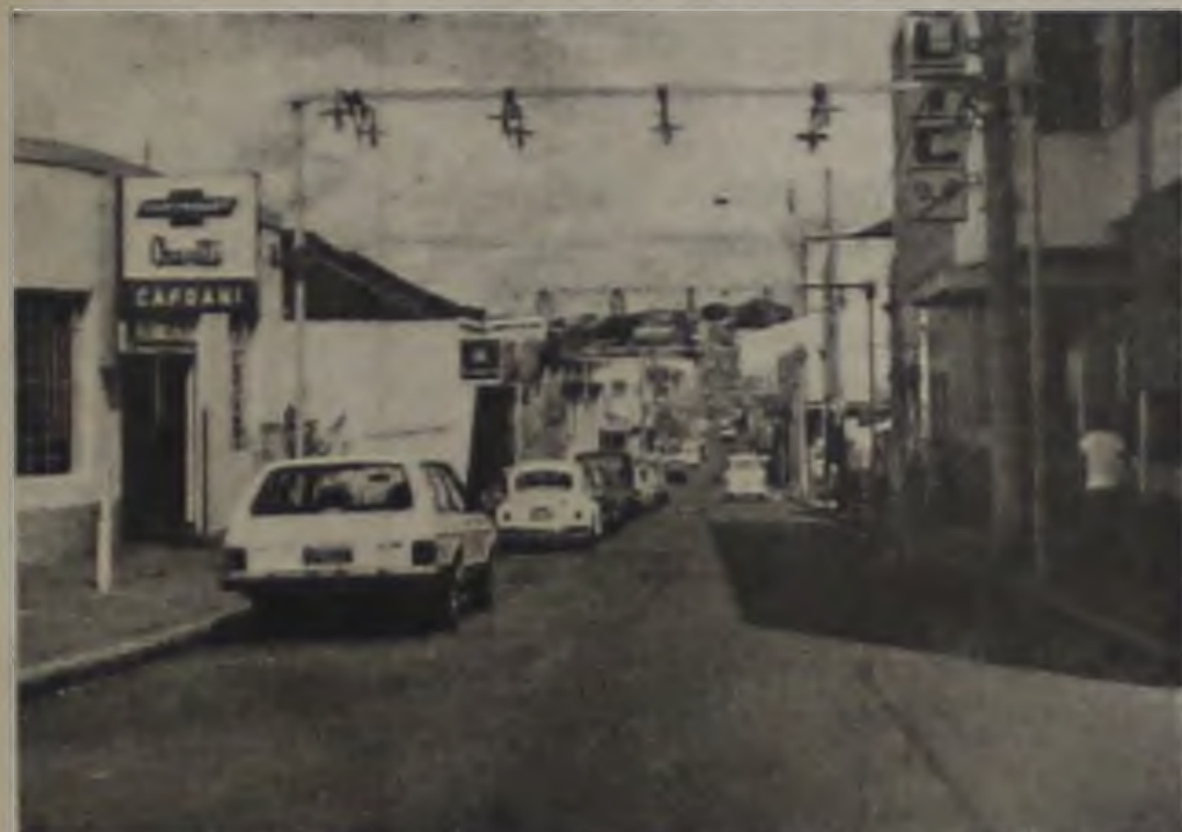
A MEDIDA VAI TRANSFORMAR A RUA XV NOS MÓLDES DO QUE OCORRE NO FIM DE ANO.

A Comissão Municipal de Trânsito, presidida pelo delegado Ciro Bonilha, reuniu-se na noite de quarta-feira para discutir com comerciantes estabelecidos na Rua XV de Novembro a conveniência de implantação do calçadão naquela via, em razão dos crescentes problemas de trânsito que ali se verifica. Houve consenso em torno da transição que, inicialmente, será feita nos moldes do passeio que funciona nos finais de ano, fechando-se a rua para o tráfego de veículos.