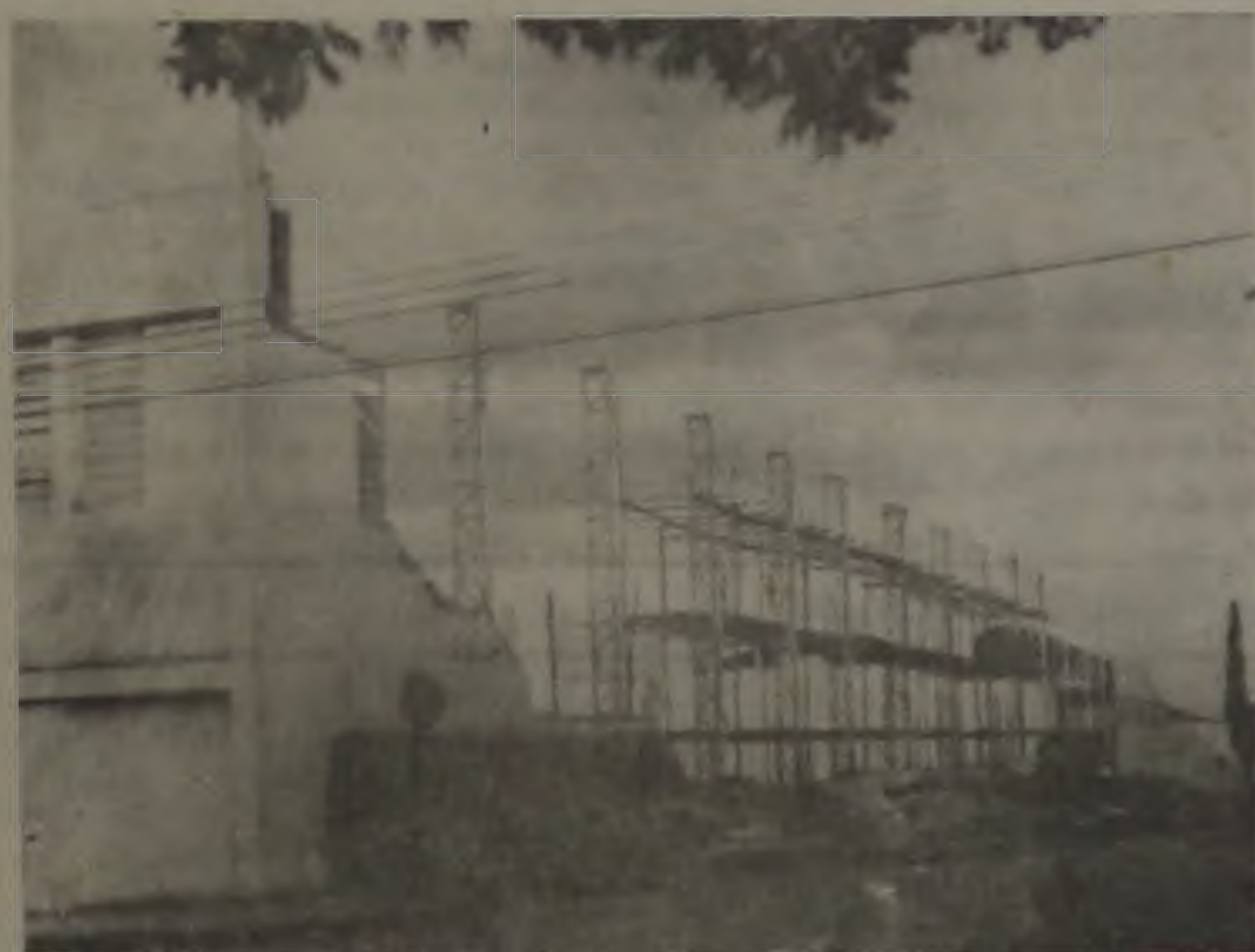
A rua ficou totalmente tomada pelos detritos e uma moto foi danificada

O delegado Ciro Bonilha requisitou um perito engenheiro da Polícia Técnica de Bauru para o levantamento do local e a elaboração de um laudo com base no qual serão apuradas as