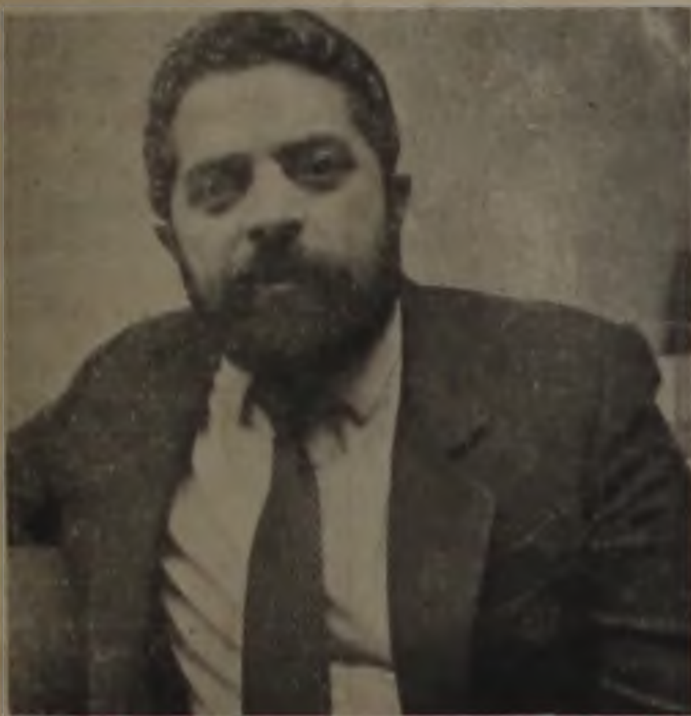
LUIZ INACIO LULA DA SILVA

Um assunto comum em todo o Brasil, predomina hoje nas conversas dos lençoienses: a eleição presidencial que acontece amanhã para a escolha definitiva do homem que sucederá José Sarney, apresentando-se como opções as candidaturas de Fernando Collor de Mello (PRN) e Luiz Inácio Lula da Silva (Frente Brasil Popular).