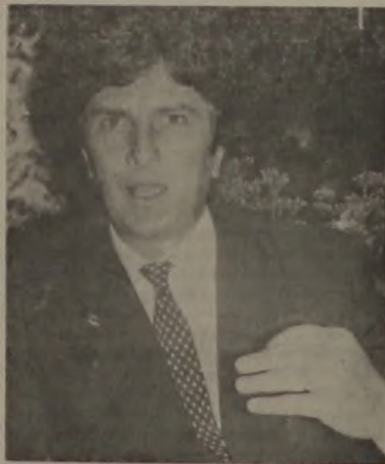
FERNANDO COLLOR DE MELLO

A Justiça Eleitoral está alertando aos militantes para a proibição do trabalho de boca de urna — abordagem para convencimento a menos de 100 metros das seções de votação — e todo e qualquer tipo de propaganda dos candidatos, cabendo inclusive prisão em flagrante aos responsáveis por atitudes consideradas crimes eleitorais. Desde a zero hora está em vigor a "Lei seca", com a proibição da comercialização de bebidas alcoólicas nos bares da cidade.