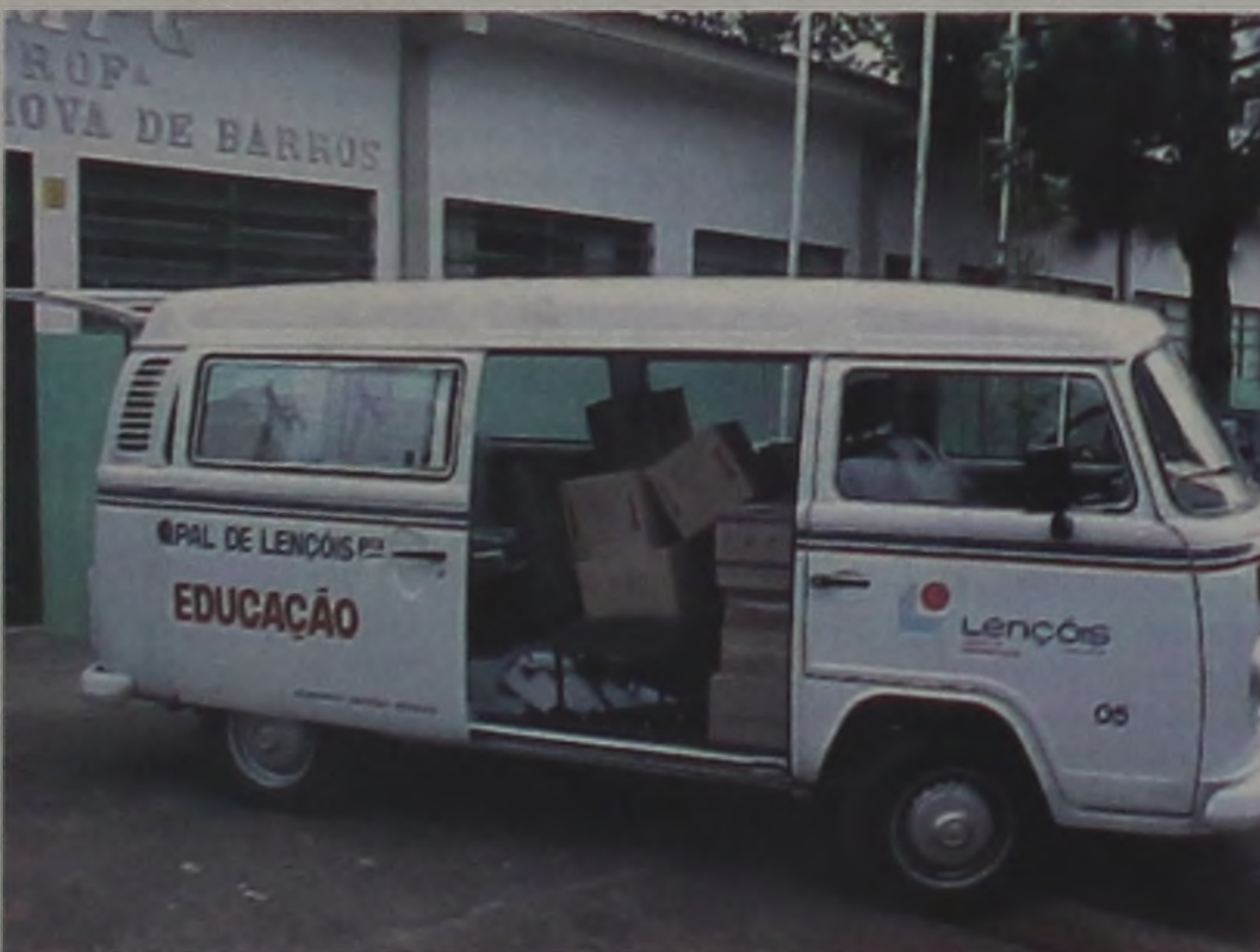
Investimentos totalizam mais de R$ 50 mil somente com materiais

Cerca de 30% de alunos das escolas localizadas na região central e 70% da periferia serão beneficia-