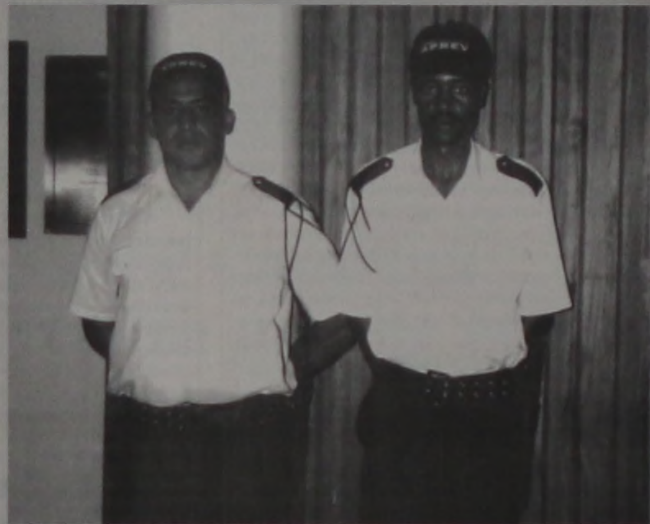
Seguranças contratados da APREV

A Câmara Municipal de Lençóis Paulista contratou dois seguranças para atuarem durante as