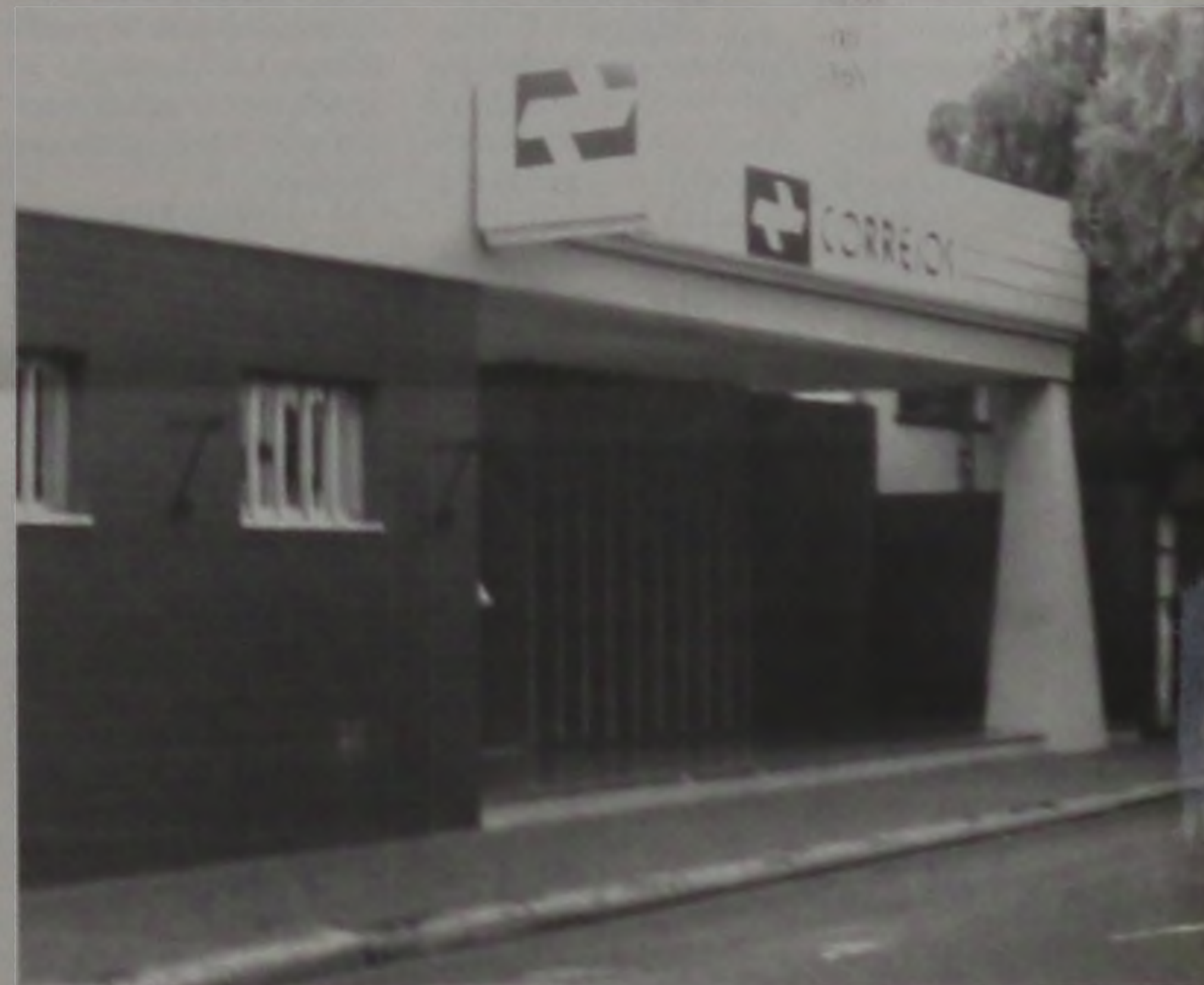
Agência do Correio em Lençóis Paulista

As inscrições podem ser feitas até o dia 4 de abril, mediante a apresentação de cópia de documento de identidade (RG, CNH, ou carteira de Trabalho), CPF e o pagamento de taxa de R$ 15,00. Os candidatos devem ter idade mínima de 18 anos (completados até 31 de julho de 2000), nacionalidade brasileira ou portuguesa, Ter completado o ensino fundamental (antigo primeiro