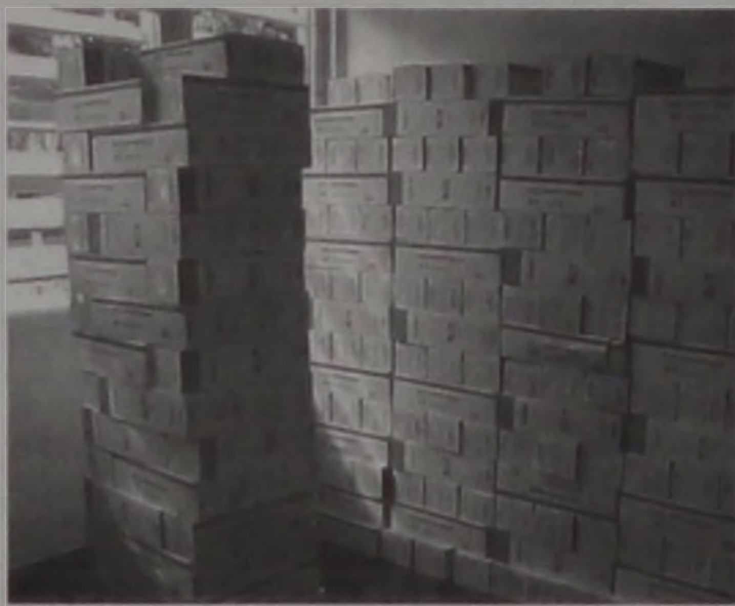
Materials pedagógicas e escolares que serão utilizados pelos alunos carentes do município

Segundo dados da Diretoria de Educação, cerca de 30% dos alunos das escolas localizadas na região central e 70% da periferia serão beneficiados pela distribuição do material: cadernos (desenho, brochurão e universitário), lápis preto e a cores, canetas, cartolinas, papel cartão, laminado e cre-