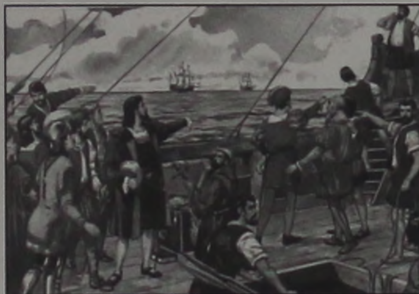
"Terra à vista"

O 43º. dia vai acabando com os outros: trabalho de rotina e no fim do dia, a hora de rezar. De repente, uma notícia se espalha e toda a tripulação olha para o mar e nota algas marinhas. Anoi-tece e não se vê mais nada.