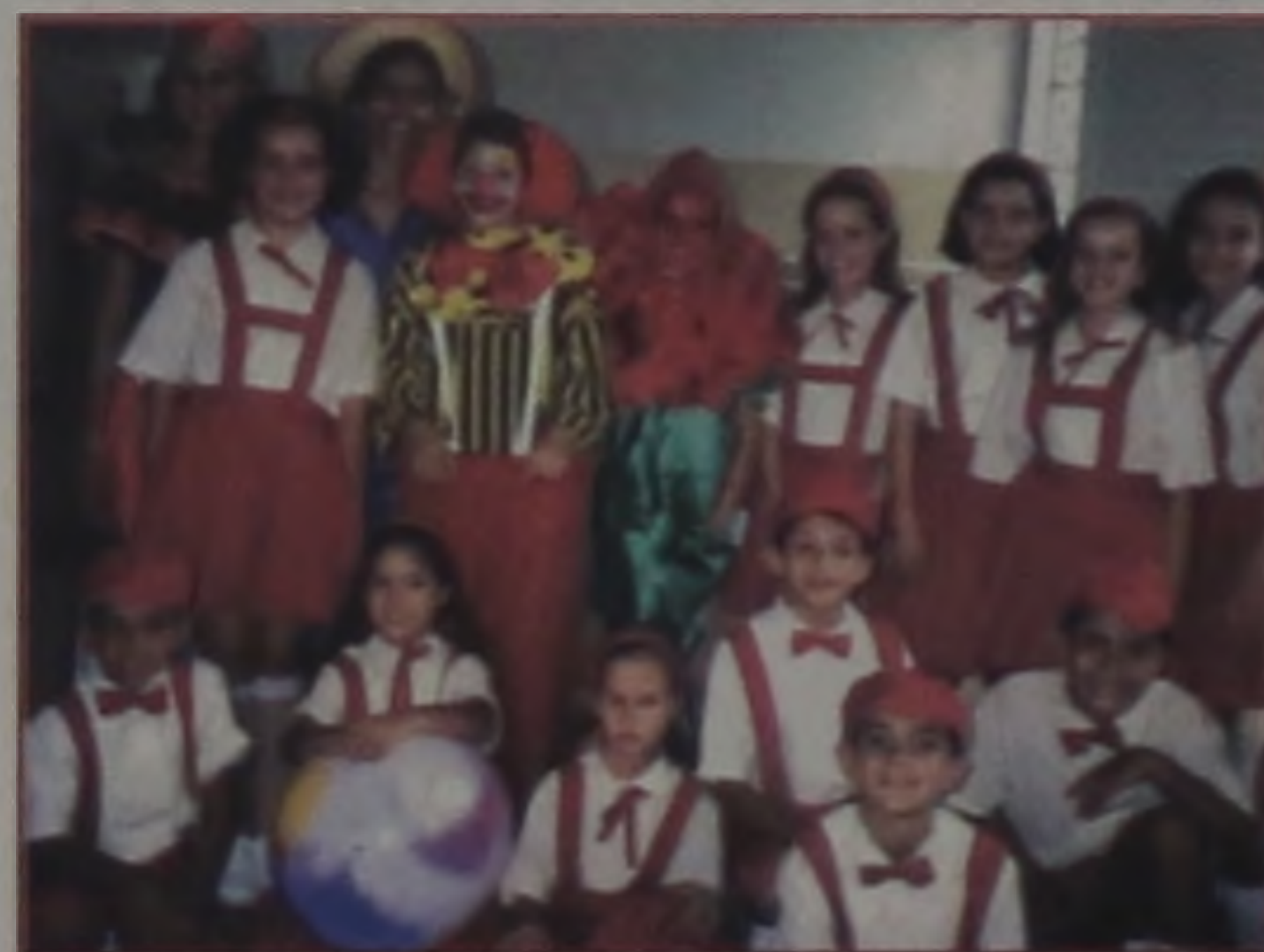
Membros da peça "O Palhacinho Triste"