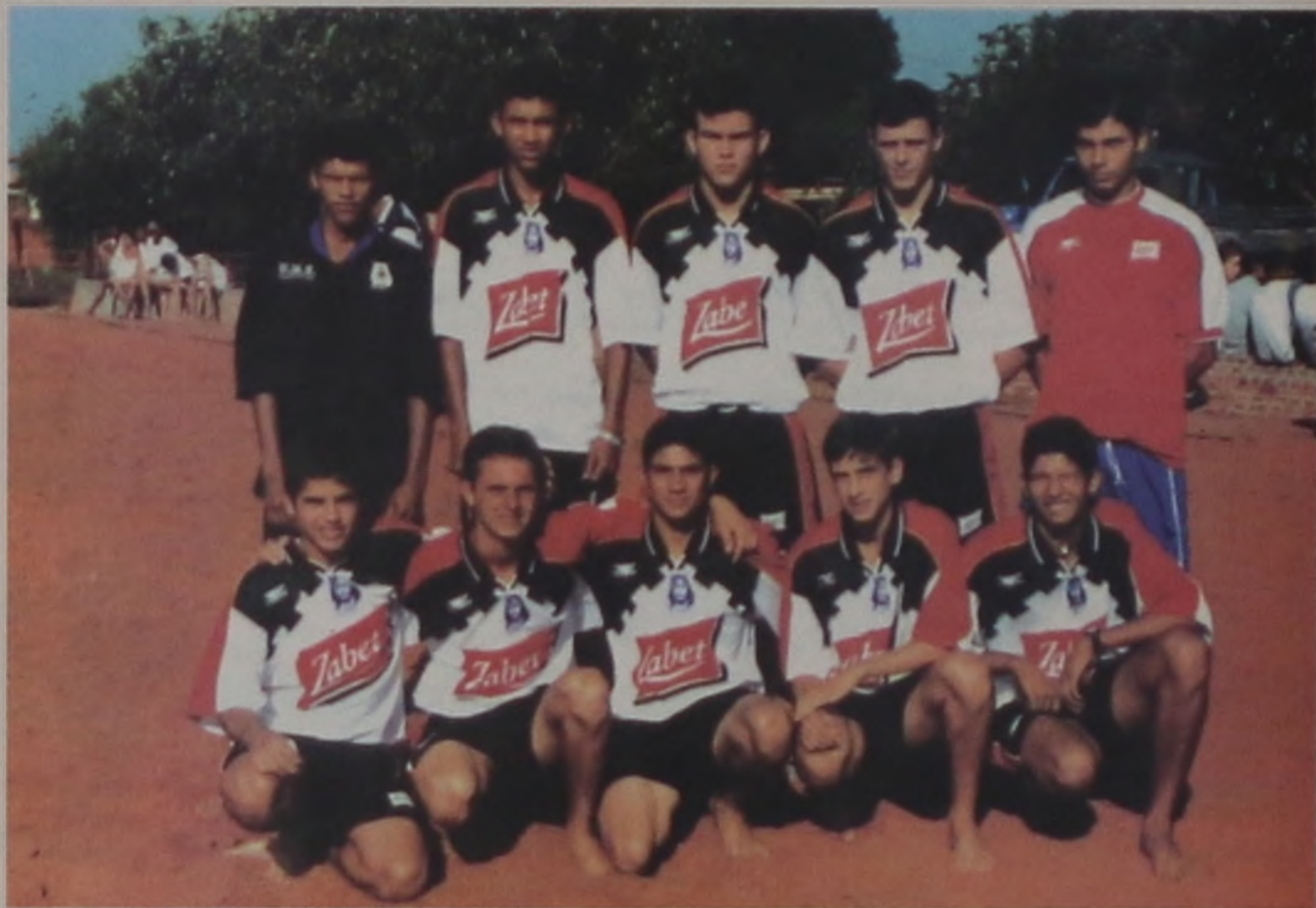
Equipe JUC (Jovens Unidos em Cristo)