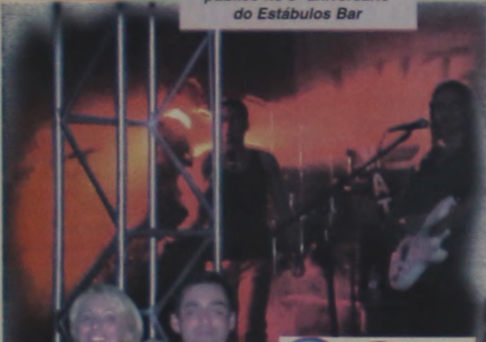
A Banda Vitrine levantou o público no 8º aniversário do Estábulo Bar

A COOPERELP - Cooperativa Educacional de Lençóis Paulista - continuará trabalhando para que seus alunos obtenham resultados tão brilhantes quanto o seu!