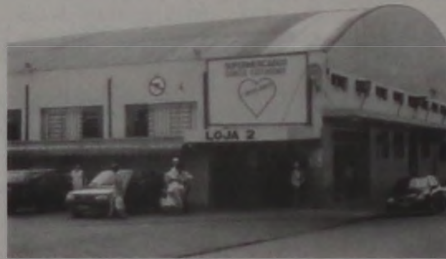
Santa Catarina, 21 anos de tradição

Como manda a tradição da rede de Supermercados Santa Catarina, há 21 anos neste mês de abril, mês de aniversário de Lençóis Paulista, realizará a grande oferta "De Lençóis para Lençóis". A promoção é uma