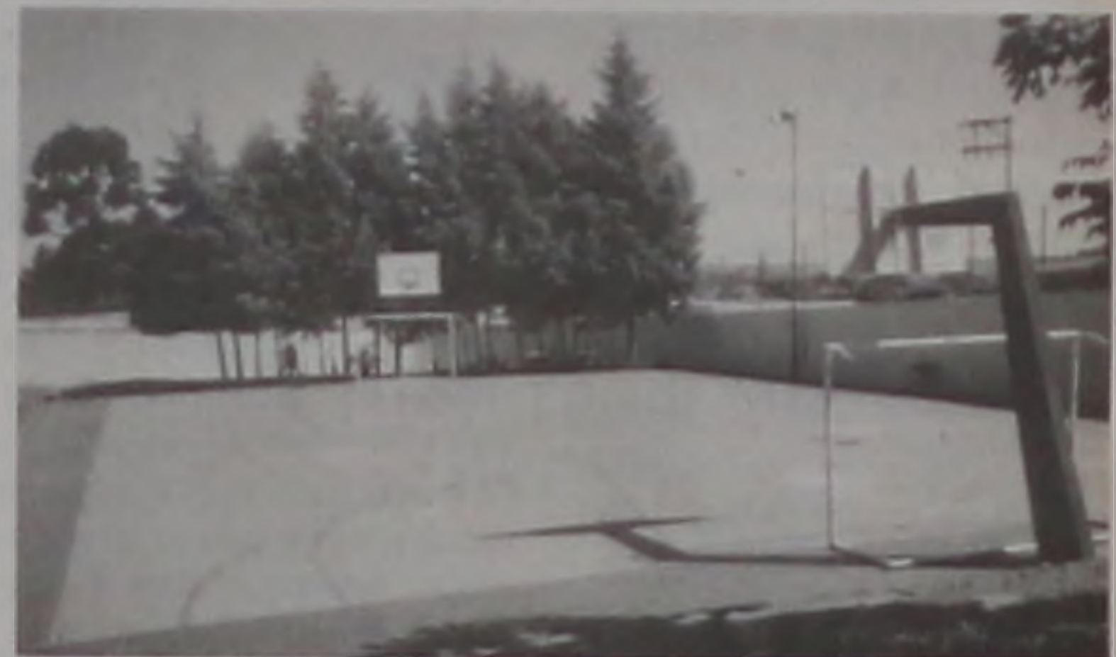
Quadra da escola Iracema Leite e Silva que em breve será coberta