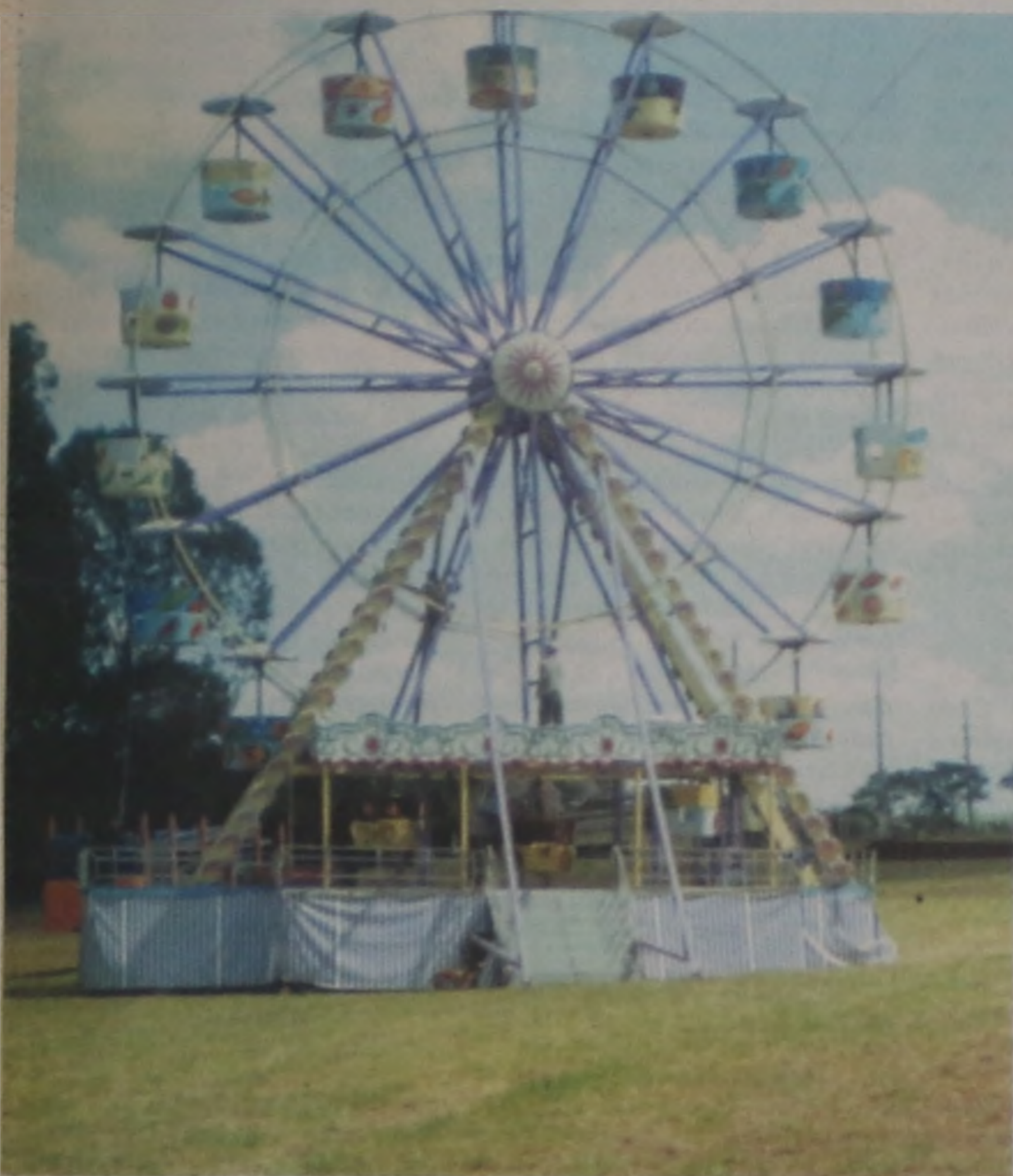
GIGANTONA: Esta será uma das atrações do Moreno's Park durante a realização da 24ª Feira Agropecuária, Comercial e Industrial de Lençóis Paulista, a Facilpa que terá início no próximo dia 27, sexta-feira. O parque, reconhecido em todo o país, vem trazendo também outras novidades para os visitantes da feira. Além da Gigantona, uma roda panorâmica (foto), o parque trará para Lençóis a Montanha Russa (Looping), vertical (zeppelin), a montanha russa infantil, o Mixer, Auto-Scooter, Crazy Dance, Orbiter, Twister, Speedway, o único na América Latina e muitas outras atrações divertidas para todas as idades.