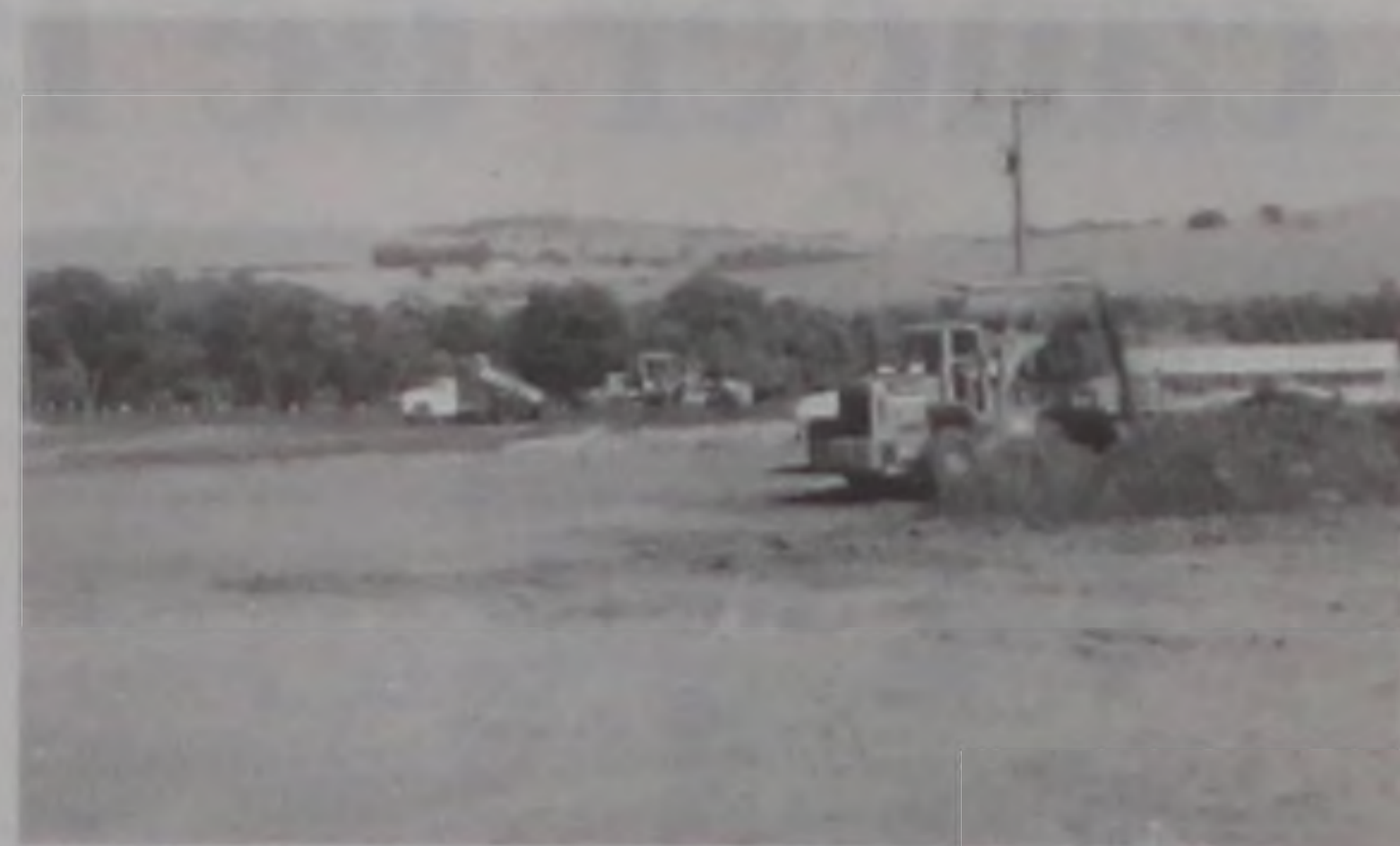
Local onde está sendo feito a terraplanagem para as serrarias