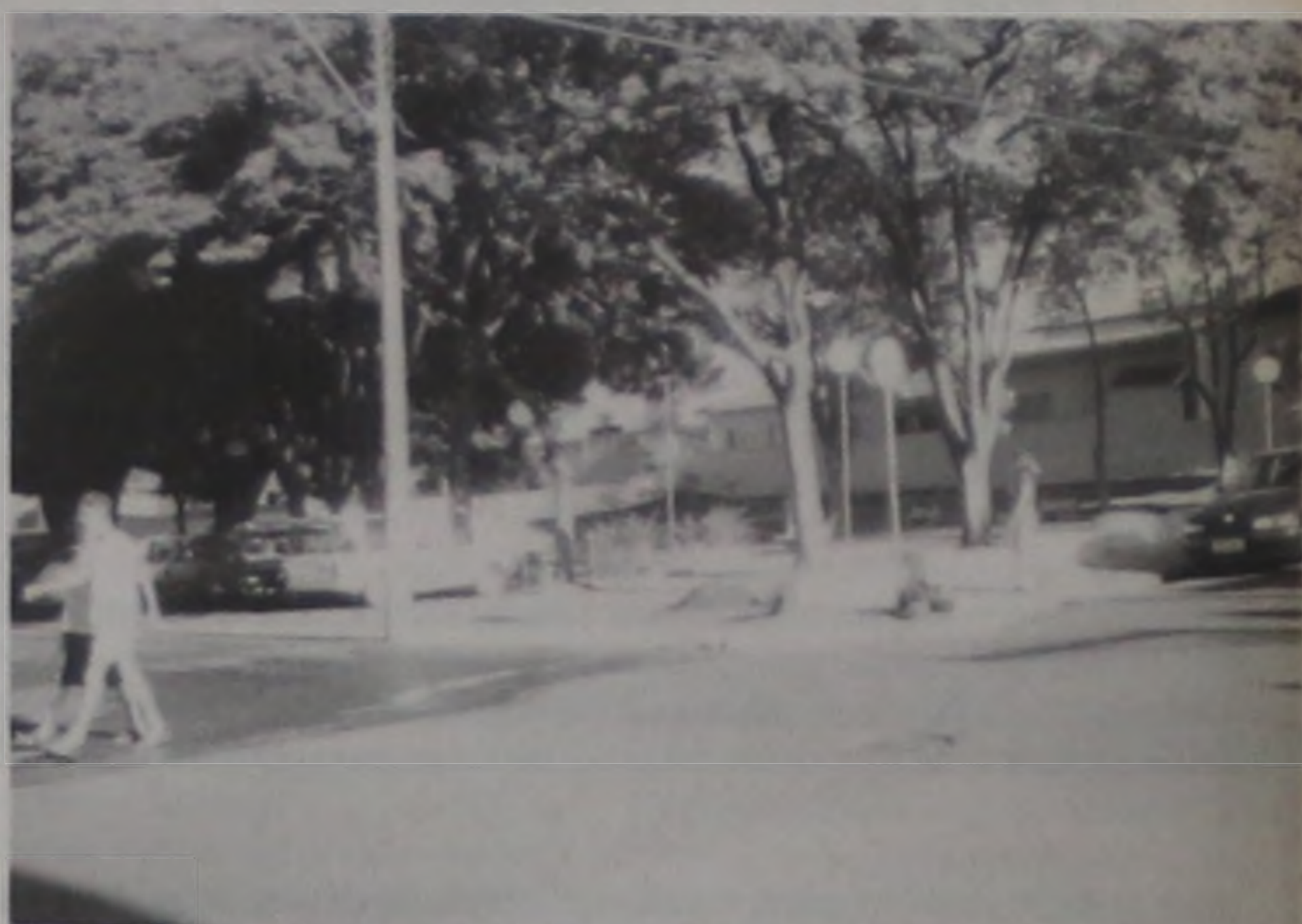
Praça Educador Paulo Freire que está passando por reformas

A partir das 17h00, a Diretoria de Cultura preparou muita música para os que por ali passarem. A primeira banda a se