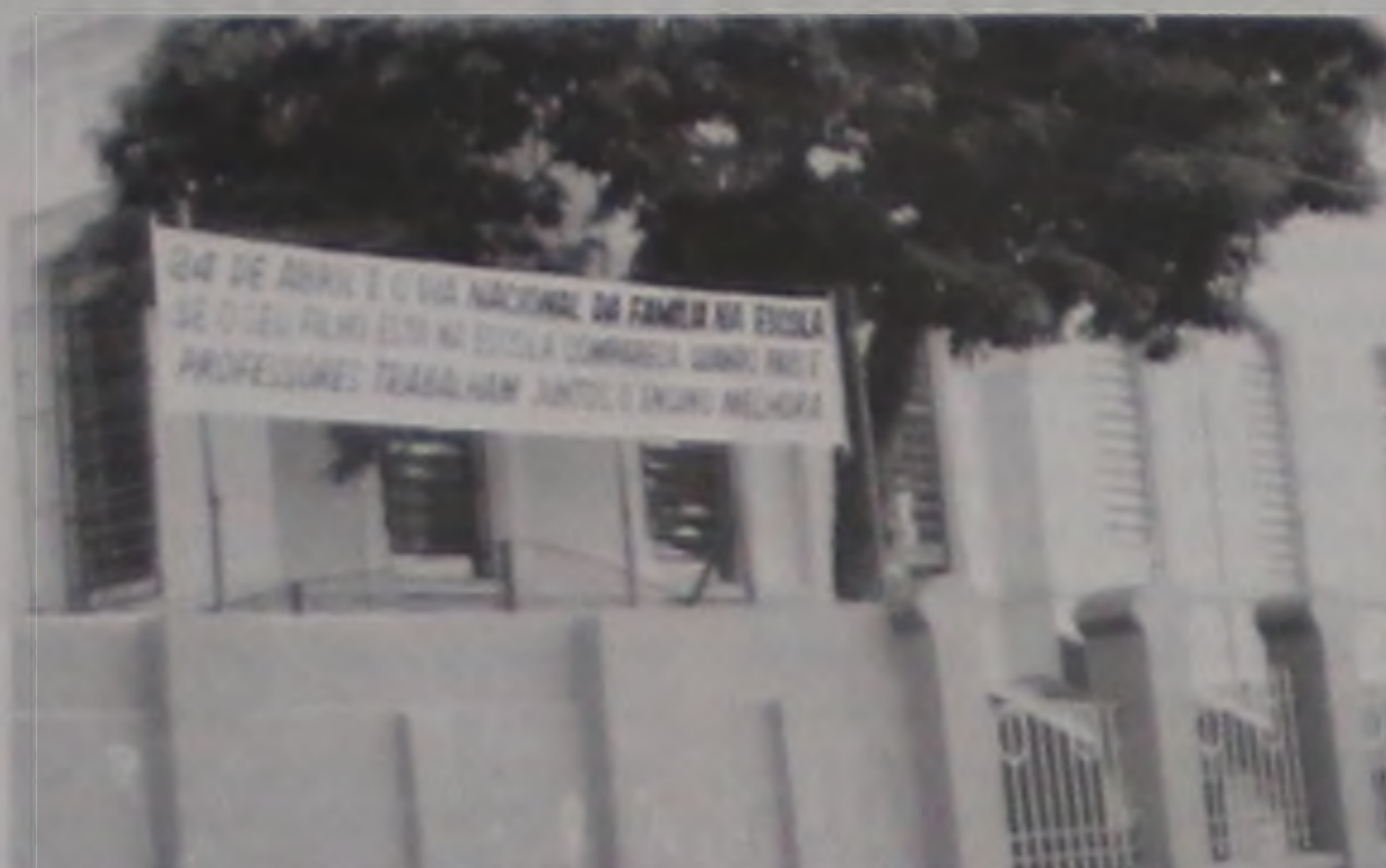
Emef Esperança de Oliveira receberá as famílias no dia 24

Pesquisa do Ibope, realizada em dezembro do ano passado, também reforça a importância da integração família-escola. A maioria dos entrevistados - 97% - mostrou-se a favor de aumentar a frequência das visitas à escola. E 93%