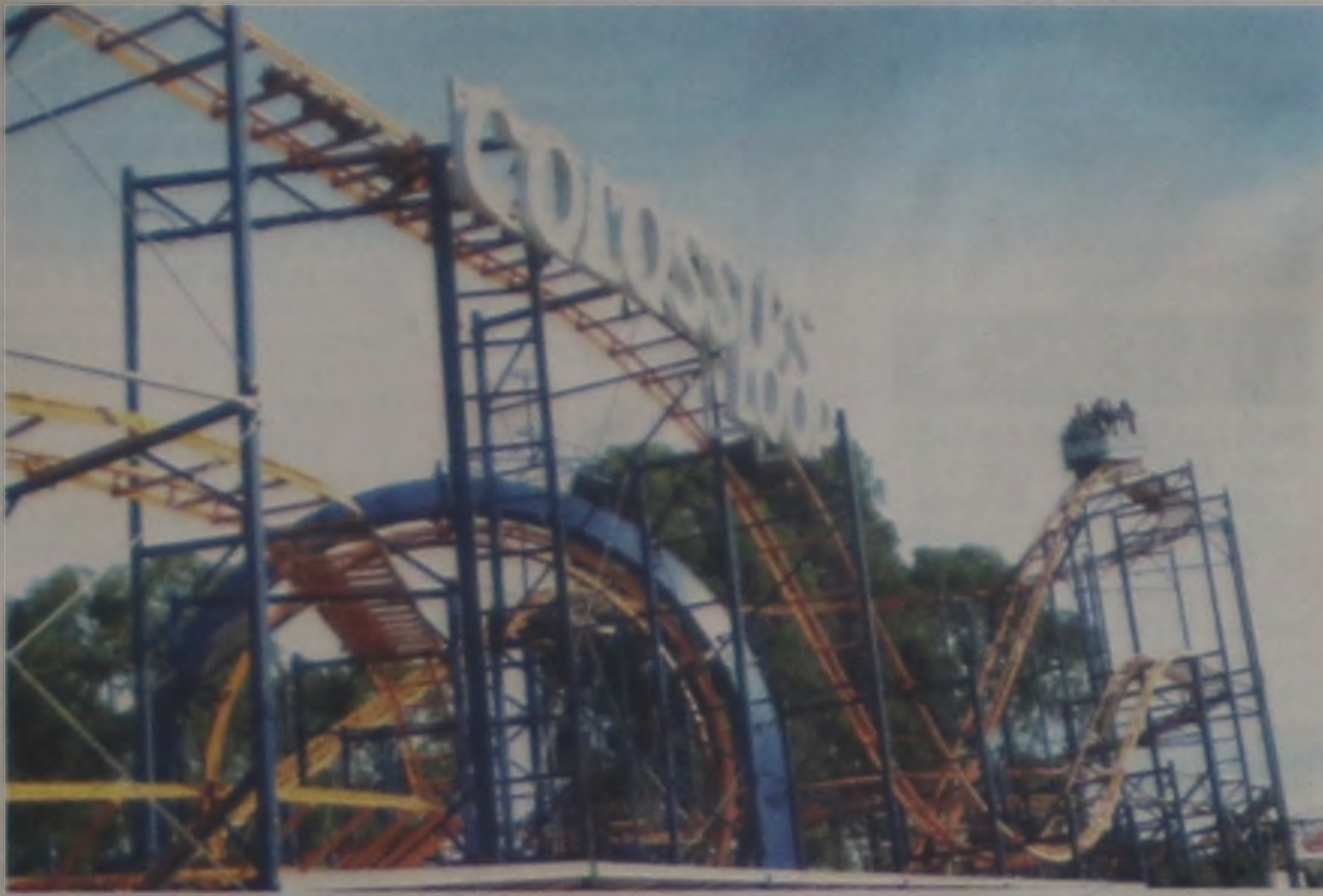
O Moreno's Park está de volta para garantir a diversão de crianças e adultos

A novidade para este ano no recinto de exposições "José Oliveira Prado" além do rodeio e shows, ficará por conta da exposição de avestruzes, pássaros vindos de São Manuel e região, peixes e cães, plantas ornamentais, orquídeas e a exposição de pequenos e médios animais da Zootecnia e Veterinária da Unesp de Botucatu.