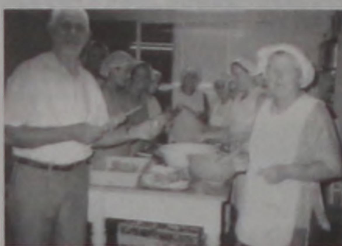
Equipe voluntária trabalhando na confecção de salgado