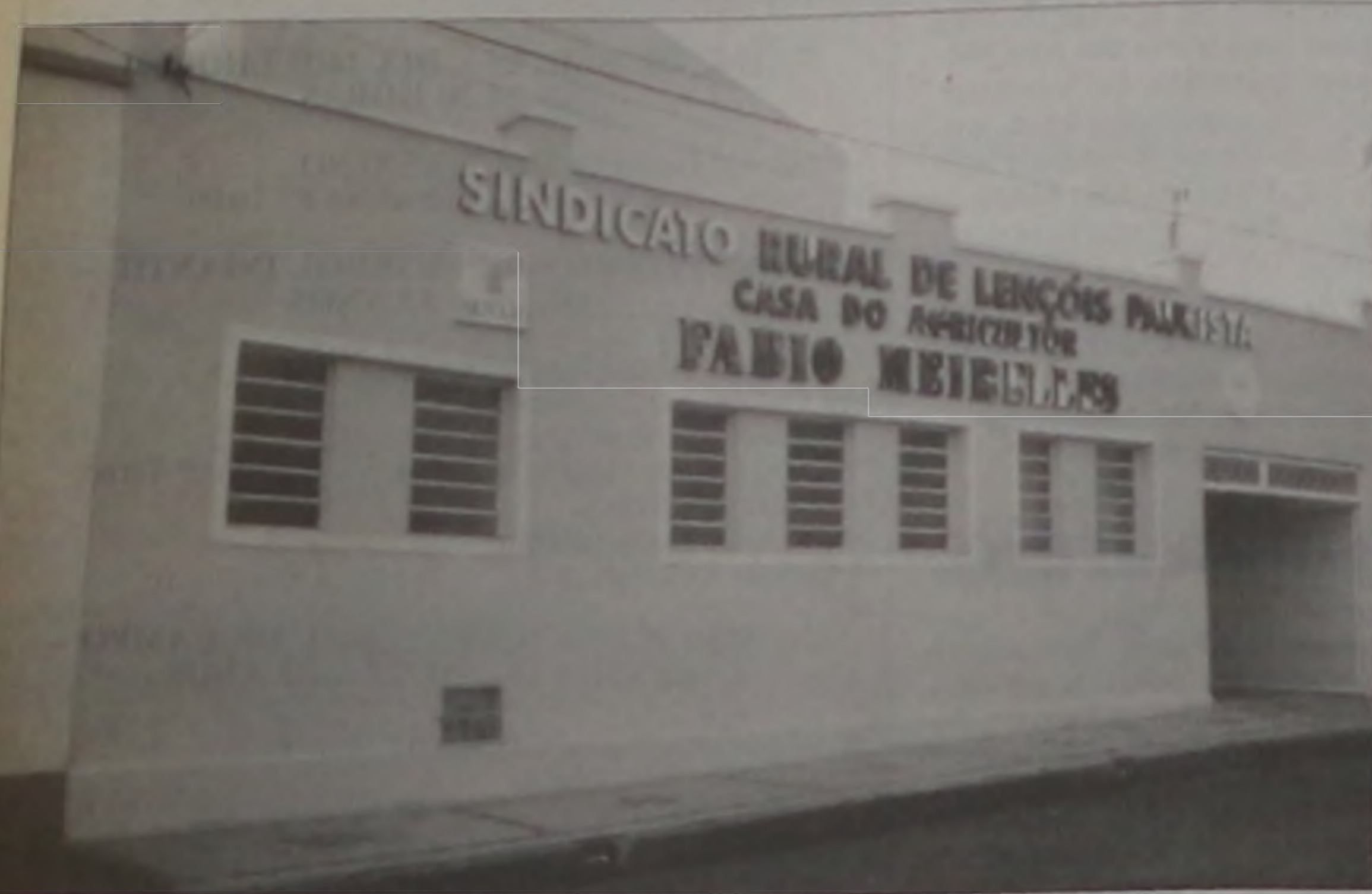
Sede do Sindicato Rural, à rua Coronel Joaquim Gabriel, 35 - Centro

O Sindicato Rural de Lençóis Paulista localizado à rua Coronel Joaquim Gabriel, 35, centro da cidade, inaugurou ontem suas novas instalações. A inauguração contou com a pre-