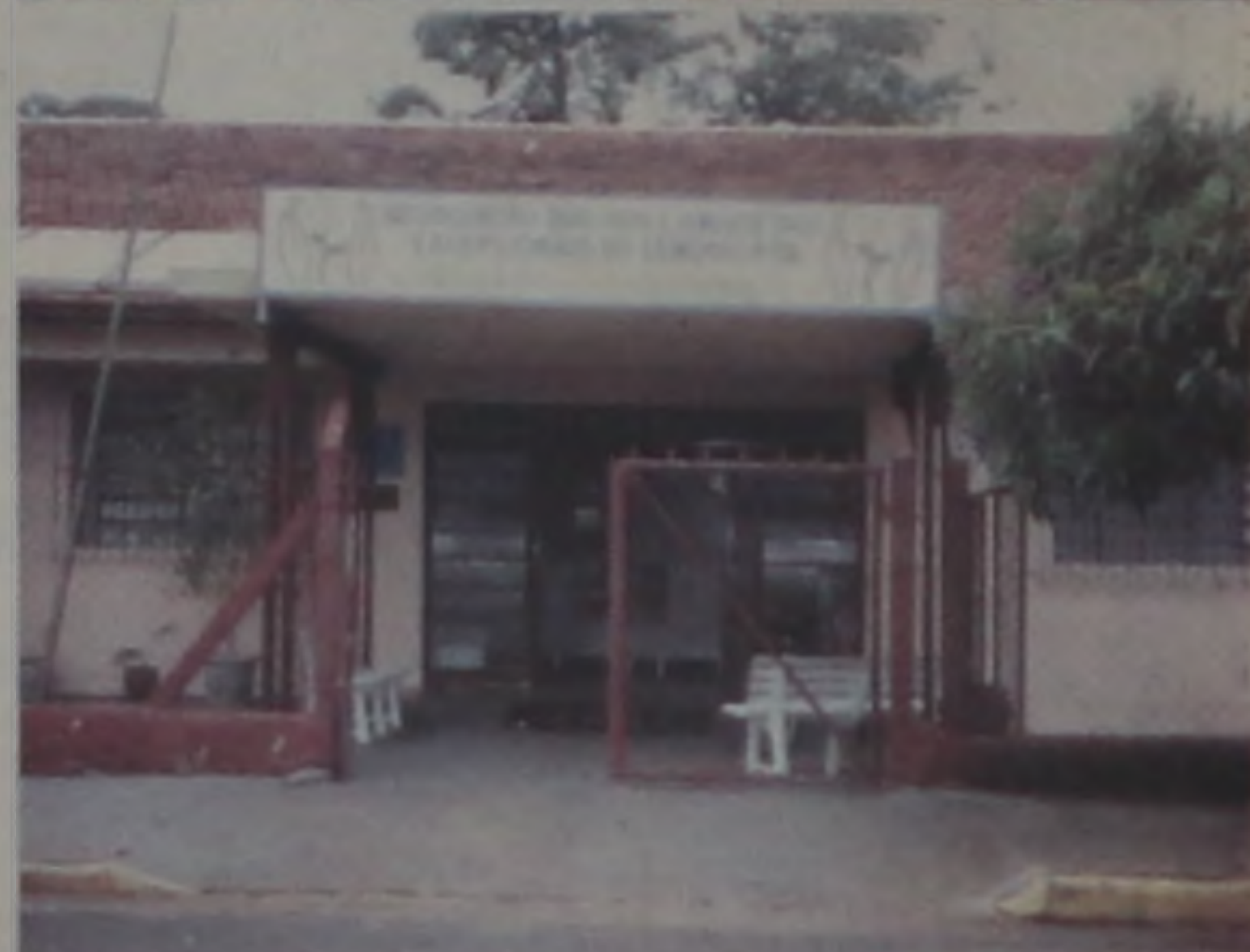
Entidade atende mais de 160 alunos

da cidade. São recebidos com café da manhã, depois sala de aula. É oferecido um almoço que é preparado no próprio local e fornecido pela cozinha piloto da prefeitura municipal. Após a refeição, os alunos vão para casa. No período da tarde, outra turma chega e o esquema se repete.