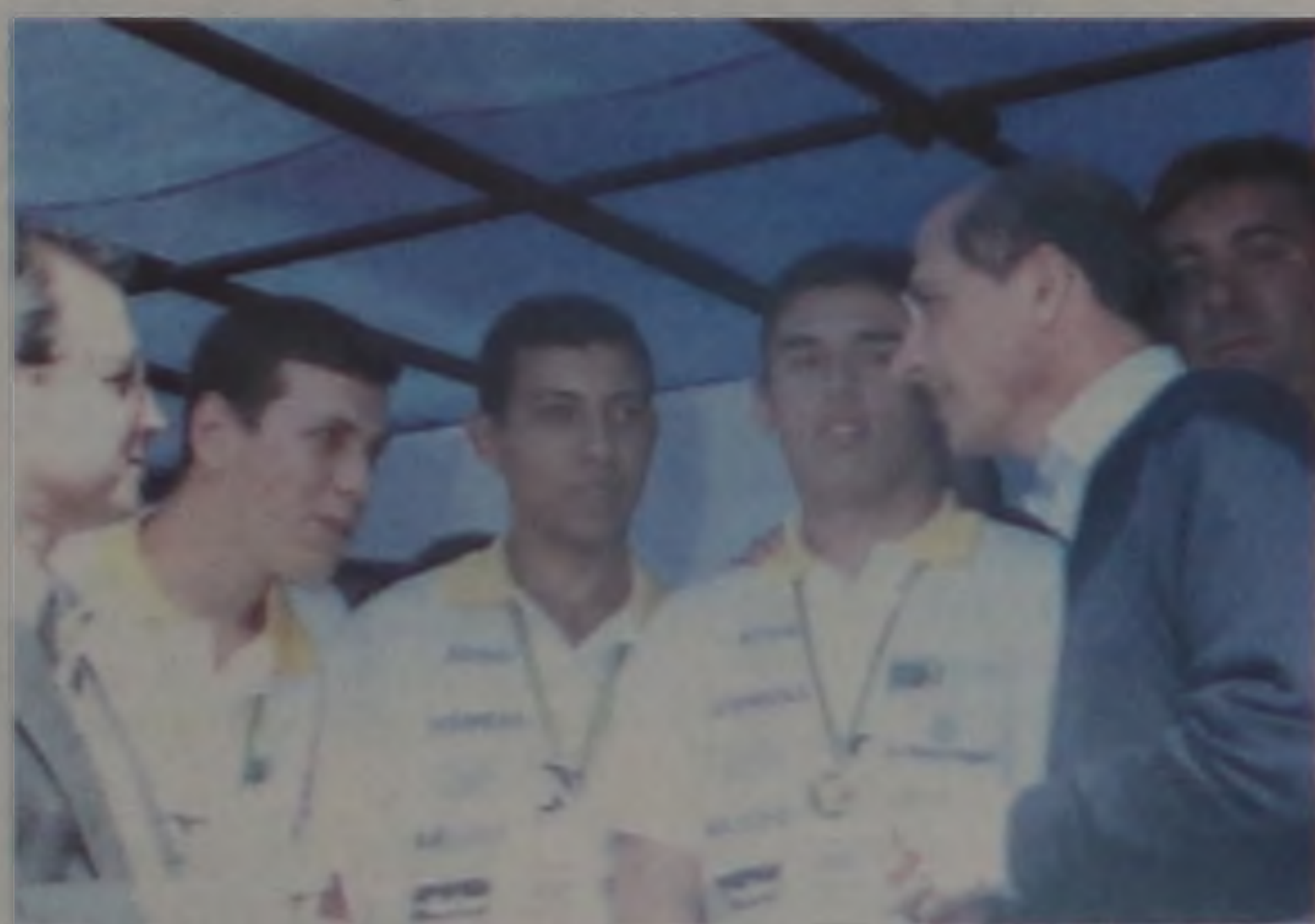
Atletas olímpicos em homenagem ao governador