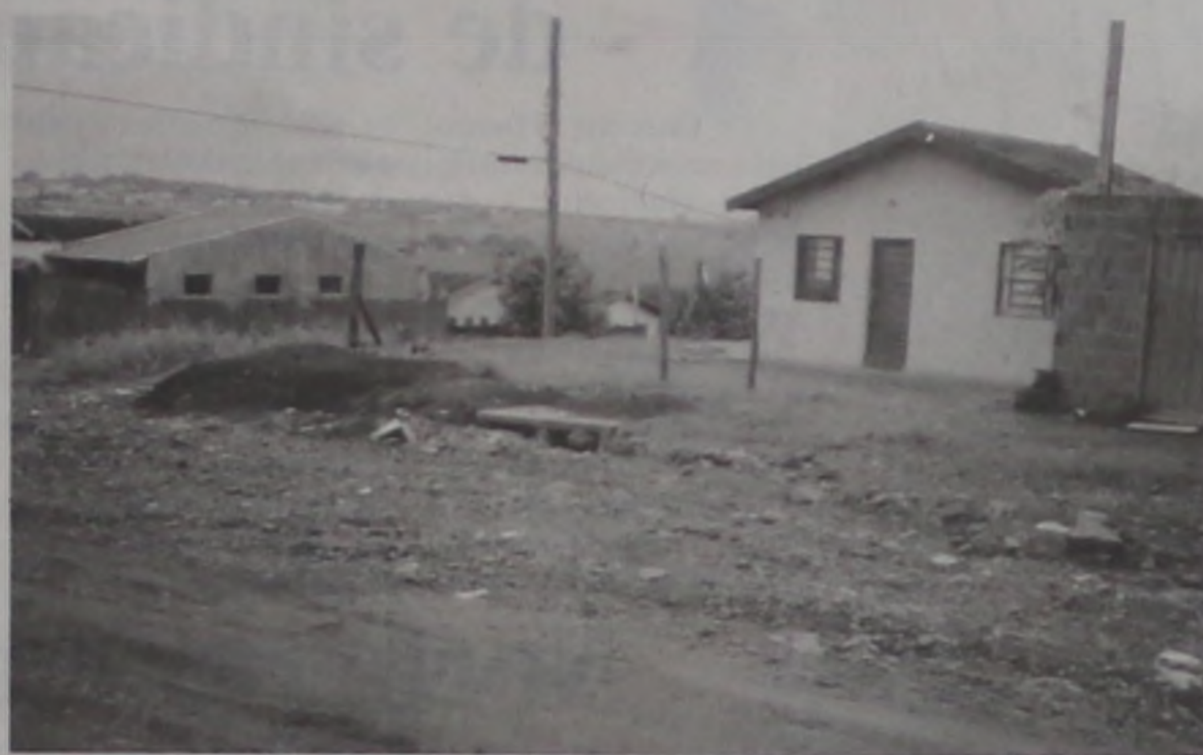
Bairro receberá guias, sarjetas e pavimentação

Os vereadores tucanos conseguiram também na última semana, durante visita a São Paulo, a confirmação de uma verba de R$ 100 mil para a pavimentação do bairro Maestro Júlio Ferrari, através do deputado estadual Pedro Tobias (PSDB) e do