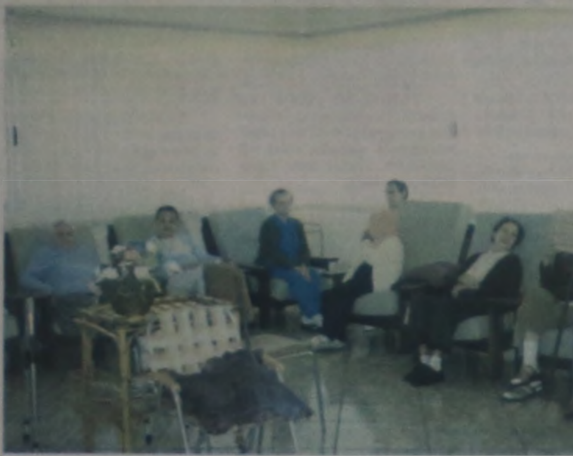
Refetório do Asilo e ao lado momento de descanso no salão interno

Com poucas verbas e com a diminuição das doações, o asilo se viu obrigado a realizar eventos para con-