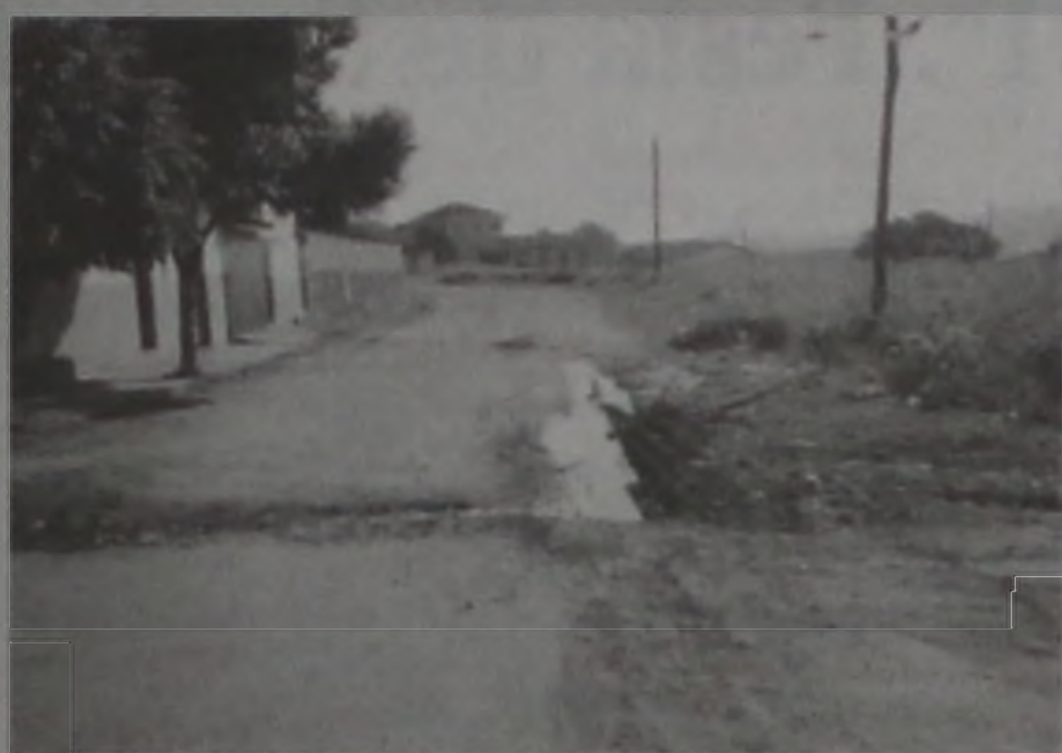
Parte da rua Uruguai sem asfalto

Os moradores que residem na rua Uruguai, nas proximidades da rua Santa Catarina, na Vila Cruzeiro andam se queixando do péssimo estado de conservação das ruas. Com trechos tomados por buracos e sem condições de tráfego, tanto pedestres como motoristas com seus veículos se vêem impossibilitados de percorrer as ruas. Como se não bastassem os buracos, os moradores se vêem rodeados com poças de água em vários pontos.