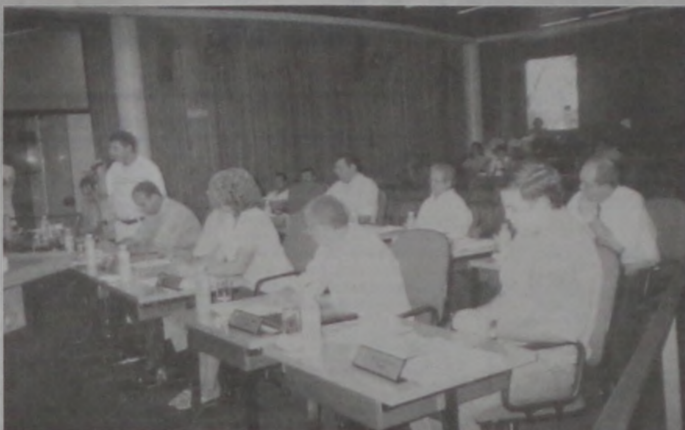
Vereadores durante votação do veto