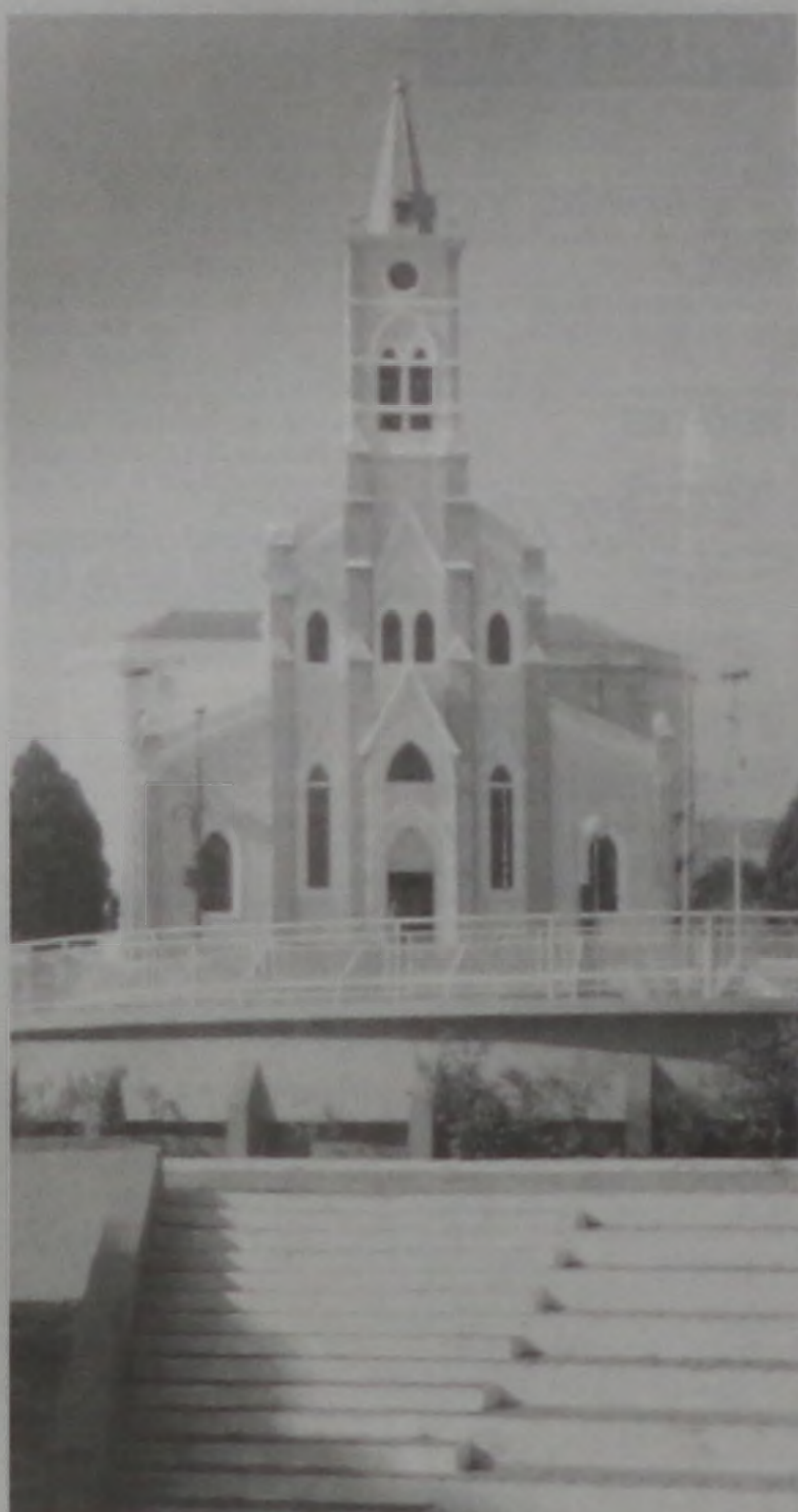
Santuário Nossa Senhora da Piedade