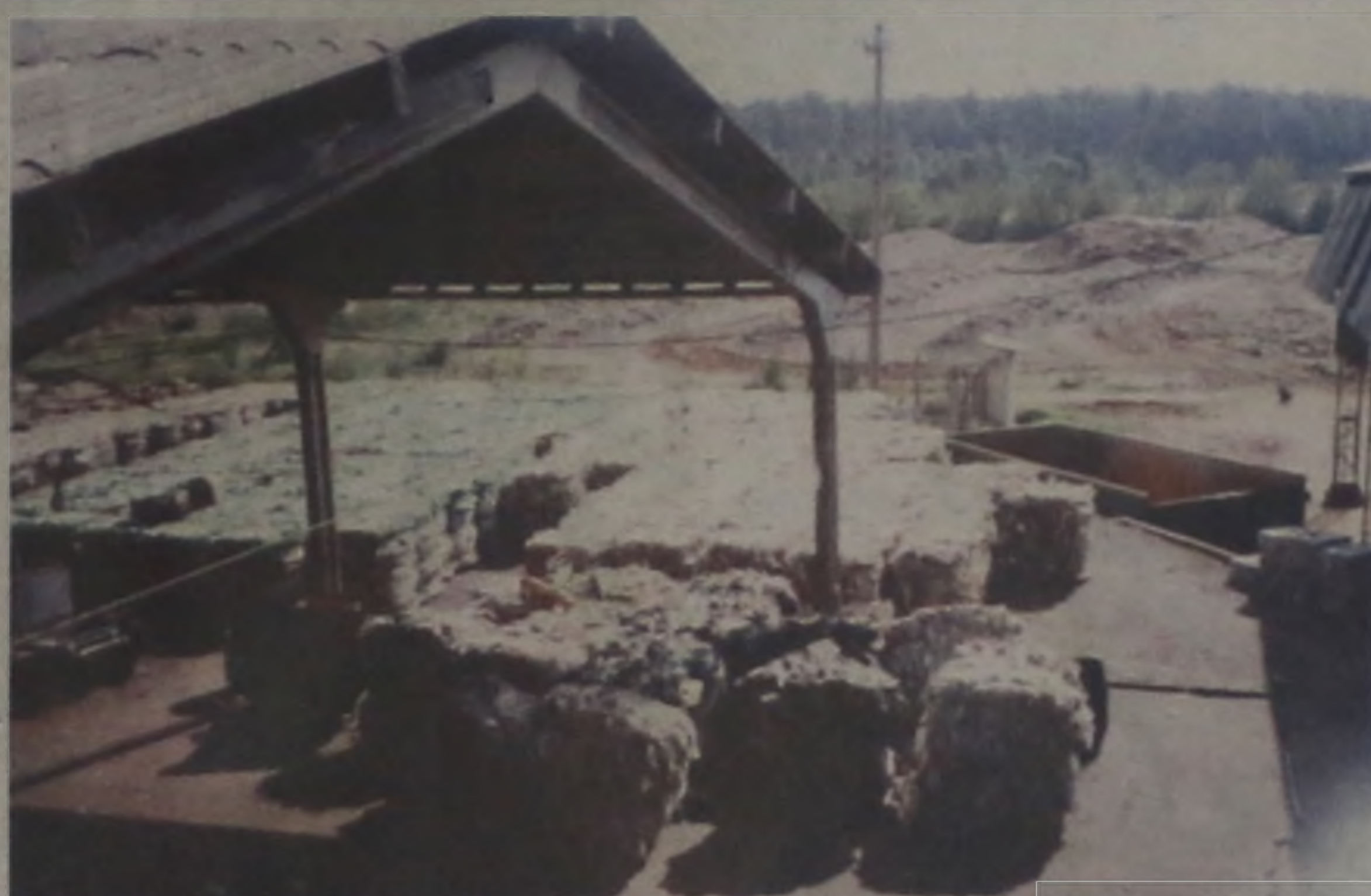
A justificativa para criação da taxa está na necessidade de melhorar a coleta, o processamento e a destinação final do lixo urbano.