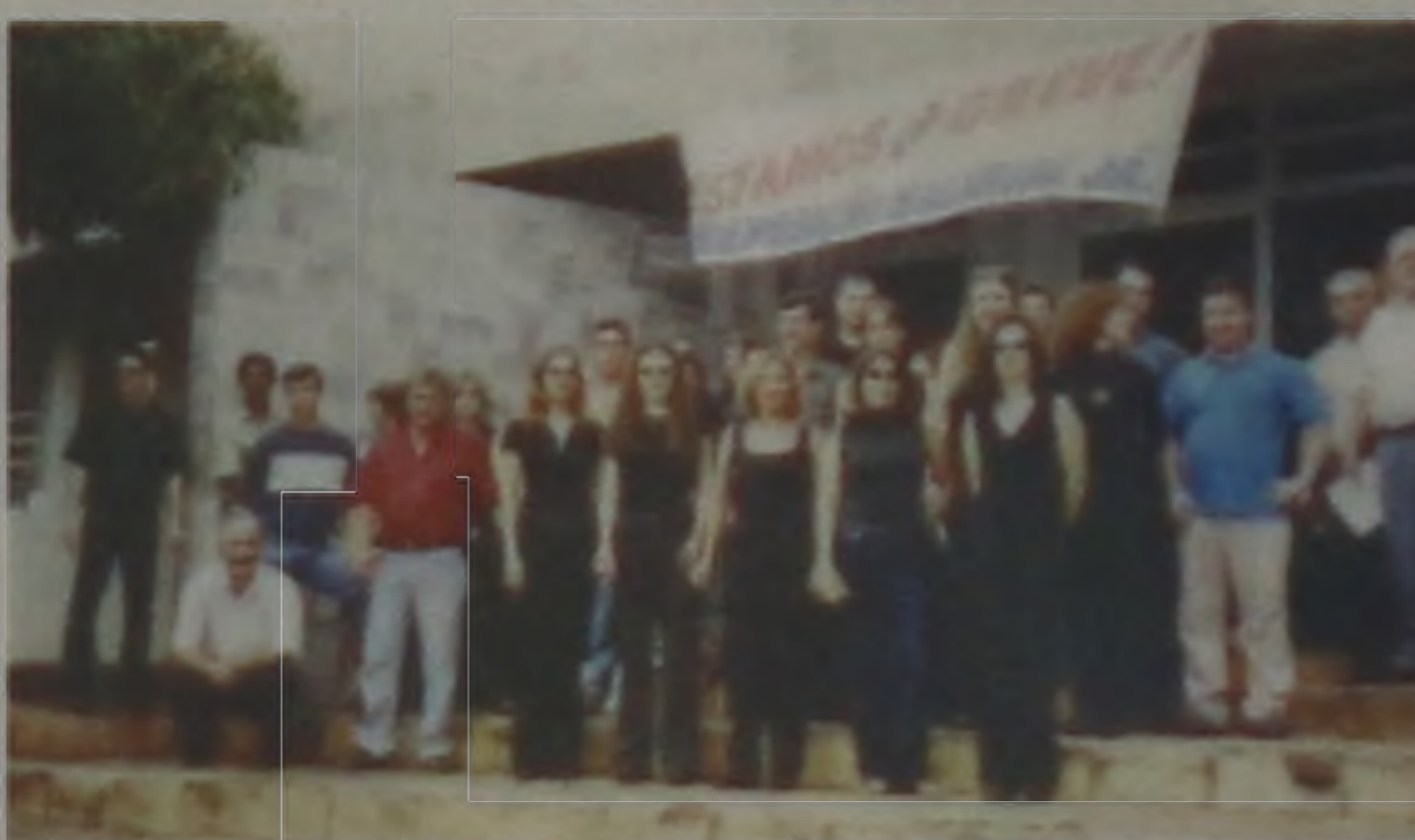
Grevistas deverão retornar ao serviço na terça-feira

Os funcionários da Justiça Estadual vão trabalhar em sistema de mutirão, das 8 às 19 horas, a partir de segunda-feira, quando voltam ao trabalho. O período das 12 às 16 horas será dedicado ao atendimento ao público. Nos outros períodos os funcionários tomarão as providências necessárias para o andamento dos processos. Entre as prioridades estão os processos criminais, já que os acusados