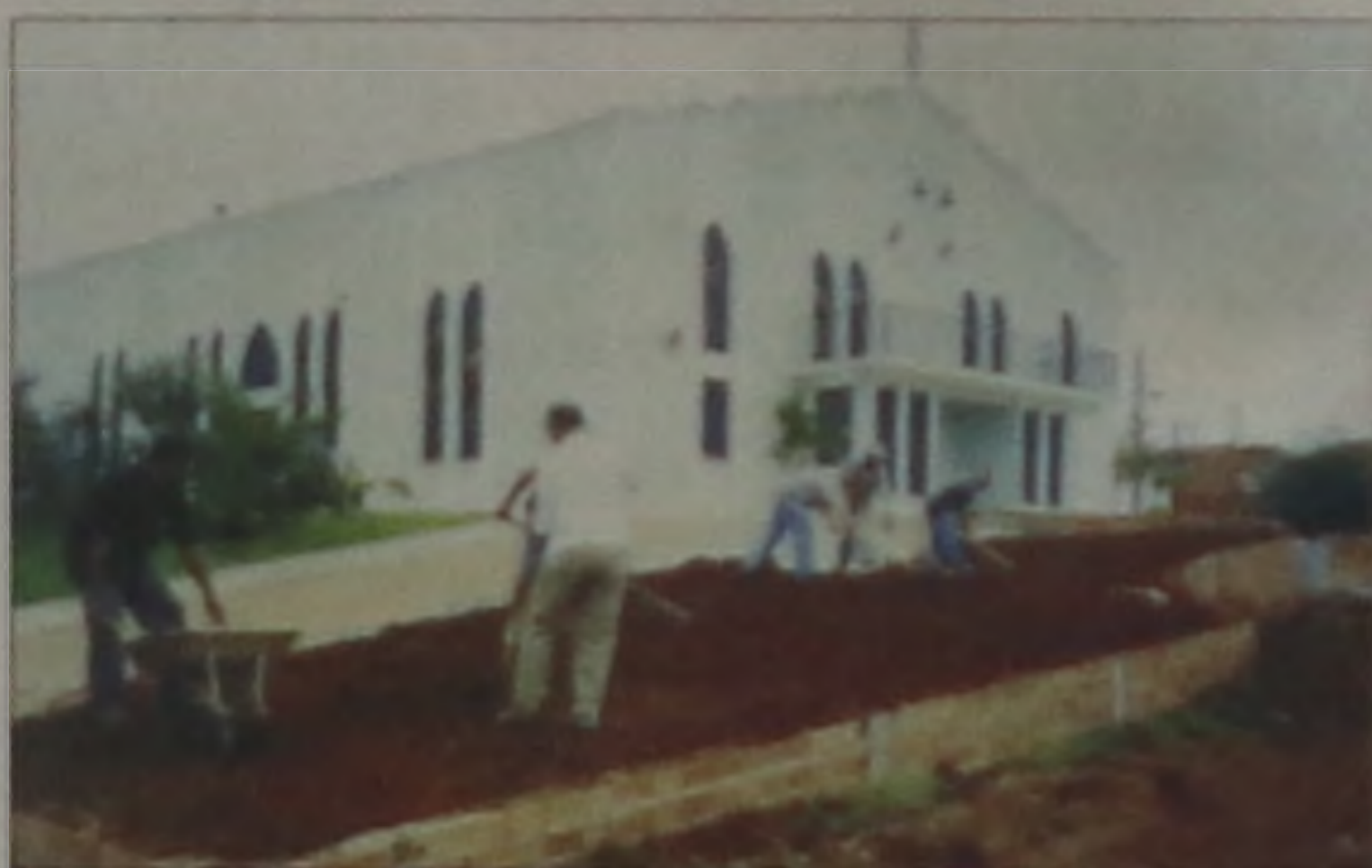
Paróquia Cristo Ressuscitado na Cecap

Este trabalho envolveu toda a Pastoral Familiar da paróquia nas visitas aos casais, preparação das reuniões, levantamento da documentação para o processo matrimonial e preparação da cerimônia. Mas ao final, a alegria é grande por mais um trabalho realizado.