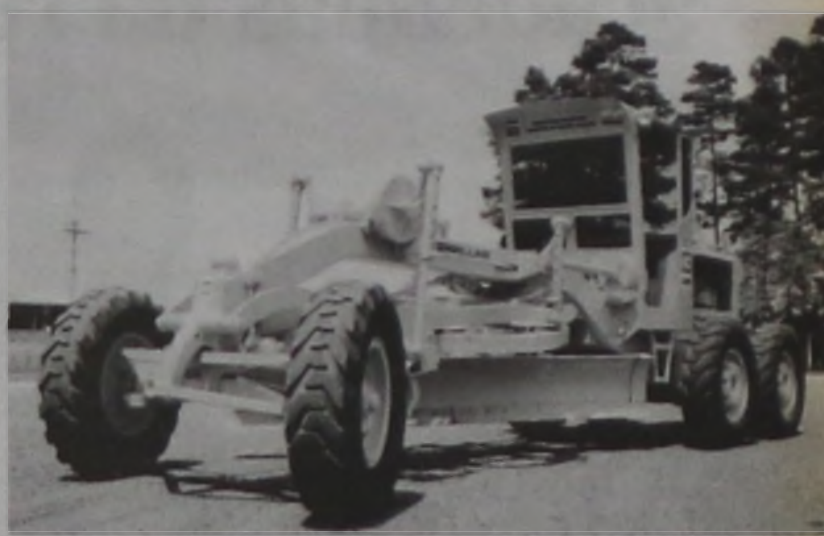
A motoniveladora será utilizada para conservação e construção de estradas não pavimentadas

Segundo informações do supervisor de Apoio e Motomecanização da municipalidade, José Alberto Paschoarelli, a motoniveladora é um equipamento utilizado para construção e conservação de estradas, serviços de aterro, terraplenagem e