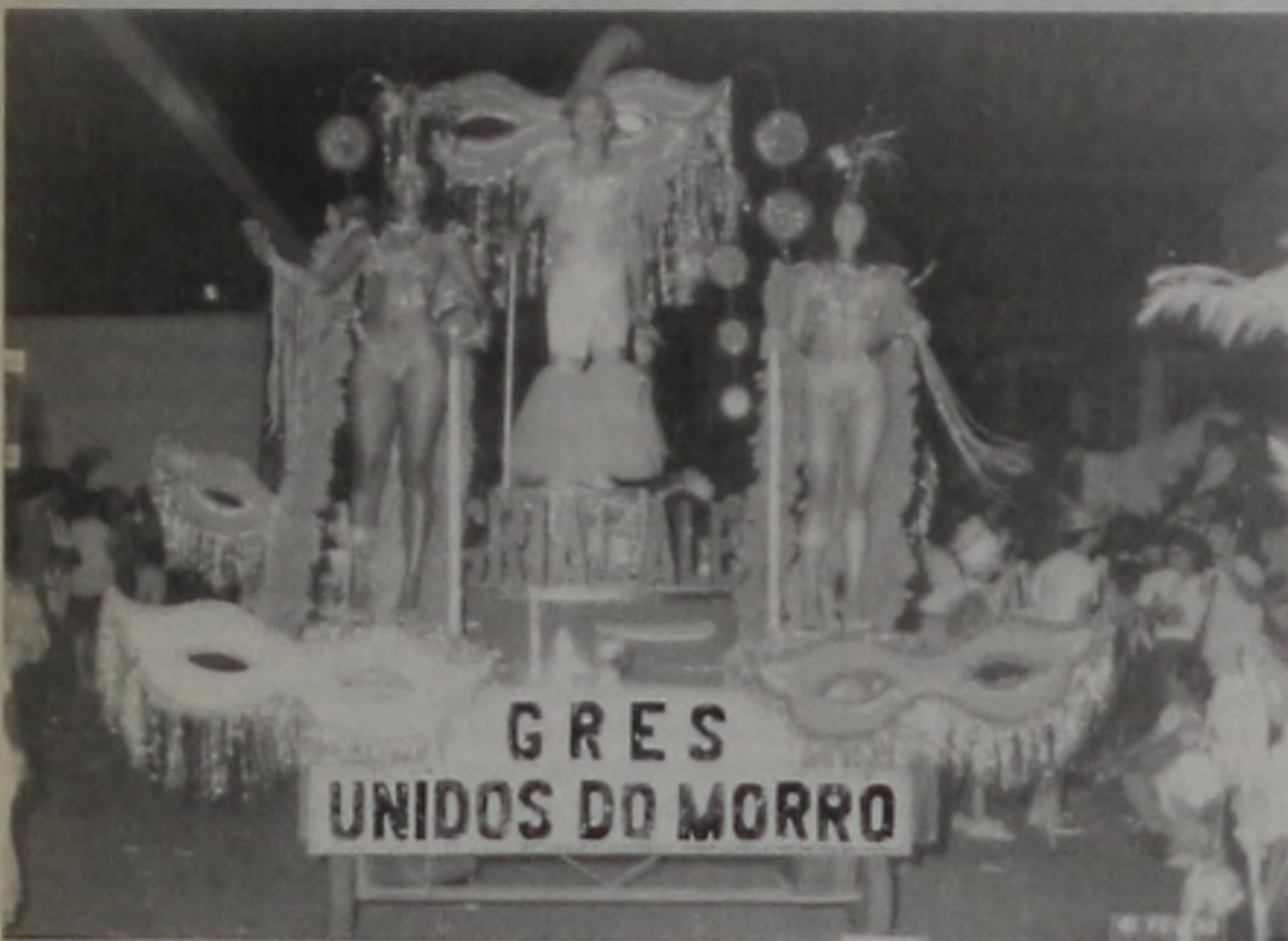
Em 2002 não haverá desfile de Escolas de Samba

O carnaval deste ano poderá jogar confetes aos antigos bailes carnavalescos de salão. Com uma proposta de mudar alguma coisa, a Diretoria de Cultura pretende revitalizar os bailes carnavalescos, tirando os blocos e foliões das ruas.