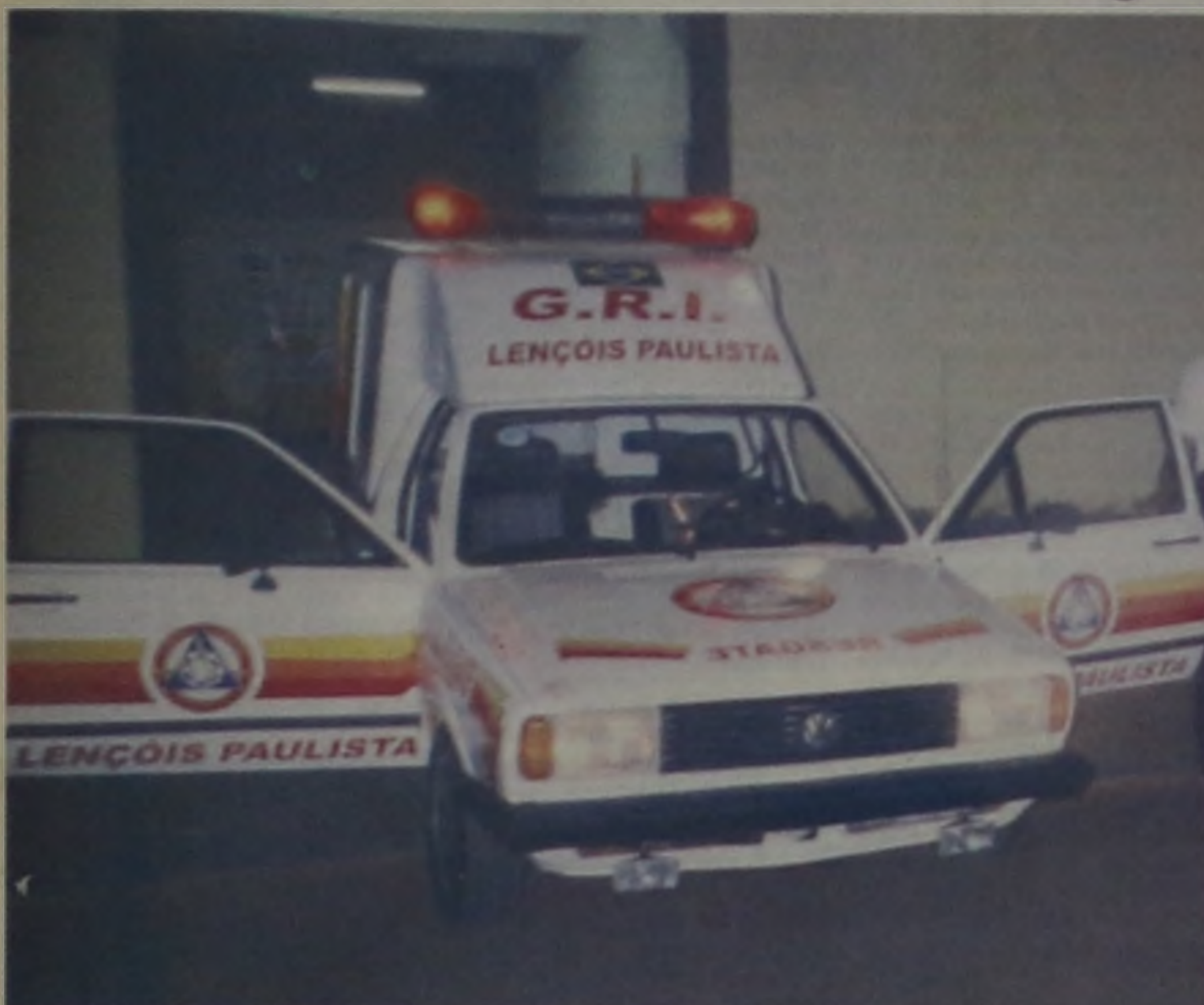
O novo endereço do GRI fica na rua Lafaete Muller Leal, jd América, antigo prédio da Aprev

O Grupo de Resgate Integrado de Lençóis Paulista (GRI) está com os seus trabalhos em novo endereço. O grupo está atendendo na rua Lafaete Muller Leal, no jd. América, antigo prédio da Aprev.