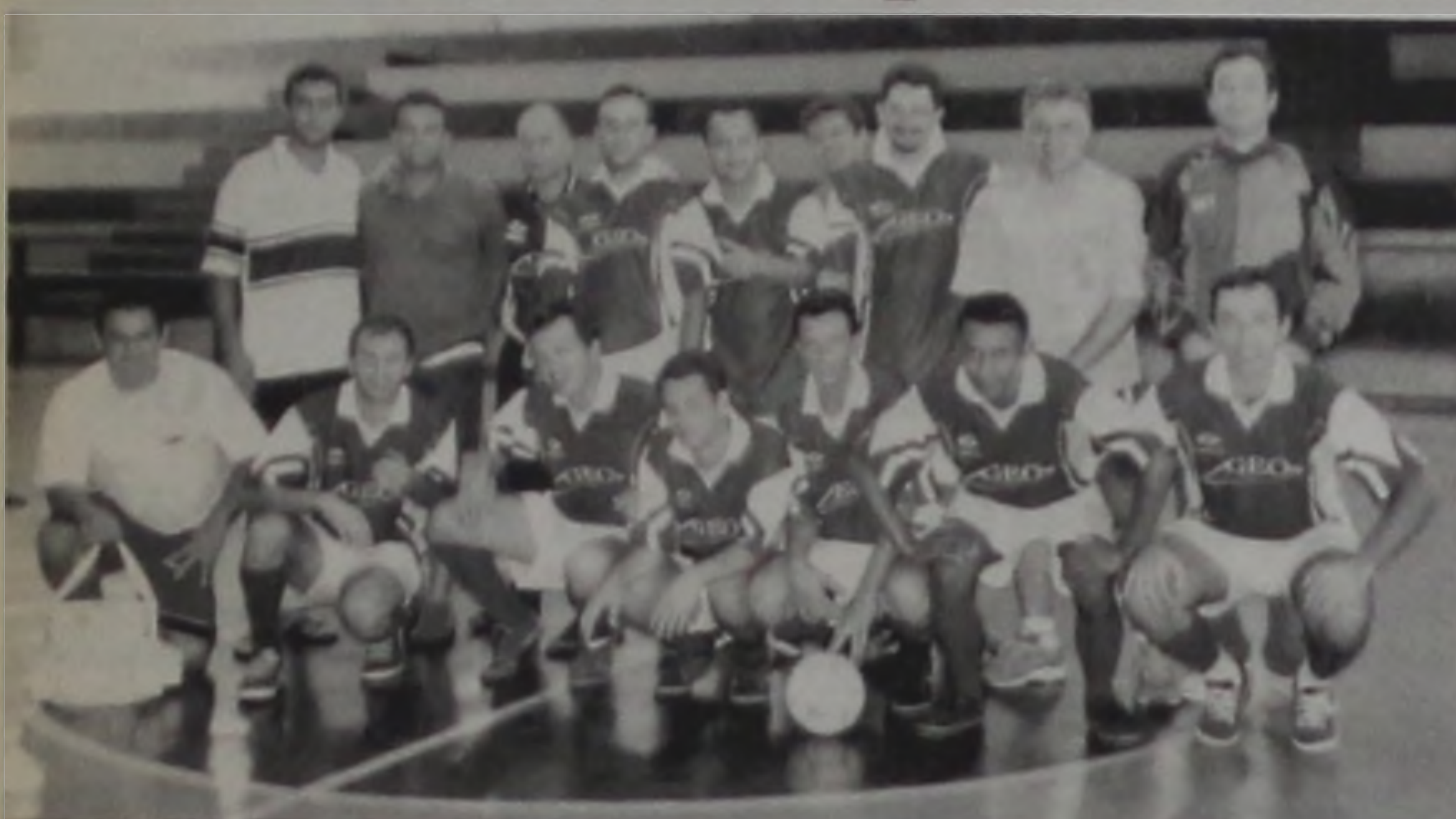
Jogadores e comissão técnica do Grêmio Omitex