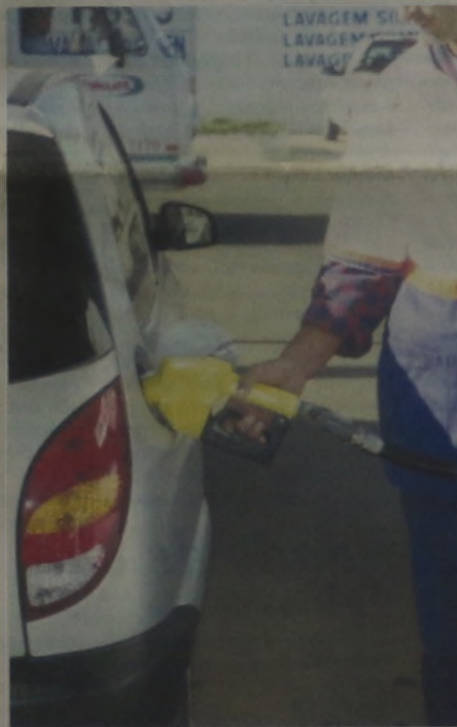
Preço da gasolina baixou entre 8 e 12%

O presidente Fernando Henrique Cardoso reuniu-se na quinta-feira com os ministros de Minas e Energia e da Casa Civil e com o diretor da Agência Nacional do Petróleo, para adotar medidas que façam o preço da gasolina nos postos cair 20%, conforme o previsto.