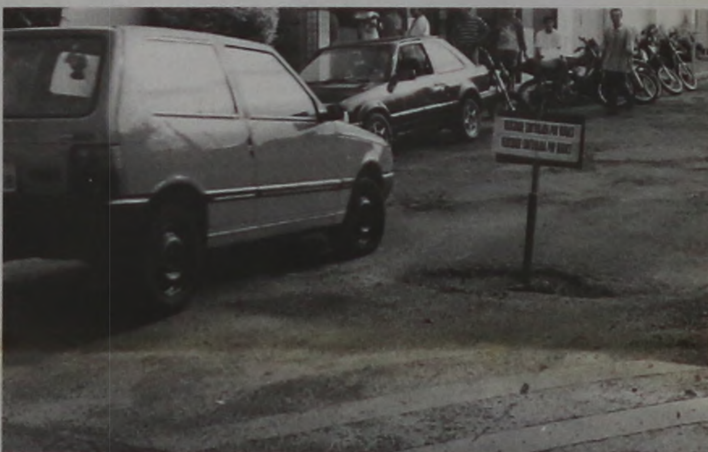
A placa alerta os motoristas: Velocidade controlada por buracos

A manutenção deveria ser a preocupação primeira dos administradores públicos. Antes de obras novas ou de contratação com terceiros, deveriam ser tapados os buracos das vias públicas, reformados os prédios e bem tratadas as coisas já existentes.