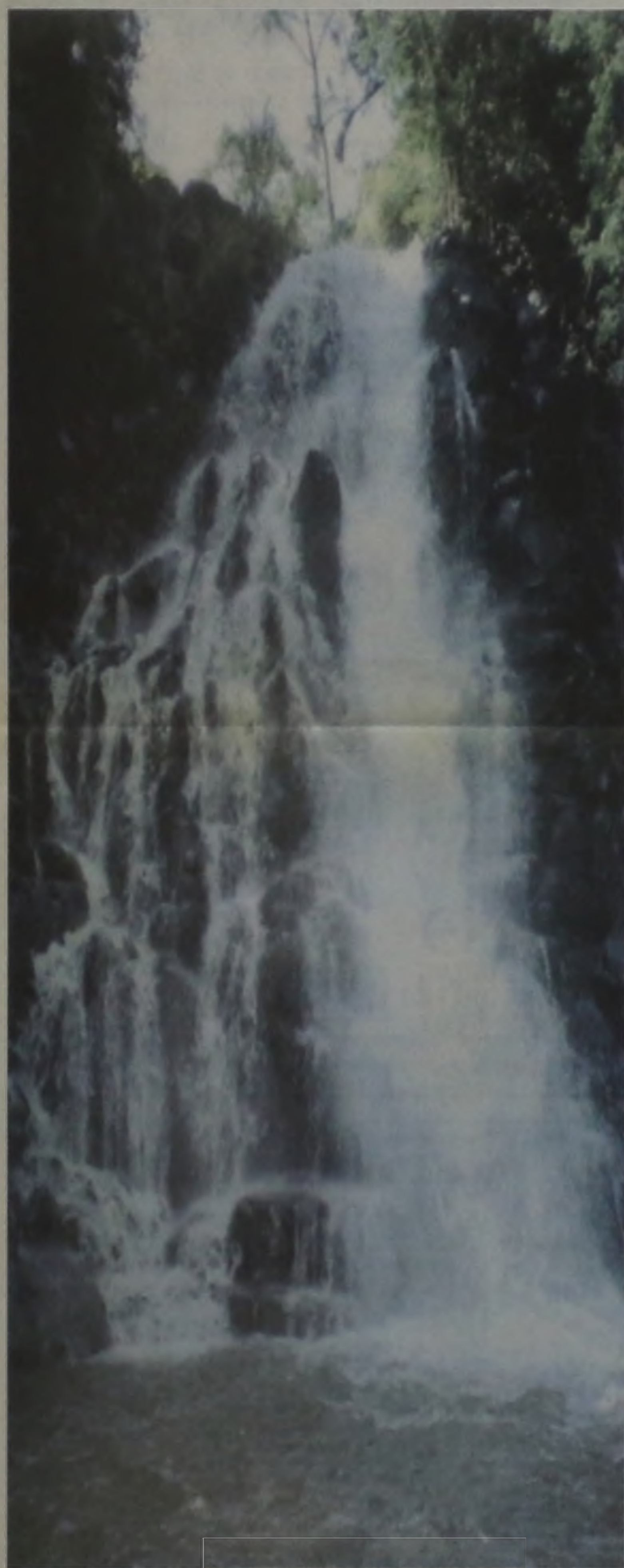
Neste século, por causa da escassez a água valerá ouro

Darwin. "Mais de um século atrás ele especulou em cartas pessoais que a origem da vida estava em algum pequeno lago com vários tipos de sais de amônia e fosfóricos, luz, calor, eletricidade etc.". Londres (Reuters)