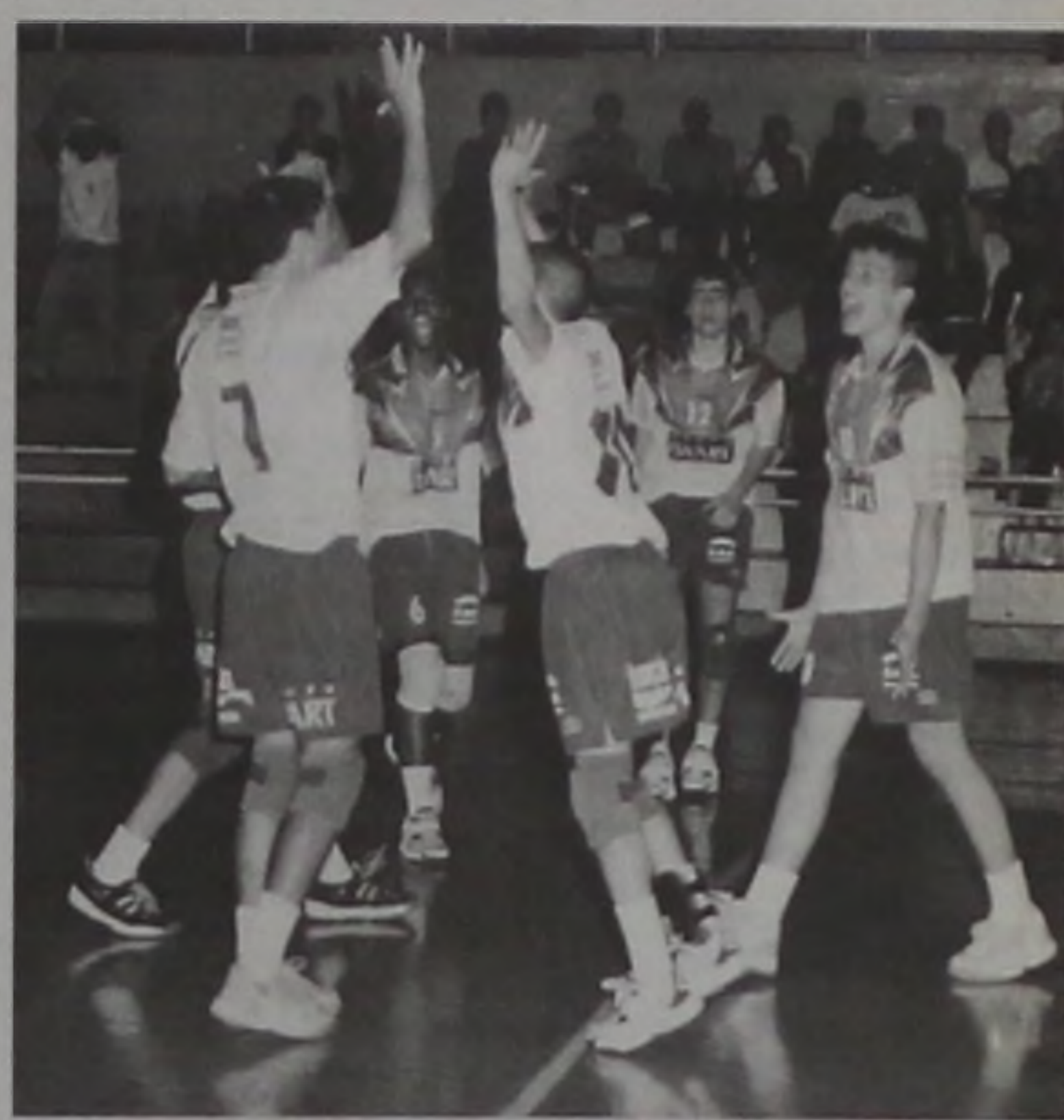
Jogadores comemoram a classificação

O time infantil (até 16 anos) também joga neste domingo, às 10h, no CSEC contra a equipe de Jaboticabal em partida que vale classificação. Se o time lençoense conquistar a vitória, obterá a classificação para a segunda-fase do Campeonato Estadual jun-