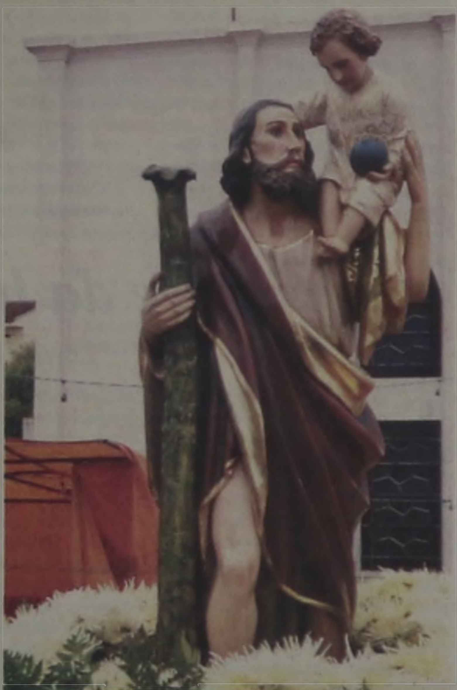
A imagem de São Cristóvão, patrono dos motoristas, é louvada pelos fiéis da Igreja Cristo Ressuscitado