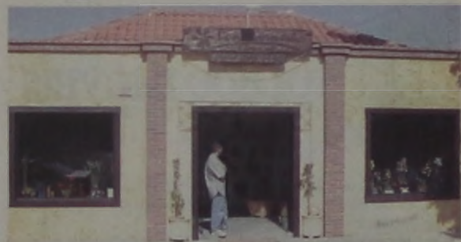
"O melhor motivo para não mandar flores é não ter motivos. Lanacarminha tem as flores para qualquer motivo"

Não existe um bom dia melhor que o sol raiando na janela e um buquê de flores. Não existe motivo para mandar flores, existe bom senso. Apaixonados ou não, dias dos Pais, das Mães, dos Namorados, qualquer dia, é motivo. Até sem motivos, sabe-se lá, dizem que pessoas conversam com plantas, eis aí um bom motivo para um diálogo. Para manter uma boa conversa, mande flores, que tal as lindas orquídeas ou flores do campo. Flores em geral, vasos de plantas, florais, incensos, Ikebanas, velas, cestas de café etc; até motivos religiosos, com fé. Se você ligar no 263-4600 ou passar na Lanacarminha Flo-