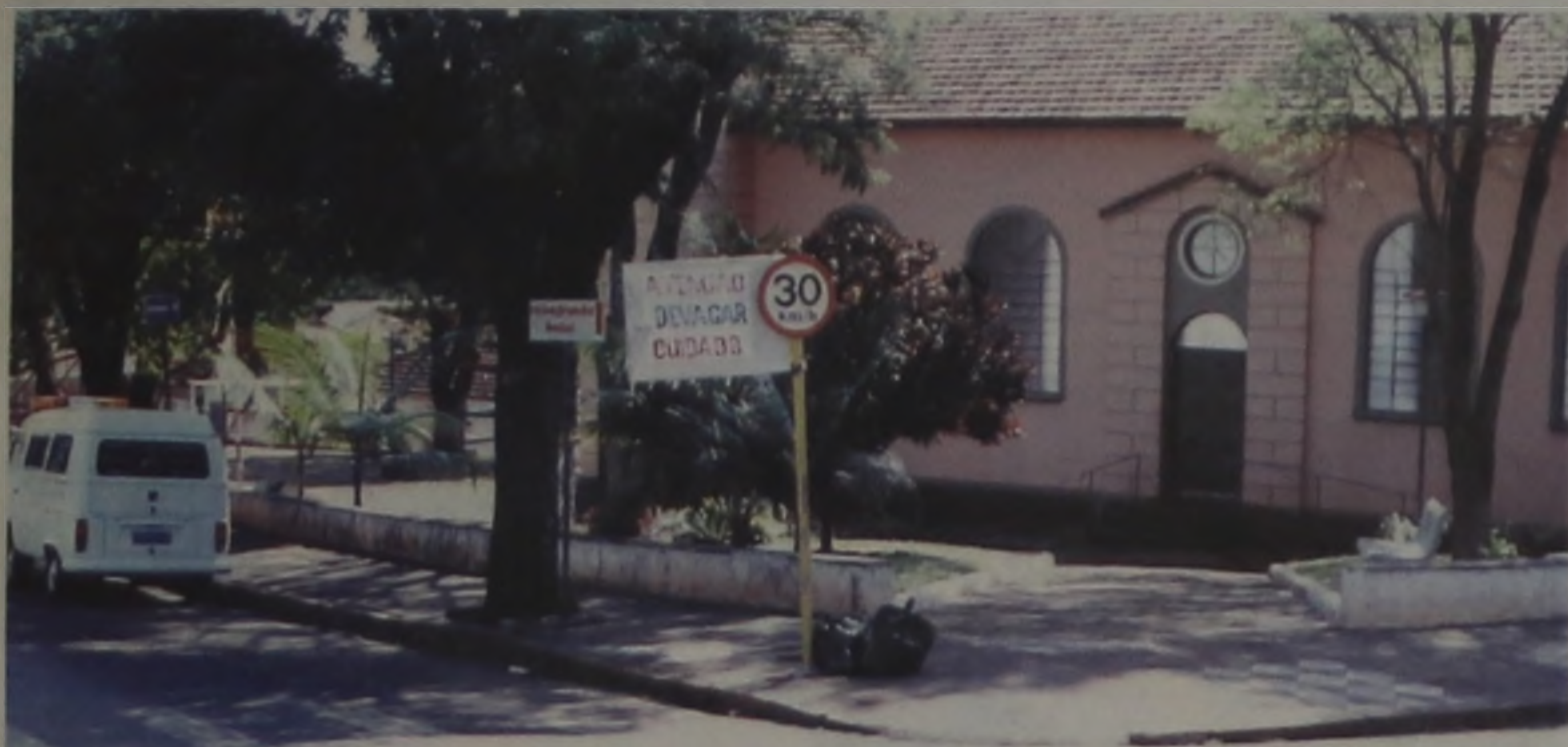
Pelas mãos do povo: Na esquina da Igreja São Benedito, algum cidadão fez o que a Prefeitura não faz: colocou a placa "Atenção, devagar, cuidado". É um caso que merece a atenção das autoridades do setor.