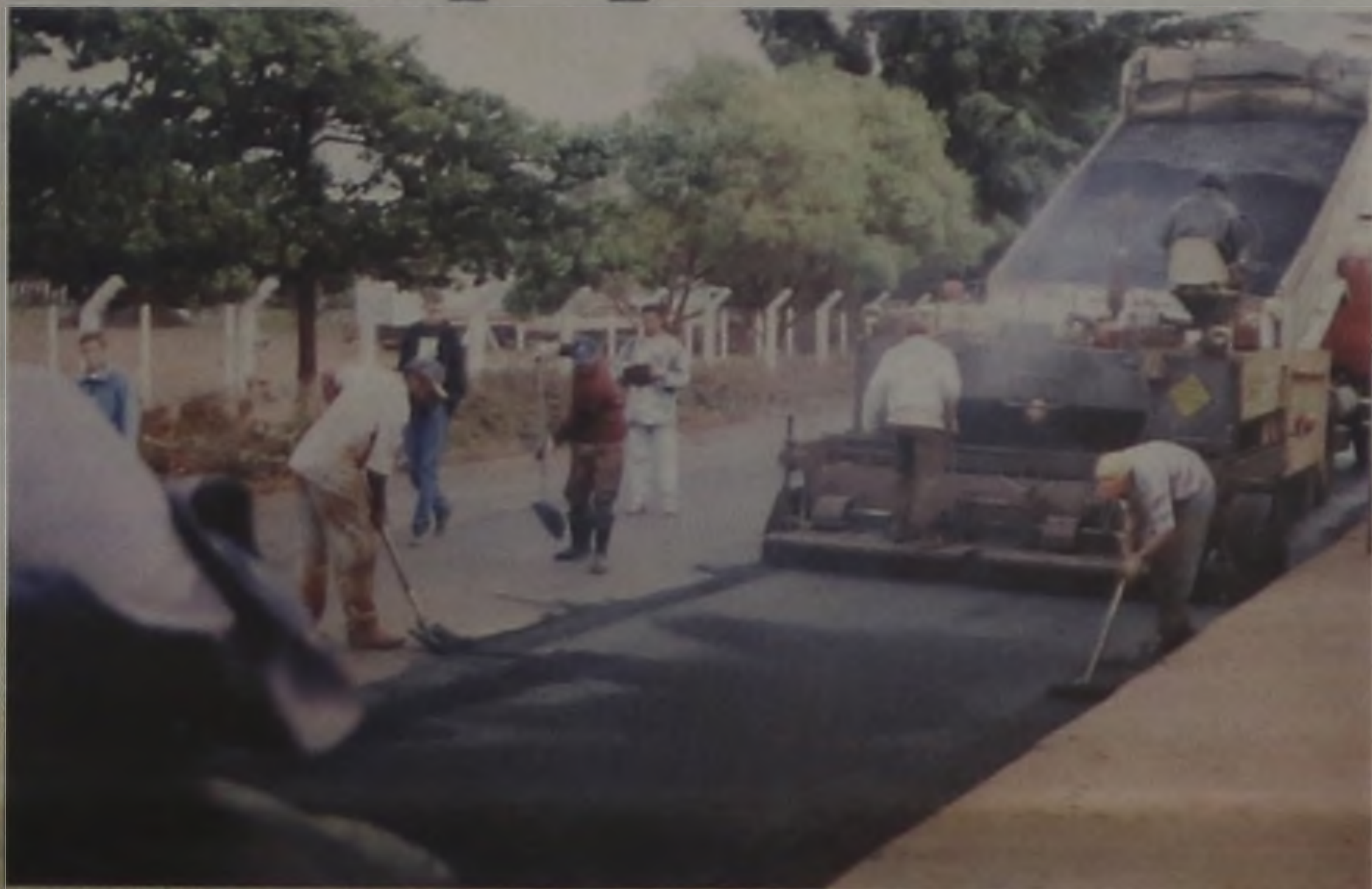
Segundo estimativas do diretor de obras, serão gastos mais de R$ 250 mil em recapeamento

A prefeitura está fazendo o recapeamento de 30 mil metros quadrados de vias pu-