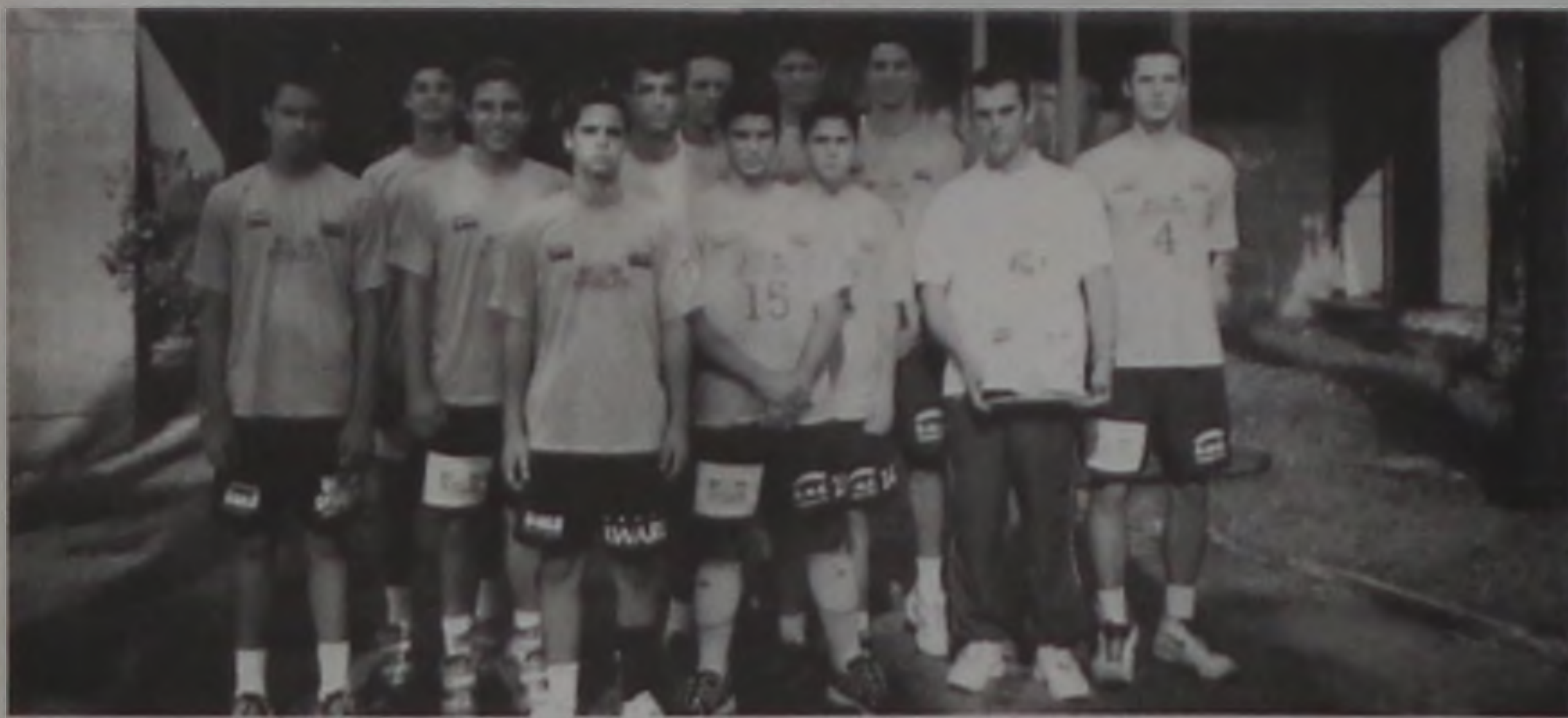
A equipe do Projeto Vôlei joga hoje em Araras e amanhã no CSEC

A equipe juvenil (até 19 anos) do Projeto Vôlei retorna suas atividades neste sábado, 7, às 18h na cidade de Araras onde enfrenta o time daquela cidade pela série ouro do Campeonato Paulista da Associação Pró-Voleibol (APV). Amanhã, o time volta a quadra para jogar contra a