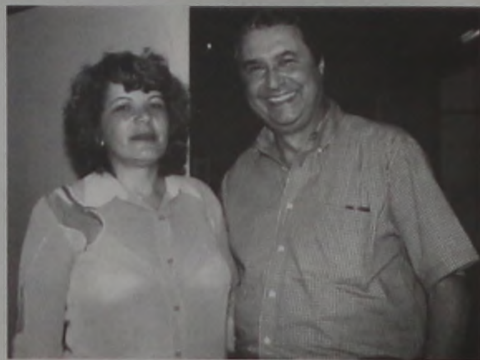
Honraria foi aprovado por unanimidade na Câmara

Exerceu três mandatos de Deputado Federal e teve 147 proposições aprovadas para a Constituinte, fato que lhe deu o título de parlamentar paulista com maior número de emendas incorporadas ao texto constitucional. Exerceu também, o cargo de Secretário