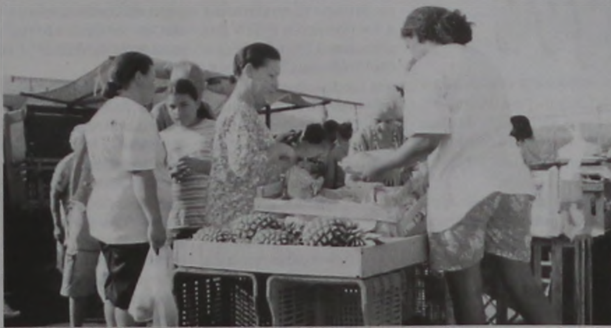
A realização da feira livre era uma antiga reivindicação dos moradores

A instalação do Varejão do Jardim Açaí foi viabilizada graças a uma parceria entre a Prefeitura Municipal e a Associação de Moradores