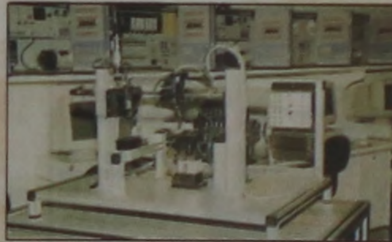
Laboratório de CLP completo com plantas didáticas de simulações e processos