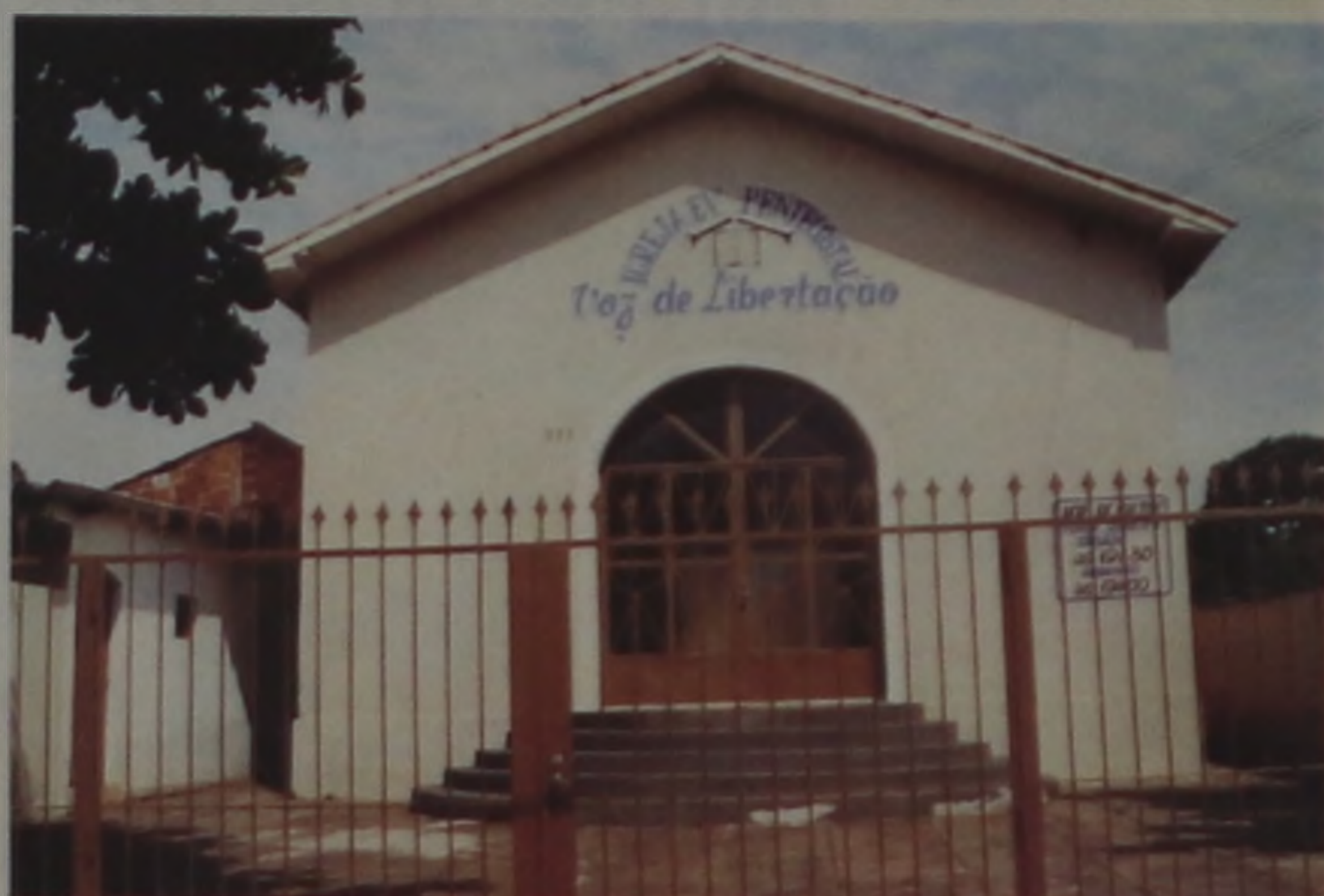
A Igreja Pentecostal "Voz da Libertação", fica na rua Piedade, 800