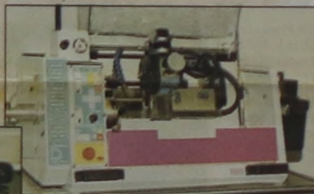
Torno CNC didático, do laboratório de manufatura integrada