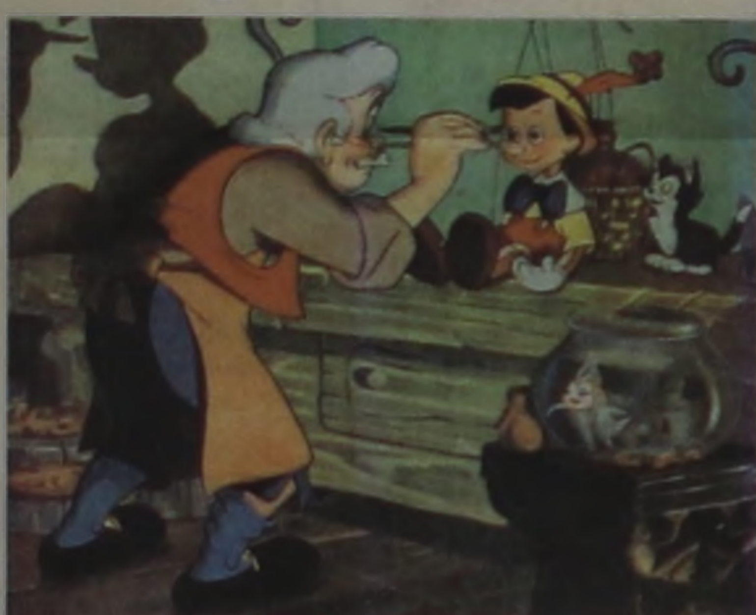
A fábula de Pinóquio completa 120 anos

Conforme a história vai sendo narrada pelas monitoras Meiry e Therezinha, são mostrados pequenos painéis, com