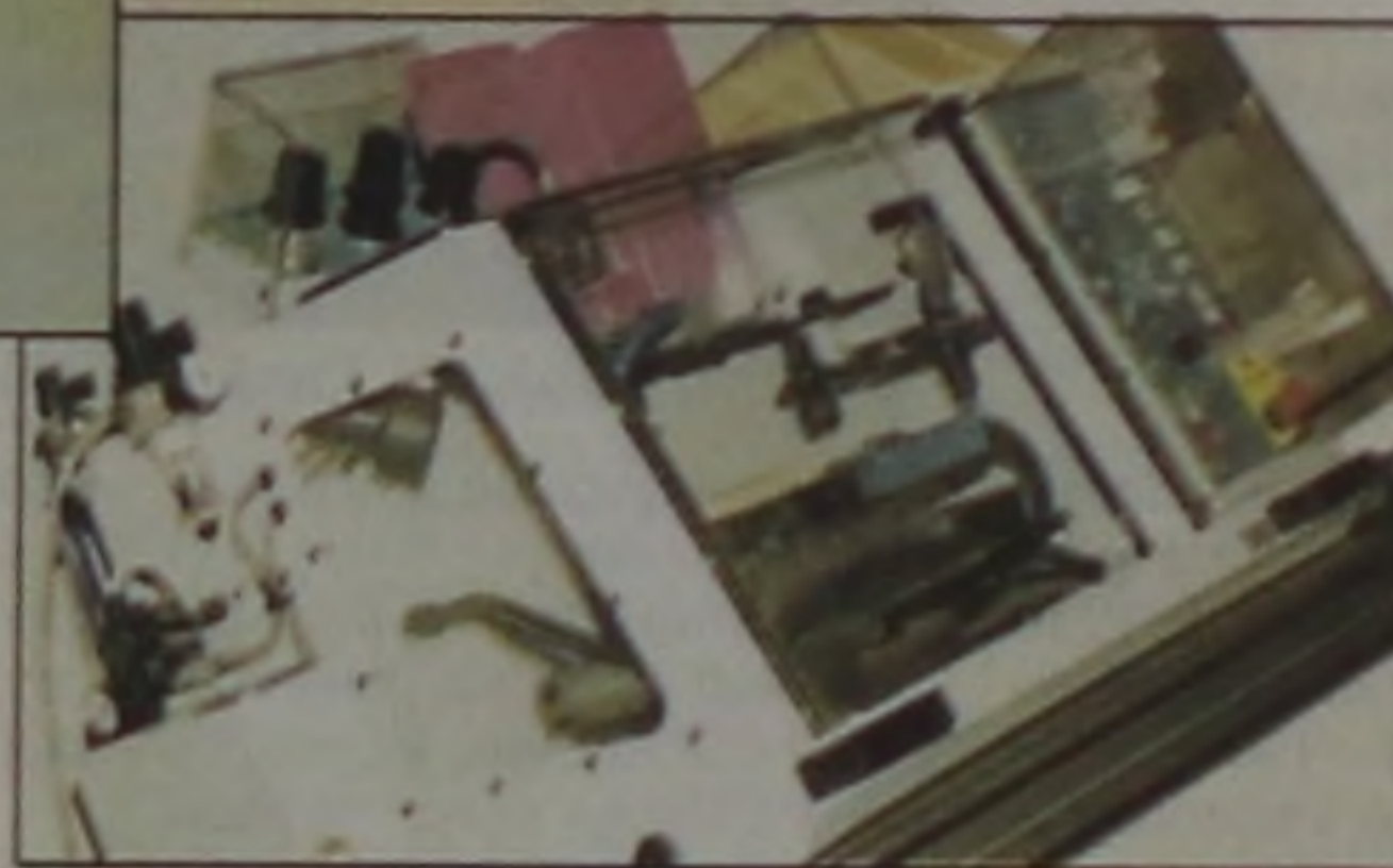
Fresa CNC didática, do laboratório de manufatura integrada